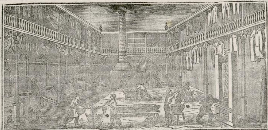
(Vista interior del obrador y laboratorio.)