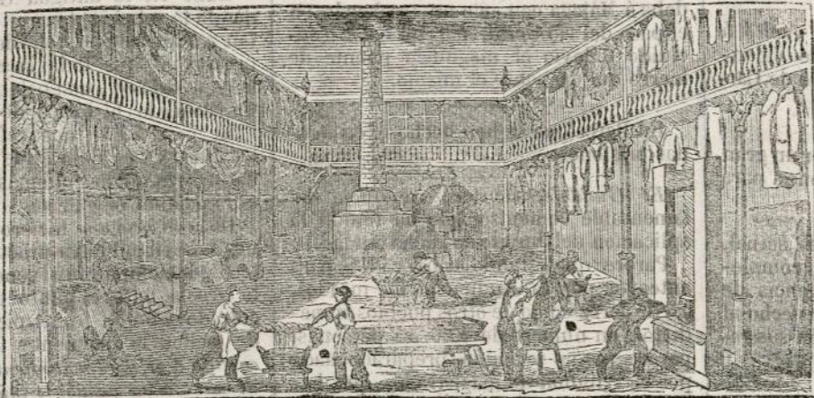
(Vista interior del obrador y laboratorio.)