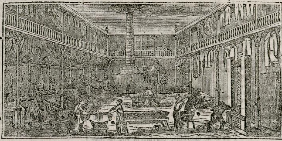
(Vista interior del obrador y laboratorio.)