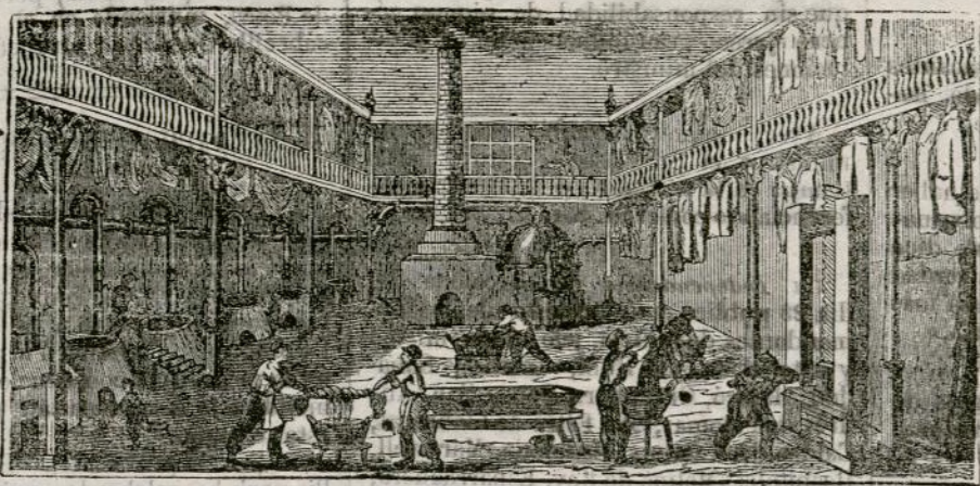
(Vista interior del obrador y laboratorio.)