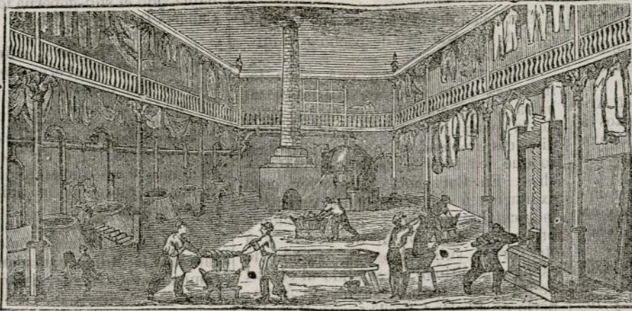
(Vista interior del obrador y laboratorio.)

Se sirven pedidos a provincias con el aumento de un real por tomo franco de porte.