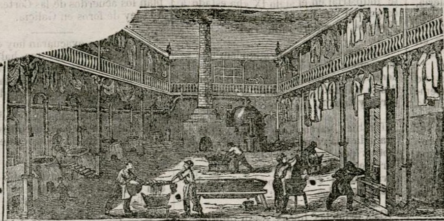
(Vista interior del obrador y laboratorio.)

Se sirven pedidos á provincias con el aumento de un real por tomo franco de porte.