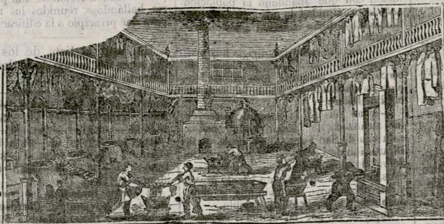
(Vista interior del obrador y laboratorio.)