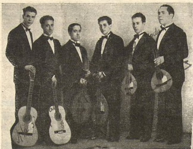
SEXTETO I. ALBÉNIZ

Notable agrupación granadina que ha dado con gran éxito un concierto en el Salón Nacional, de Granada, y que está realizando una brillantísima tournée por toda España.