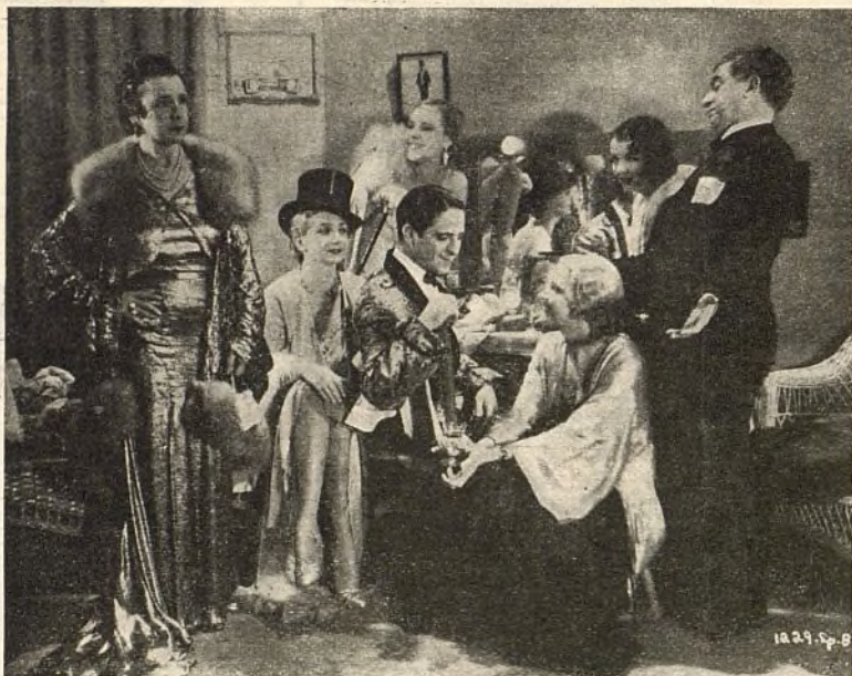
Roberto Rey, el simpático astro de la pantalla hispano parlante que ha sido nuestro huésped, en una escena de la graciosa película «Gente alegre».