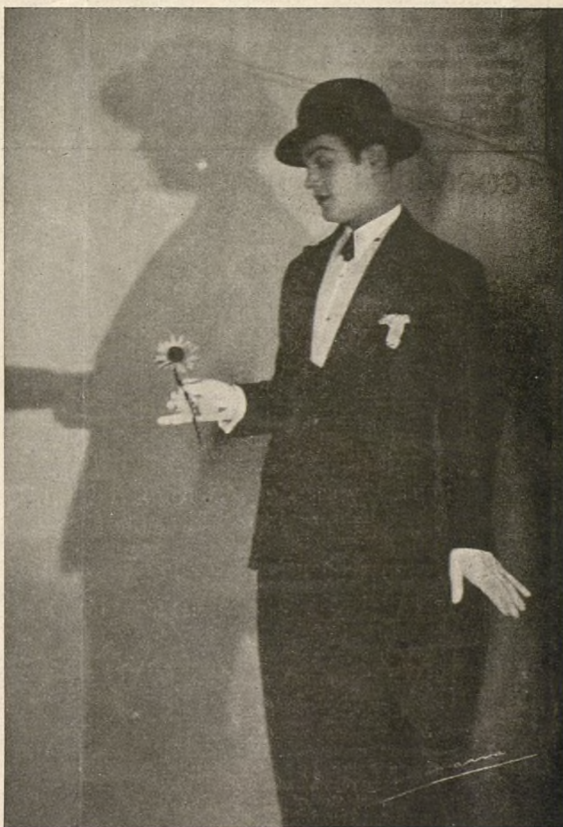
ALADY "EL GANSO DEL HONGO"