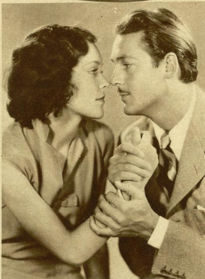
CHARLES FARRELL y MAUREEN O'SULLIVAN