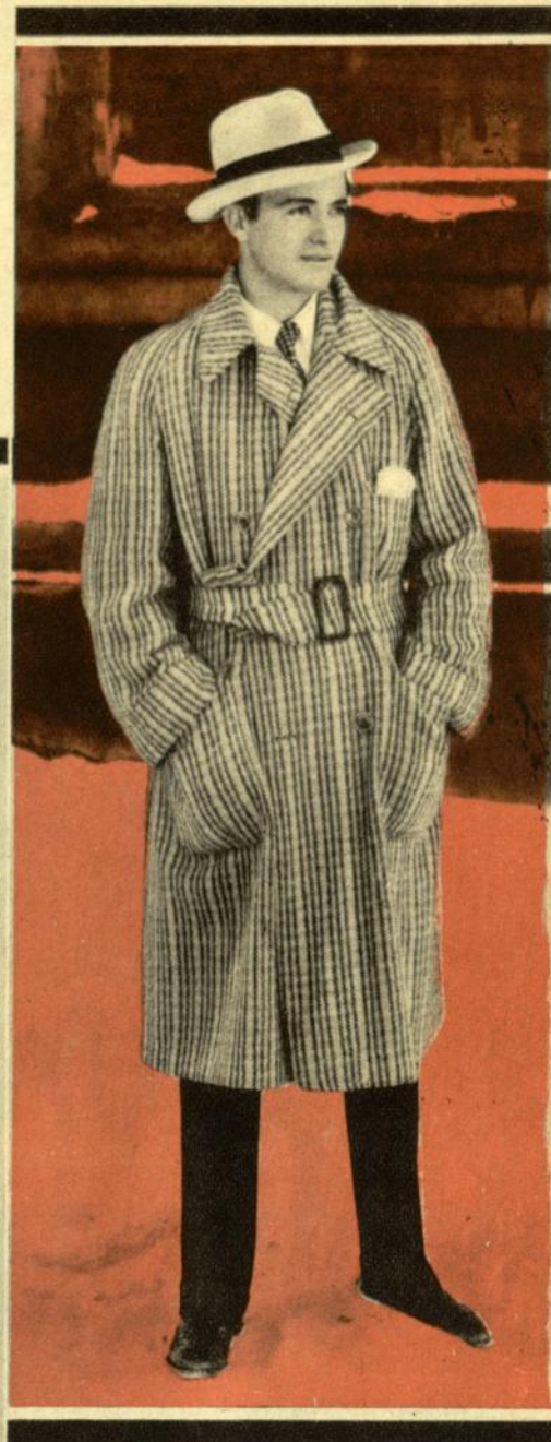
CHARLES ROGERS de la Paramount con un mo- derno abrigo de diario.