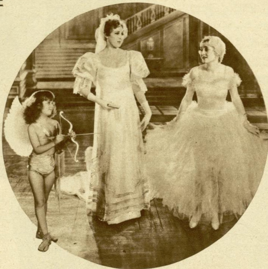
Jeannette Loff en una escena de «El Rey del Jazz»

LA moda es tan intransigente, que no deja a nadie libre de sus furibundos mandatos, a veces, caprichos absurdos. La mujer es propicia a todas las veleidades de la moda. Después de muchos años de lucha para lograr la estética y cómoda falda corta, ahora, el poco ingenio de los modistos, la vuelve a la anti-higiénica falda hasta los talones, que se ponen las hijas de Eva, sin el menor pretexto.