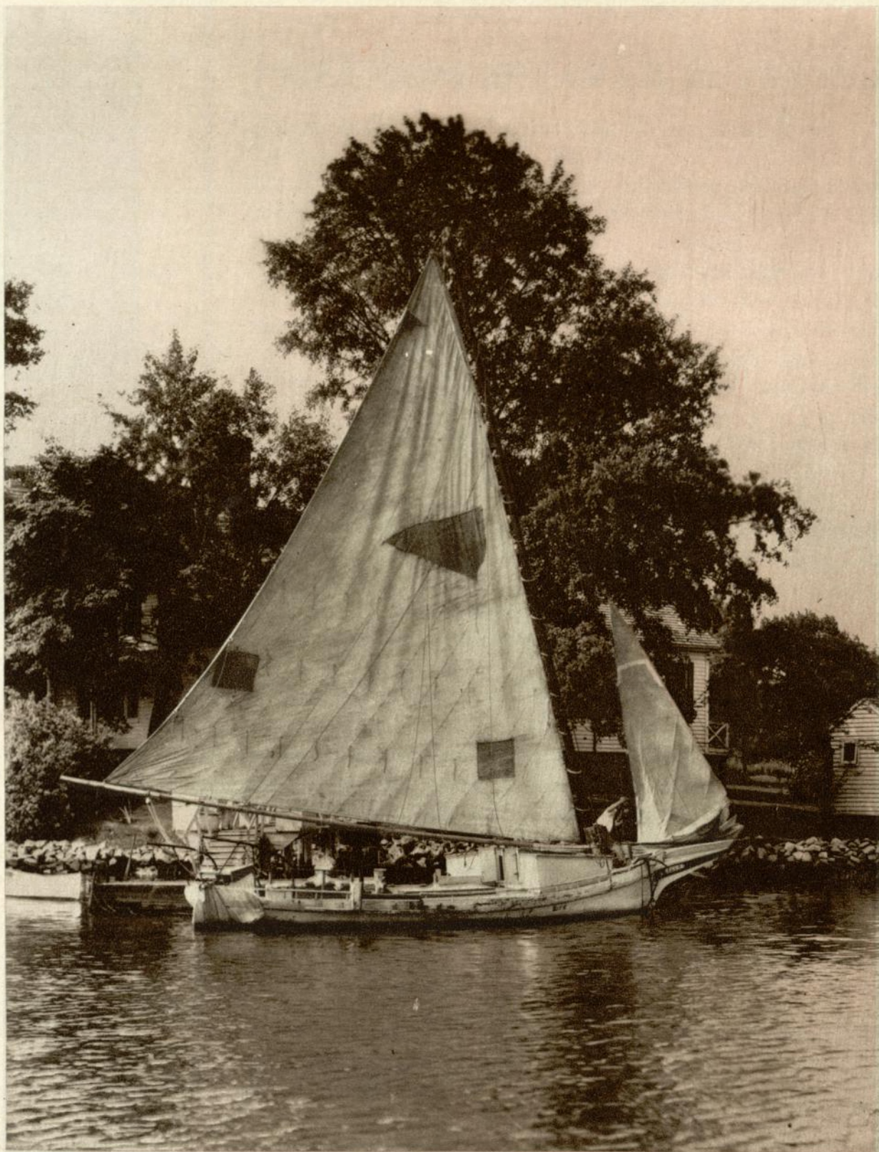
Escena del film "Todo un hombre"