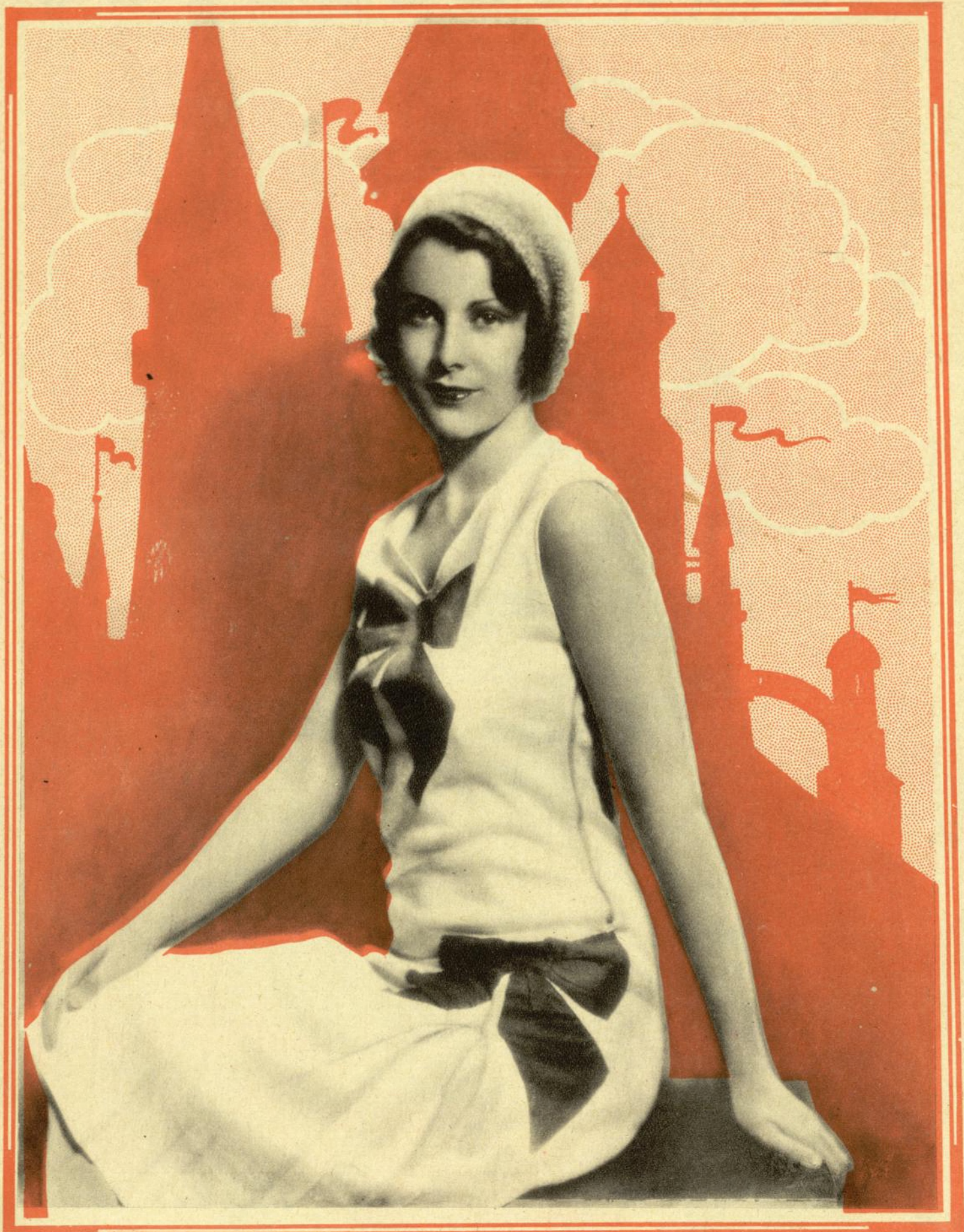
La joven y bella artista de la Paramount FRANCES DEE, gusta todavía de fantásticos castillos de ensueño, no sabemos si por ellos en sí o por el señor de los mismos.