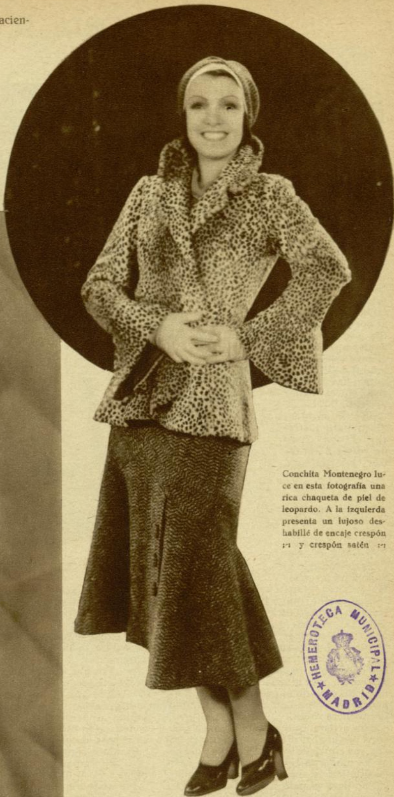
Conchita Montenegro luce en esta fotografía una rica chaqueta de piel de leopardo. A la izquierda presenta un lujoso deshabillé de encaje crespón y crespón satén.