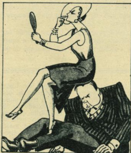
JANNINGS. — La víctima de las malas mujeres