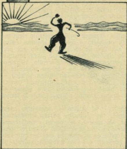
CHARLOT. — El eterno abandonado.