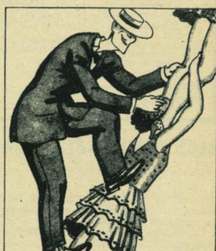
CHEVALIER. — El anti-Jannings. Por las mujeres asciende.