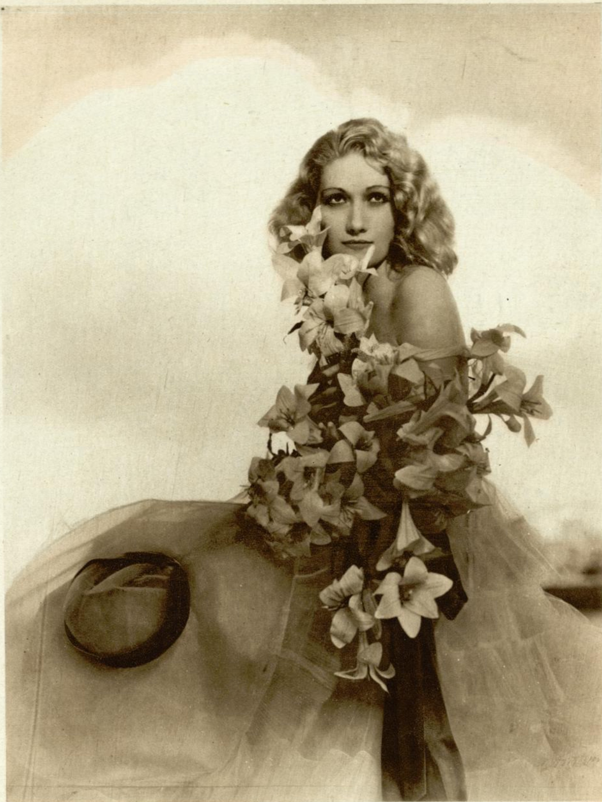
La admirable e intrépida artista de la M.-G.-M. Edwina Booth