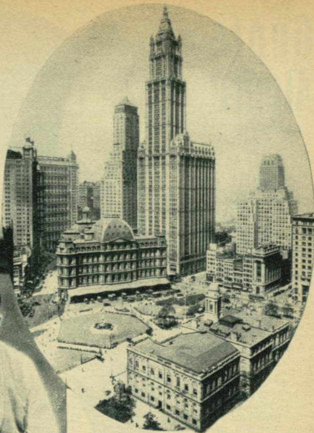
Norteamérica ha sido la creadora de los rascacielos...