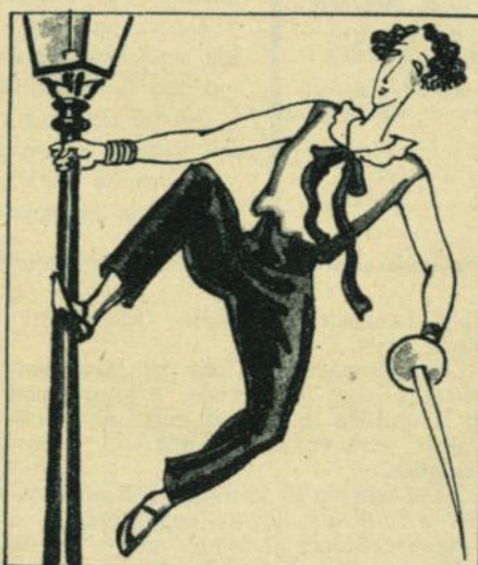
BEBE DANIELS. — Más fuerte que Douglas.