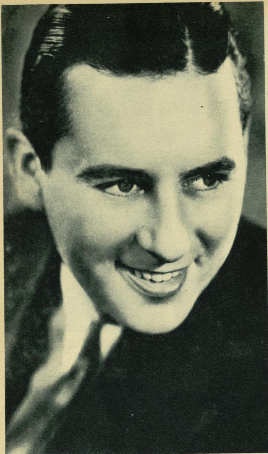
Ben Lyon no puede asegurarse en qué año nació, aunque sí se sabe que fué el día 6 de febrero.