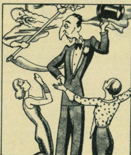
MENJOU. — El vencedor de las damas y del tiempo.