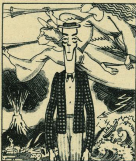
Buster KEATON. — Impasible hasta en el día del Juicio Final.