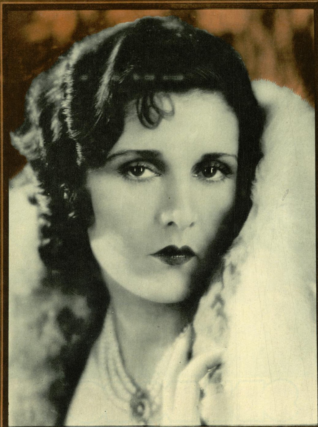
La fascinadora estrella EVELYN BRENT, protagonista con Emil Jannings y William Powell de la película Paramount, «La última orden».