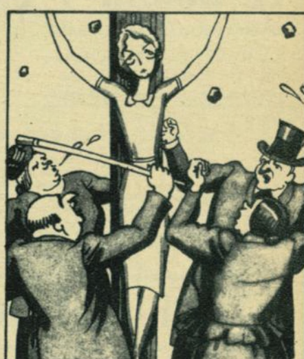
LILIAN GISH. — La víctima de la sociedad.