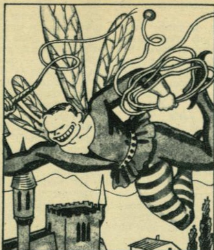
DOUGLAS. — El hombre libélula.