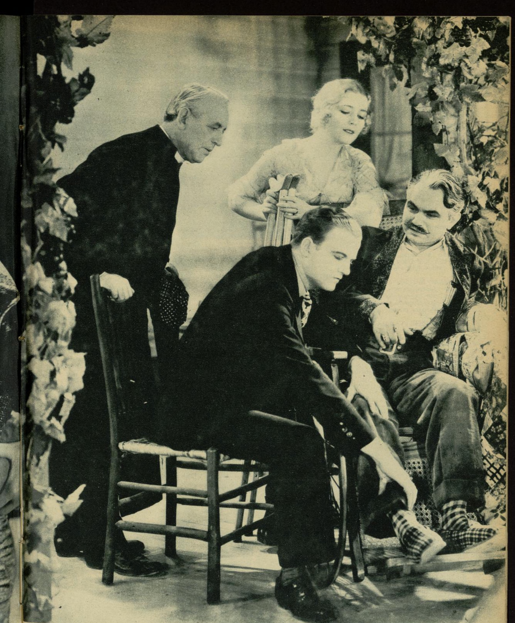
Una de las más interesantes escenas de la película M.-G.-M. dirigida por Victor Seastrom titulada «La mujer que amamos» de la que son intérpretes principales Vilma Banky, Edward G. Robinson y Robert Ames.