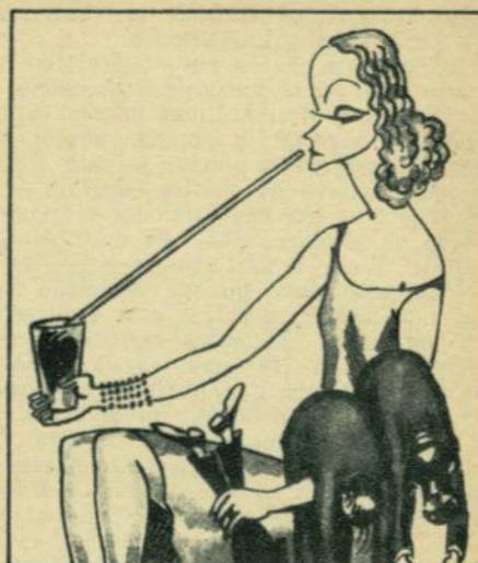
GRETA GARBO. — El vampirismo científico.