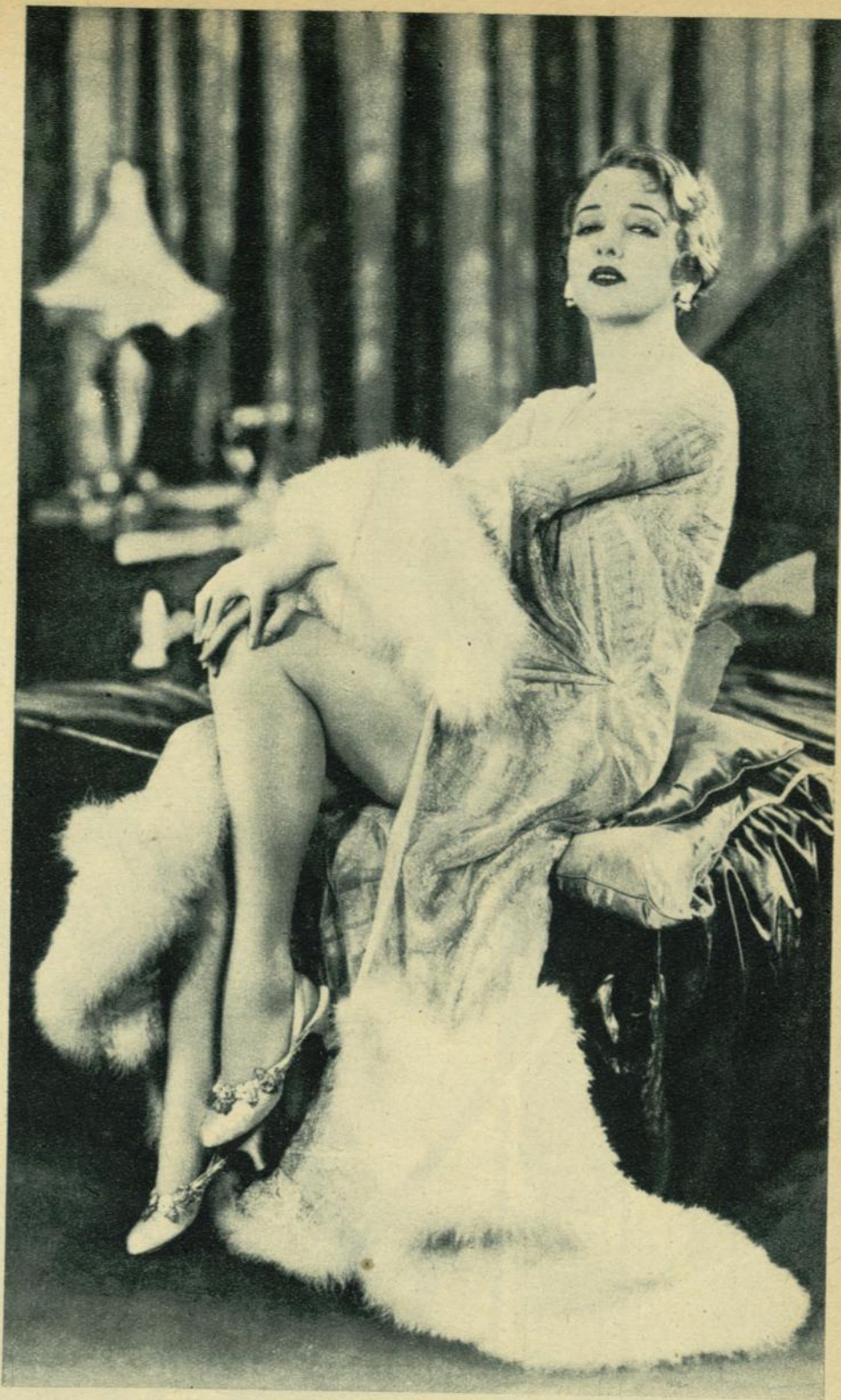
Bebe Daniels vino al mundo el 14 de cter.o mes de enero en Dallas, estado de Texas, y fué la compañera de Harold Lloyd en todas las películas de su primera época.

buen director de películas, y si por causas desconocidas tuviera que renunciar a la pantalla como actor y director, es casi seguro que se dedicaría a la aviación.