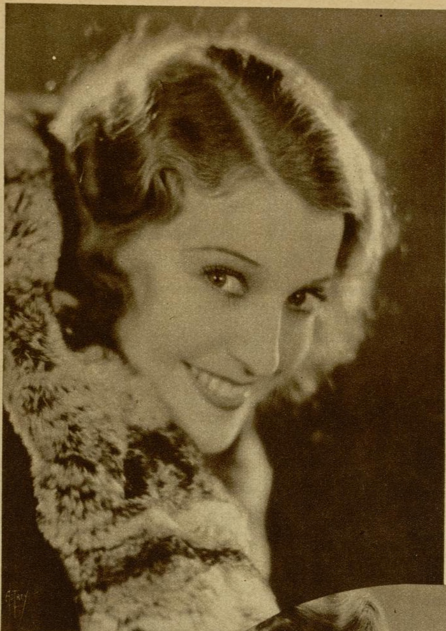
Jeanette Mac Donald