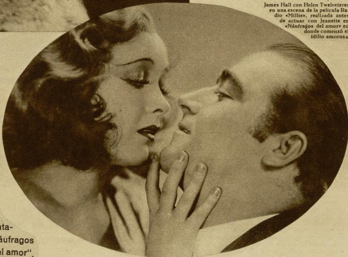
James Hall con Helen Twelvetrees en una escena de la película Radio «Millie», realizada antes de actuar con Jeanette en «Naufragos del amor» en donde comenzó el idilio amoroso

Una noticia sensacional de Abel Hadnoshaire, periodista yanqui. - El whisky y la fantasía. - El amor, sus naufragos y "Los naufragos del amor".