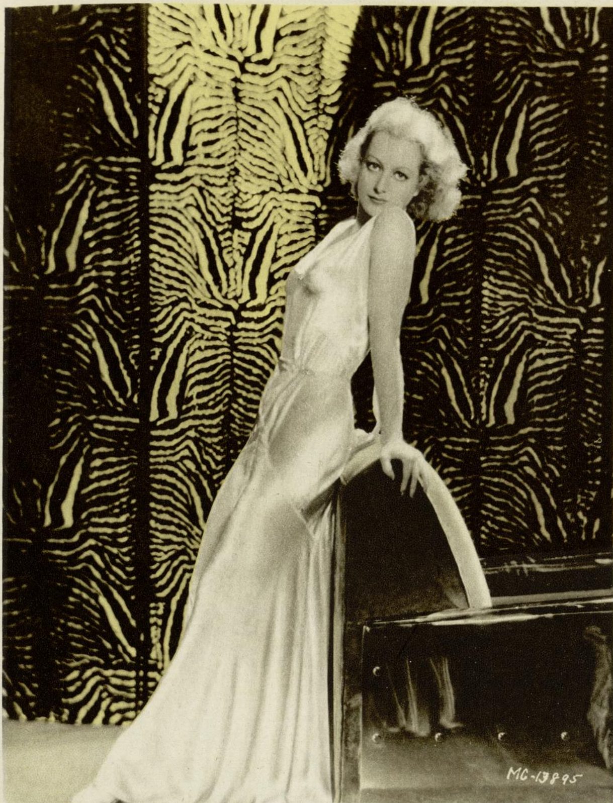
Joan Crawford, estrella de la Metro-Goldwyn-Mayer