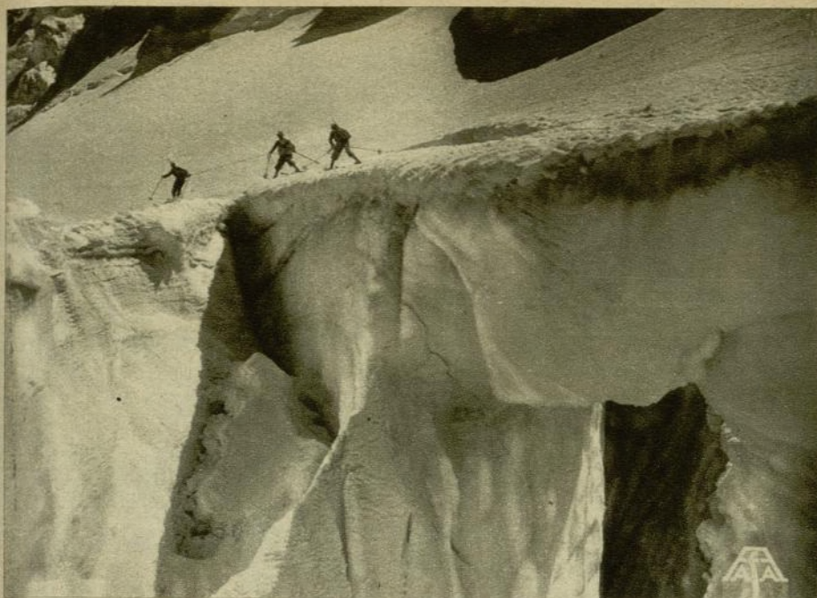
Dos momentos de Tempestad en el Montblanc, cinta dramática de Arnold Franck, que es también una de las producciones europeas de importancia exhibidas recientemente.

E. A. Dupont, que abrió inéditas perspectivas cinegráficas; «Metrópolis», de Fritz Lang, alarde, con yerros, de amplitud y ritmo a la par que de movimiento de masas, y «La pasión de Juana de Arco», de Karl Th. Dreyer, presentando su personal concepto de la expresividad plásticamente subjetiva. Europeas por completo se identifican todas estas obras. ¿Cómo negar, entonces, la influencia decisiva de Europa sobre el cinematógrafo, aunque los Estados Unidos lo aligeren de densidades, gracias a un rápido montaje, tornándolo accesible así al mayor contingente de espectadores?