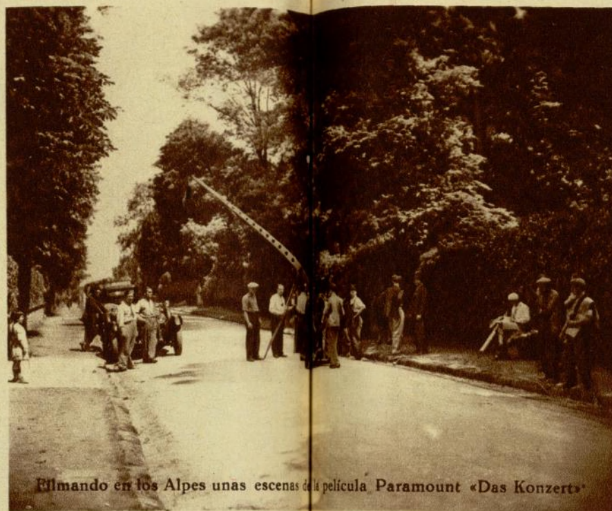
Filmando en los Alpes unas escenas de la película Paramount «Das Konzert»