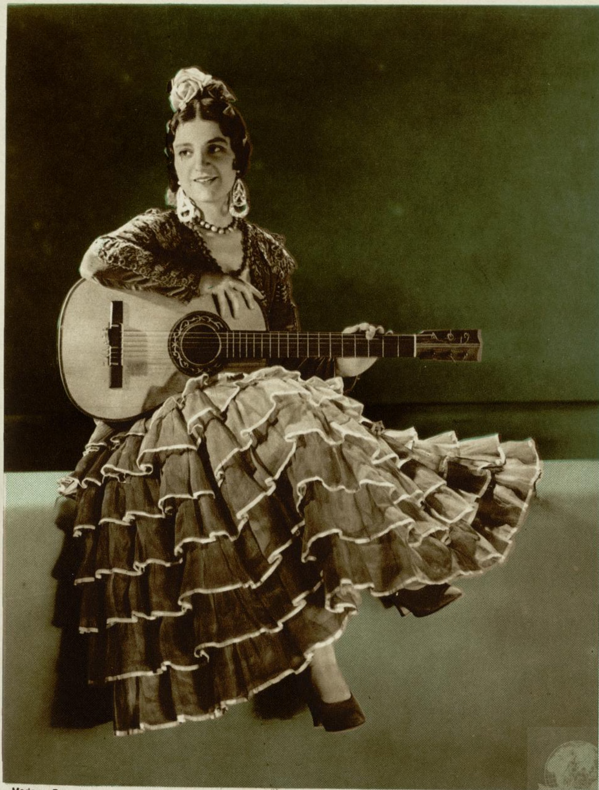
Madame Brunelleschi, protagonista de la película "Carmen", de la B. I. P.