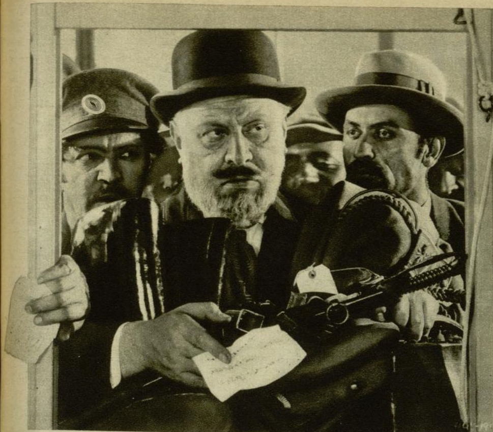
El coloso de la pantalla Emil Jannings, en la película «La última orden» que tan bien refleja la vida de los extras en el interior de los estudios.

suelo de las poderosas organizaciones de cine yanqui — no son objeto de consideración alguna. Se les considera como cantidades despreciables que deben someterse a una disciplina de hierro. A la menor infracción de los reglamentos son despedidos y se toma buena nota para no tomarlos más. Los extras lo saben y obedecen sin chistar los mandatos más brutales. El director del film y sus colaboradores los tratan sin ningún miramiento.