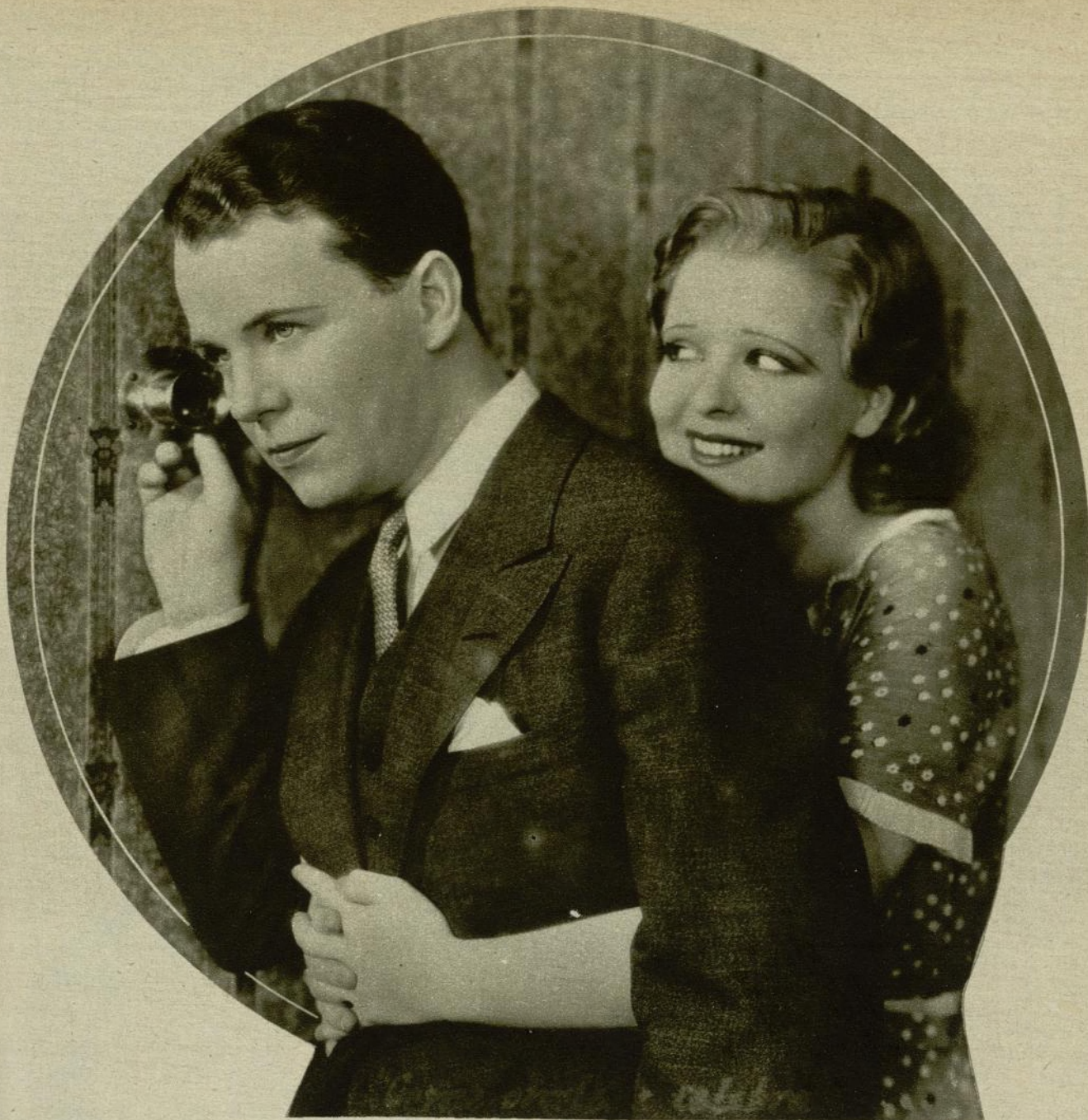
Regis Toomey y Clara Bow en una graciosa escena de la película Paramount «Kick In» (sin título en cas ellano).

Nació en Pittsburgh y recibió su educación en la Universidad de la misma ciudad. Es miembro de la Fraternidad Sigma Chi. Mide 1'70 m. y tiene el cabello castaño y los ojos azul claro. Lo más saliente de su rostro es lo atractivo de su sonrisa. Sus deportes favoritos son la natación y el boxeo. Regis Toomey es un joven de simpática figura, cuya atractiva sonrisa, descubierta a la luz de las candilejas por un director de películas, ha facilitado su ingreso en la carrera cinematográfica.