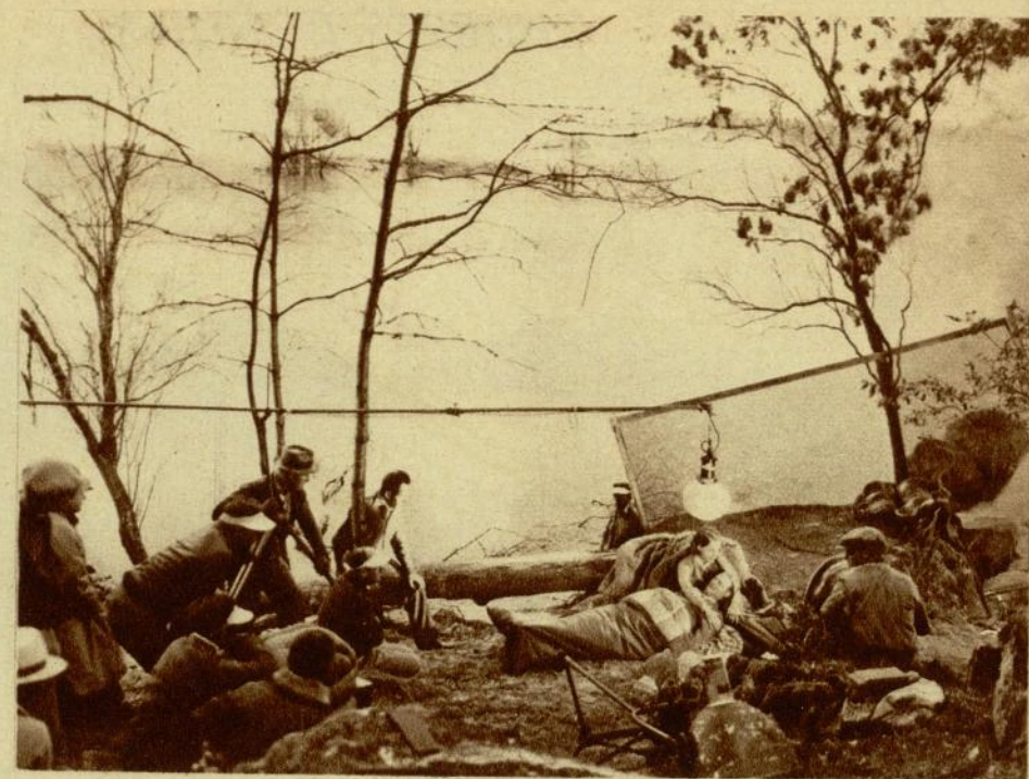
Clarence Brown dirige a Norma Shearer y a Lionel Barrymore en una escena a pleno aire de una película Metro-Goldwyn-Mayer.