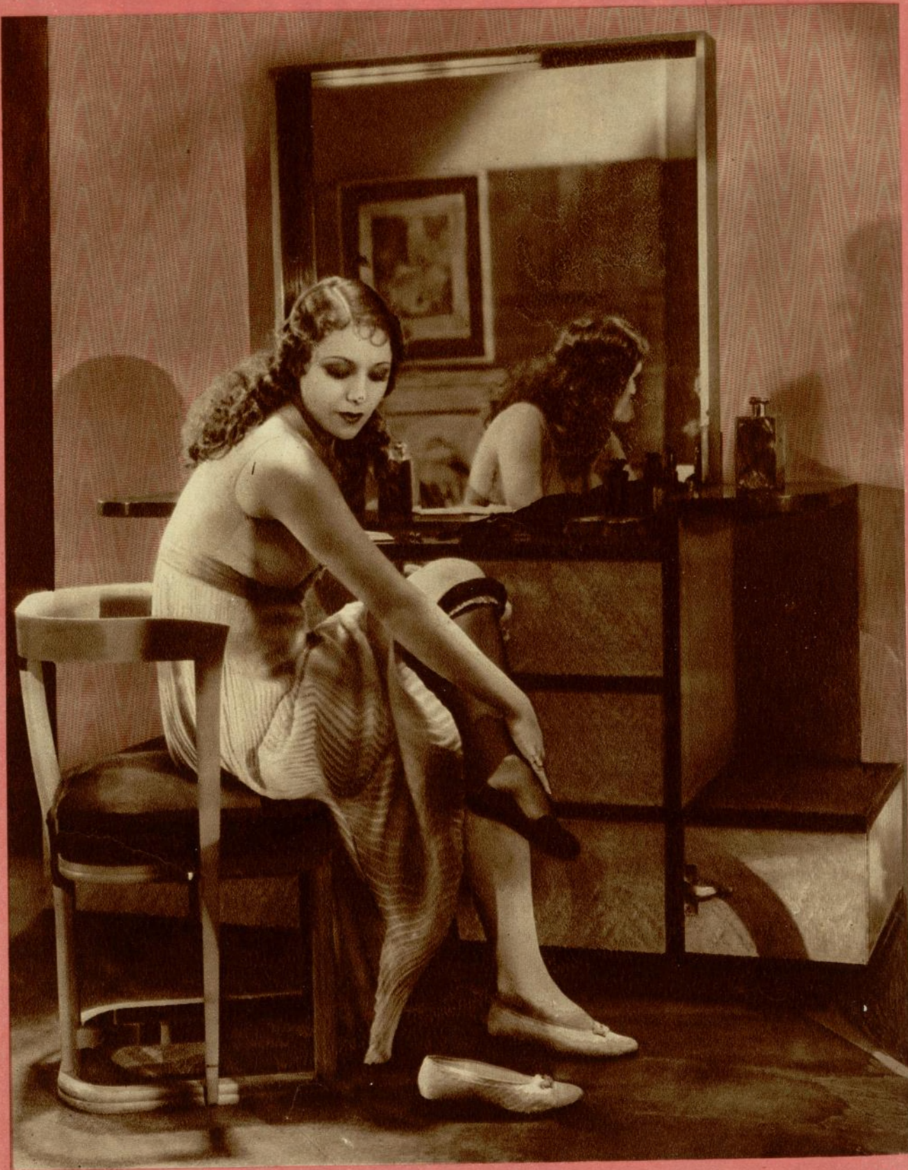
La bella estrella de habla española, Rosita Moreno, en una escena de la película Paramount «Gente alegre», de la que es protagonista en unión de Roberto Rey y Ramón Pereda.