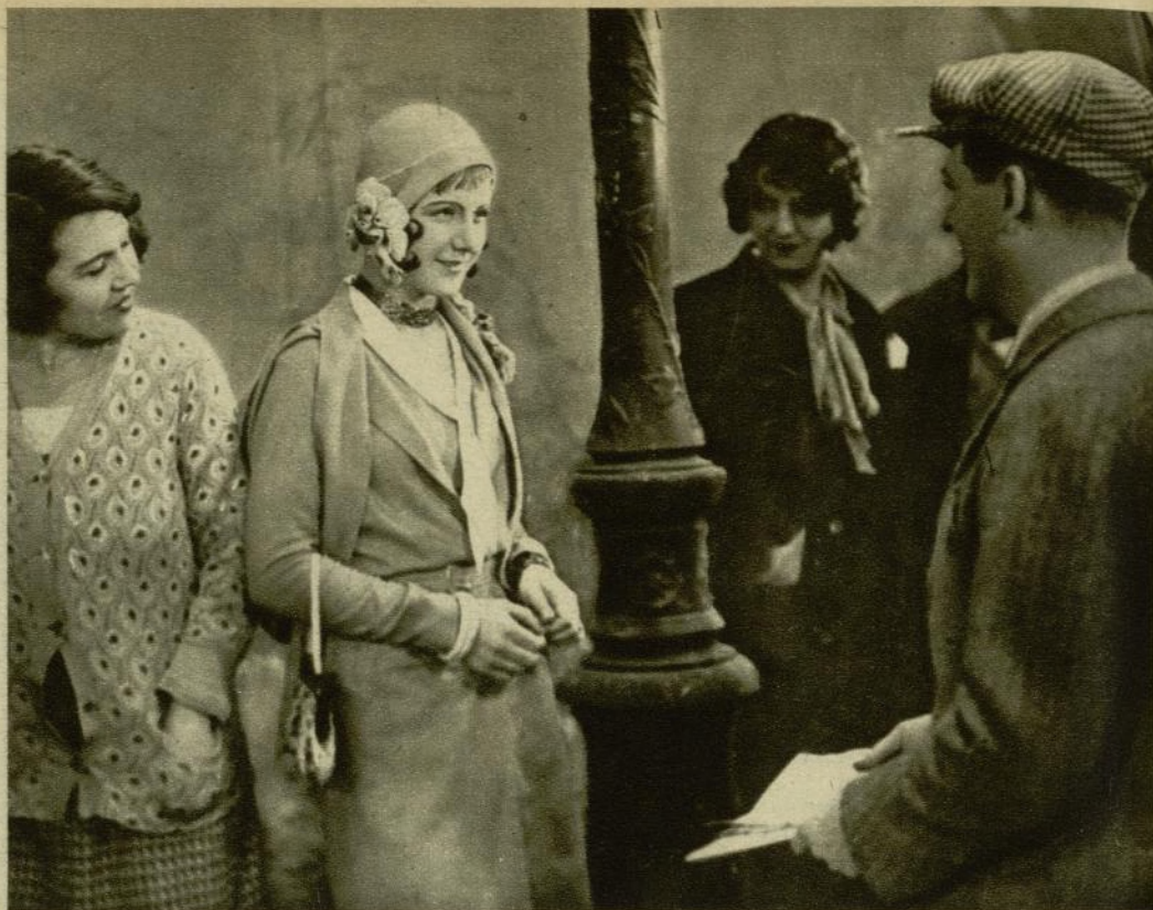
Dos escenas de la banda de René Clair Sous les toits de Paris, reconocida en un dictamen internacional como el film europeo de mayor mérito entre los proyectados durante la última tem- porada.

Si sólo revelara mérito el éxito que en cada país obtienen las películas yanquis, nadie osaría contestarlo; mas no siempre obedece el éxito multitudinario al mérito, sino