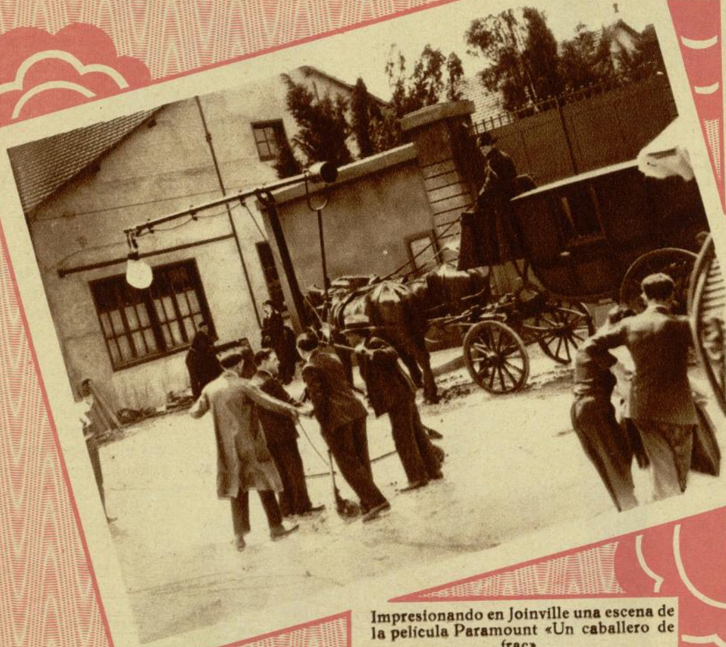
Impresionando en Joinville una escena de la película Paramount «Un caballero de frac».