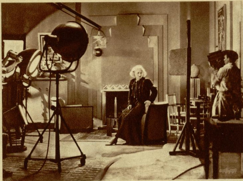
Este es el «ambiente» que rodea a Joan Crawford cuando la estrella de la Metro-Goldwyn se eleva a las altas cumbres dramáticas (¡Y luego se habla de inspiración!)