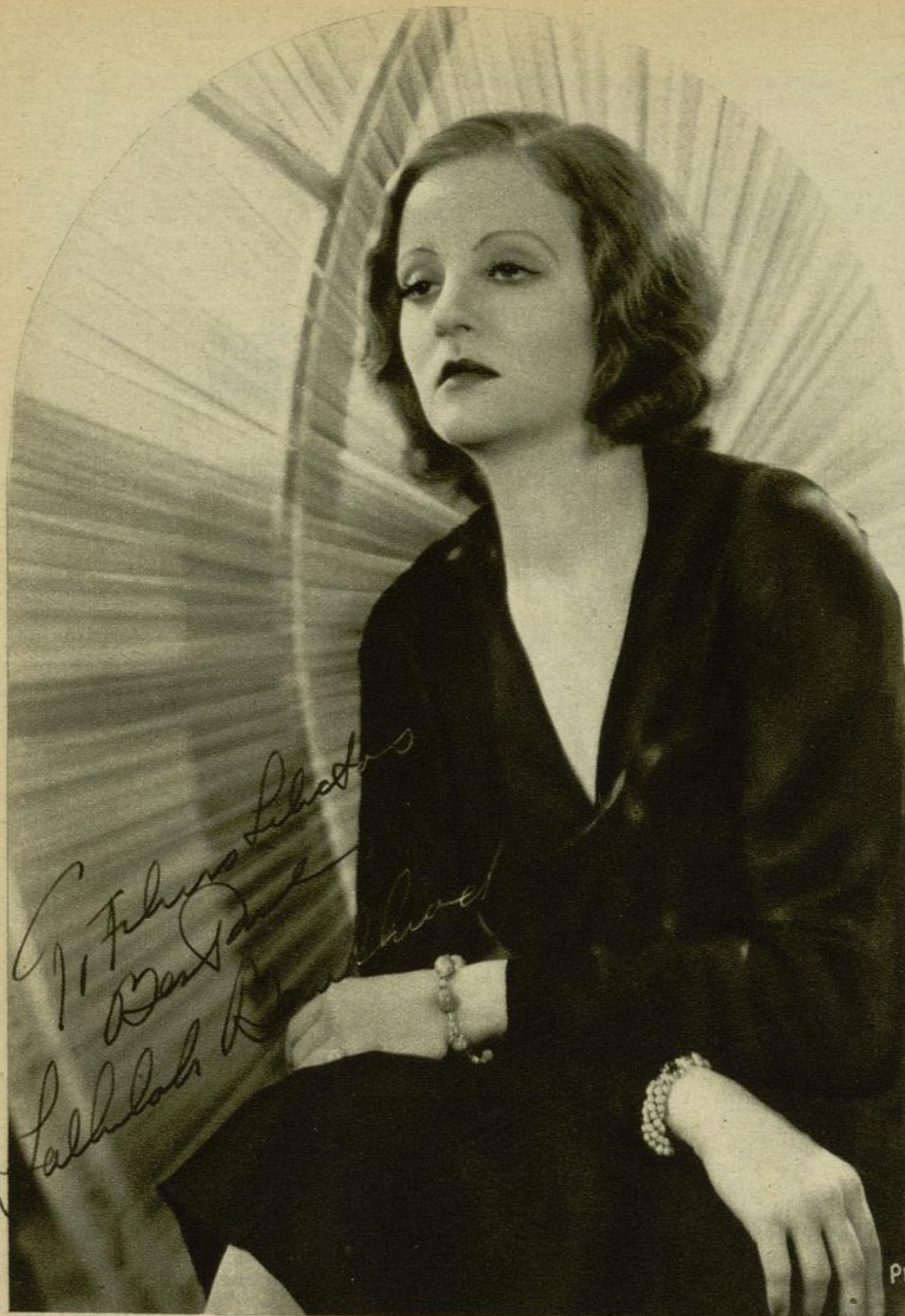
Escena y pantalla