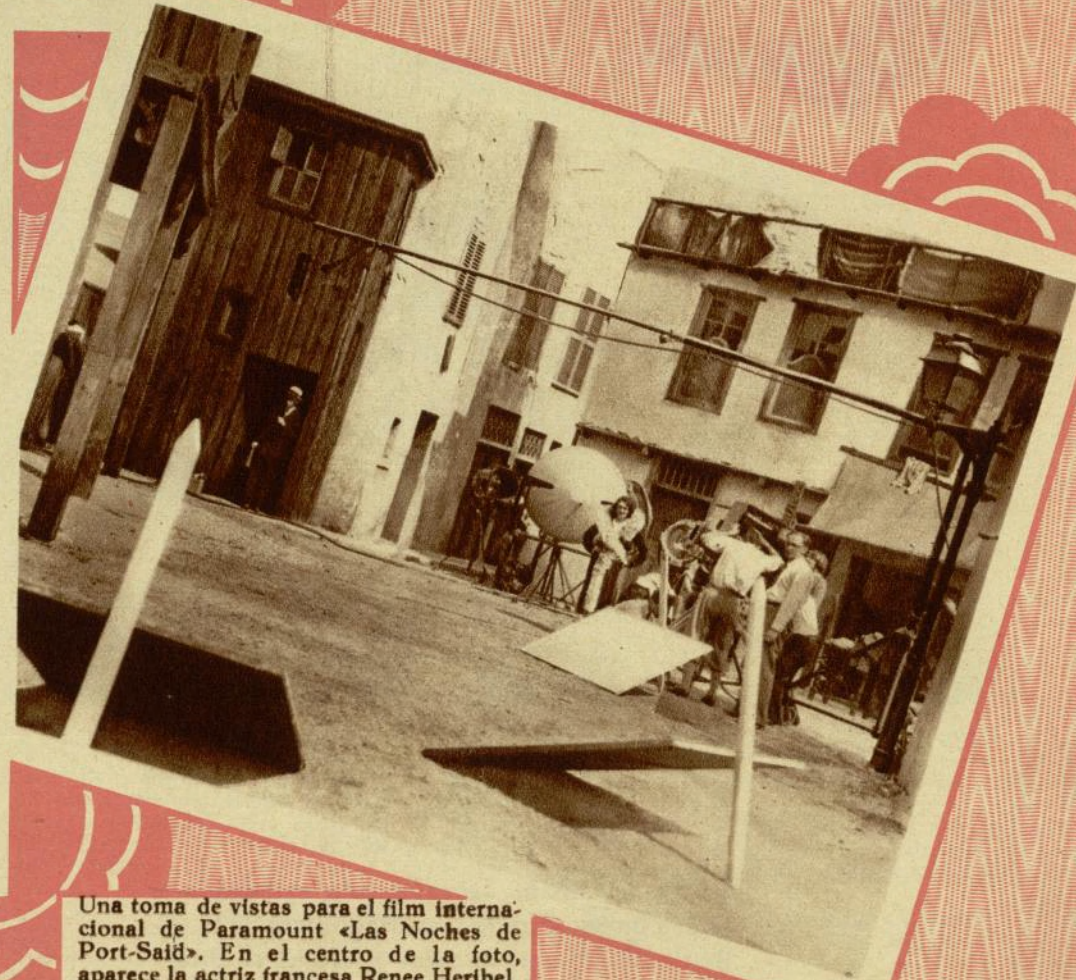
Una toma de vistas para el film internacional de Paramount «Las Noches de Port-Saïd». En el centro de la foto, aparece la actriz francesa Renee Heribel.