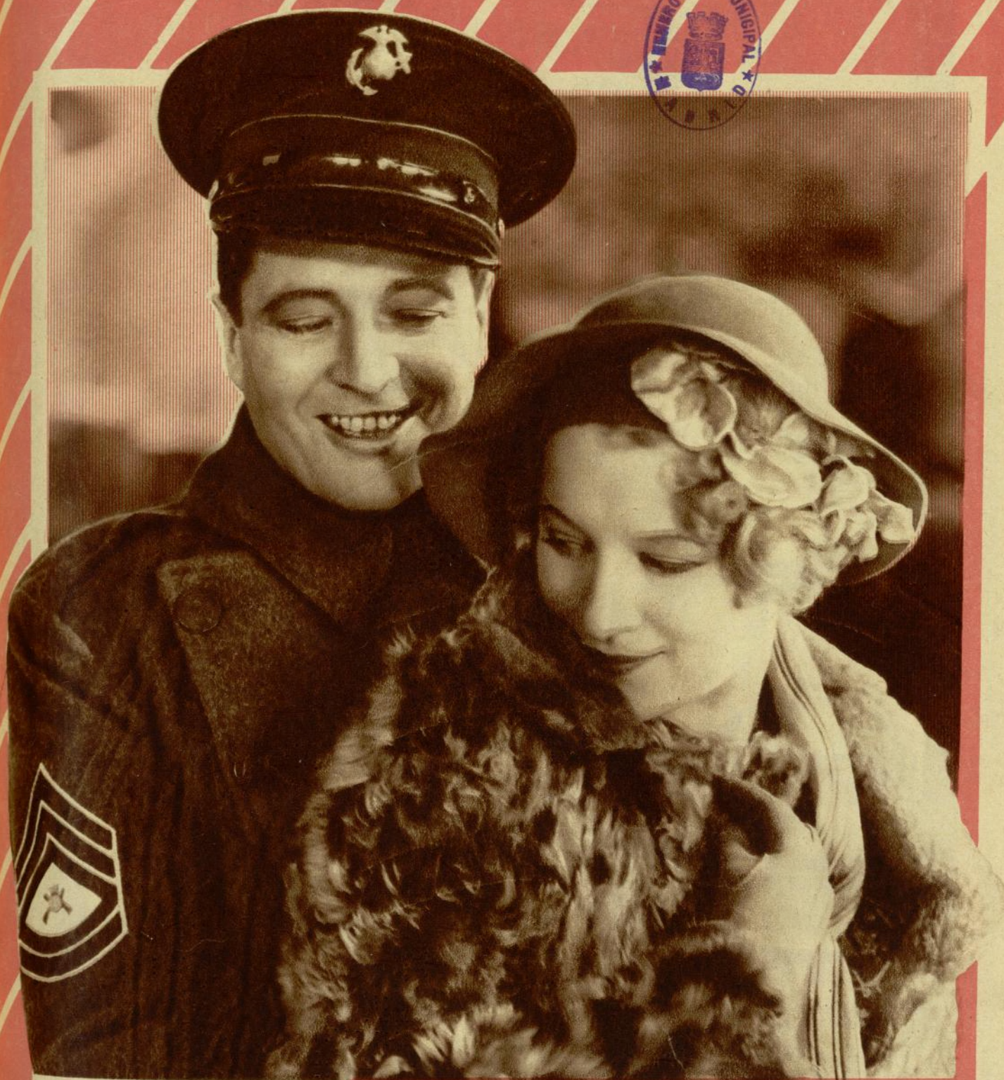
Greta Nissen y Edmond Lowe, en la película Fox, «¡Vaya mujeres!»