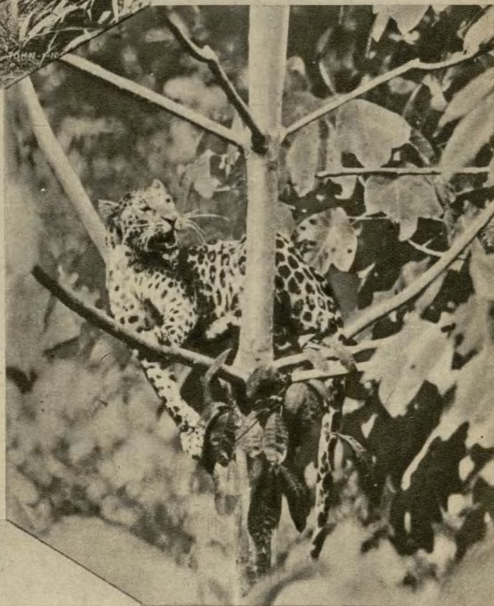
Una escena del film documental «Cazando fieras vivas»

Aquella época del «parece de cine» es Menjou, con su frac, su cinismo, su elegancia y su bigote; sobre todo su bigote, cuento de Bocaccio con música de Franz Lehar. Y son sus films: «El cisne», «La gran duquesa y el camare-