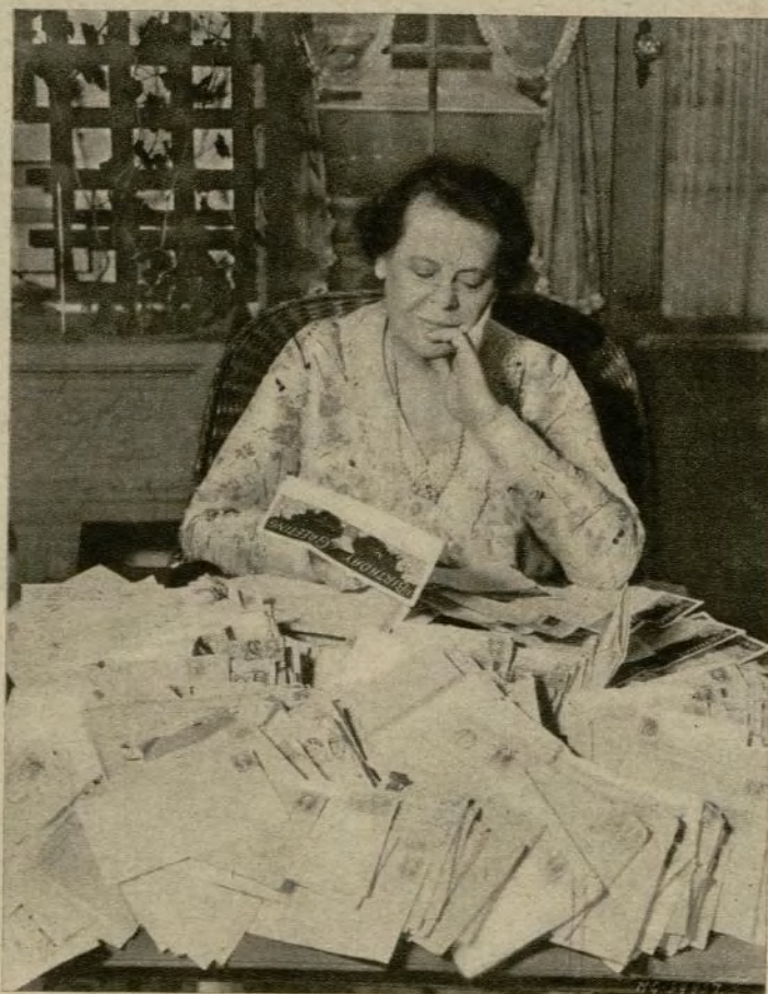
Marie Dressler, la popular estrella de la M.-G.-M., fotografiada con una pequeña parte de la avalancha de cartas que recibió al cumplir sesenta y dos años.

El director de esta producción Paramount, que es Jo-