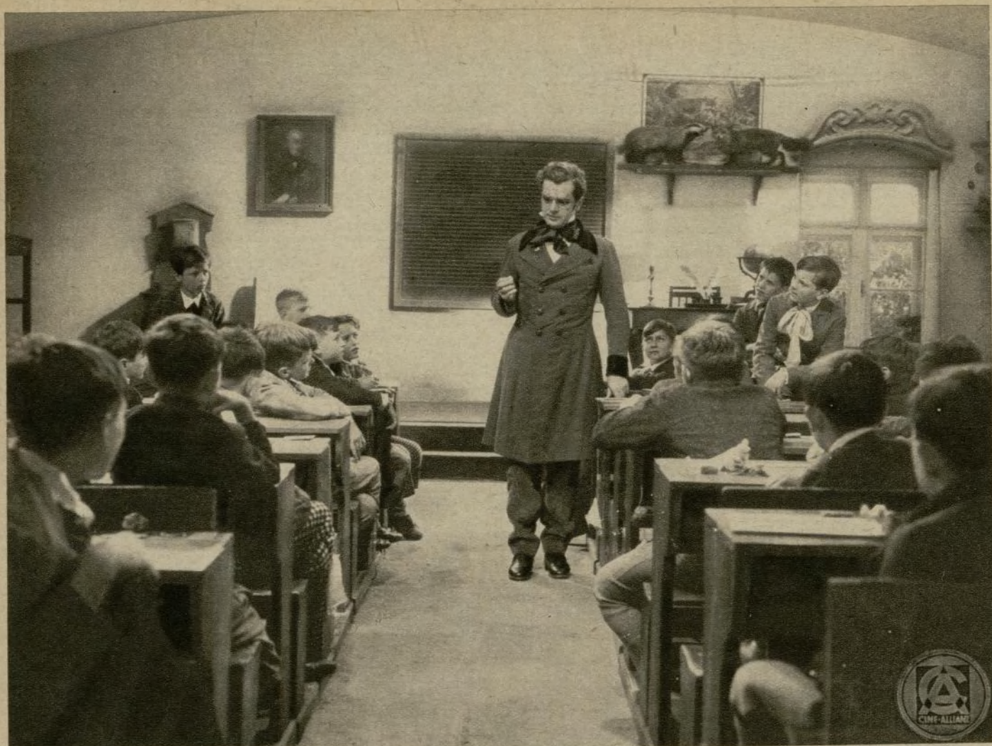
Una escena de la artística película «Vuelan mis canciones»