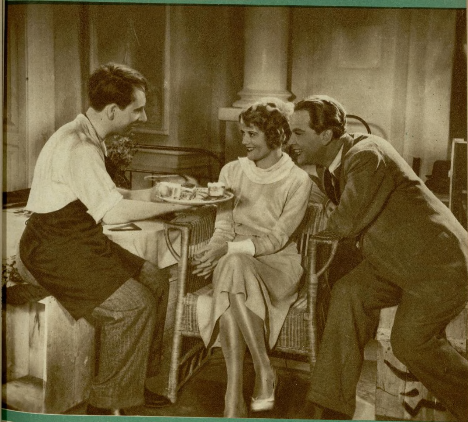
Una escena del divertido film «Un hombre de cora- zón», que próximamen- te nos darán a conocer las «Exclusivas Huet»