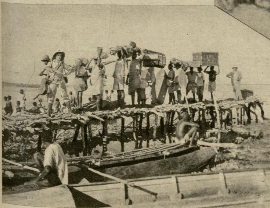
Transportadores del equipaje en la película «Trader Horn»