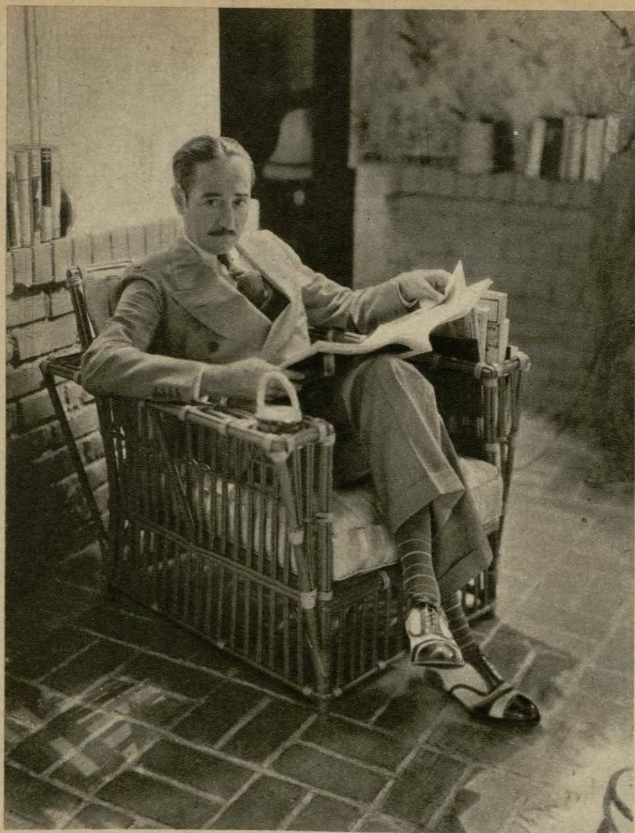
Adolphe Menjou solazándose en el pórtico de su residencia en Hollywood.