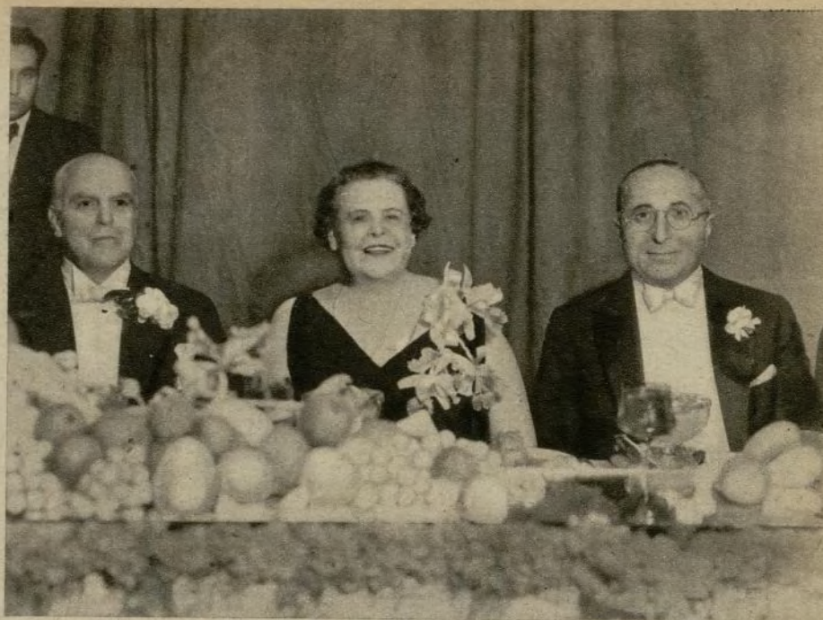
Presidencia del banquete ofrecido por la M.-G.-M. en honor de Marie Dressler al cumplir sesenta y dos años. A la izquierda de Marie, el gobernador de California James Rolph. A la derecha, Louis B. Mayer, el anfitrión.

JACKIE Searl, el chiquillo que se hizo famoso en el cine por sus notables interpretaciones en «Las peripecias de Skippy» («Skippy») y «Dos soldaditos» («Sooky»), acaba de ingresar en el reparto de una de las próximas películas de la Paramount, «Alicia en el país de las maravillas» («Alice in Wonderland»), versión de la obra de Lewis Carroll que, como se sabe, es una