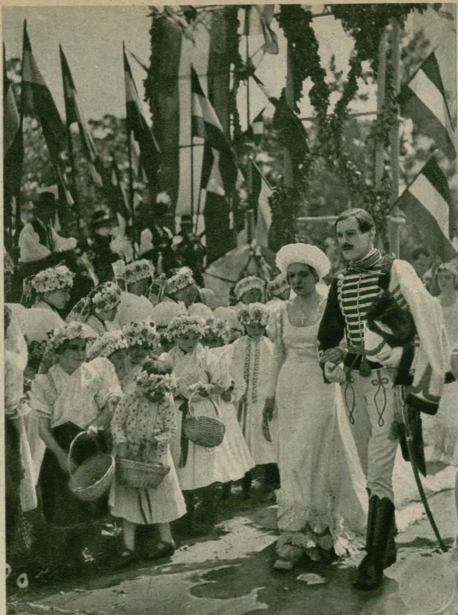
Típica, bella y emotiva escena de la gran película «Vuelan mis canciones», cuya estética, ritmo e idea son perfectísimos.

Entre las que mejor recordamos, aun a pesar de no ser de reciente proyec-