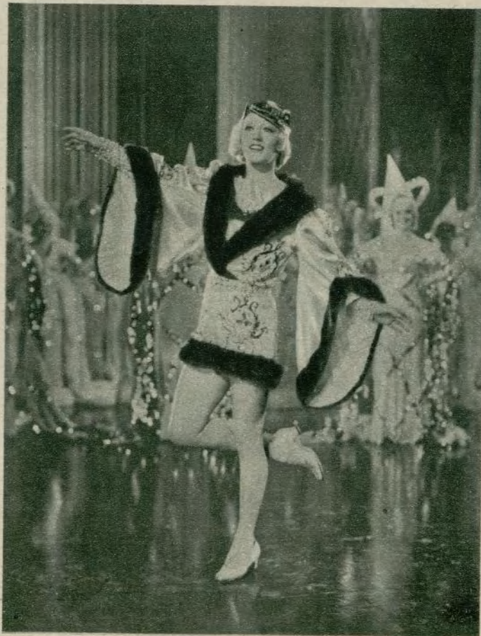
Marion Davies en el papel de príncipe encantado de su nueva película.