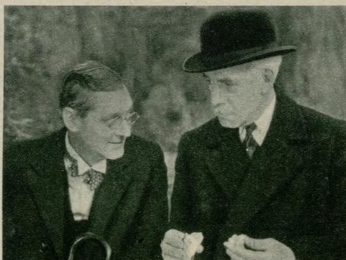
Lionel Barrymore y Lewis Stone en «Looking forward», de la M.-G.-M. (Exclusiva para FILMS SELECTOS.)