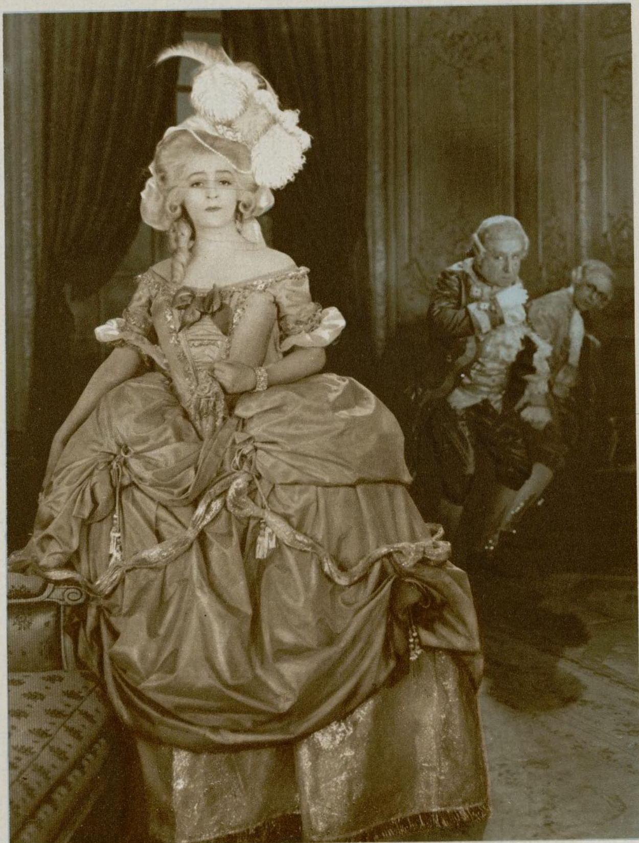
Escena de "El collar de la reina"