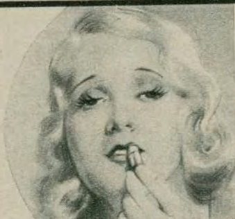
Anita Page, estrella de la Metro Goldwyn-Mayer, aplicándose el lápiz "MICHEL"