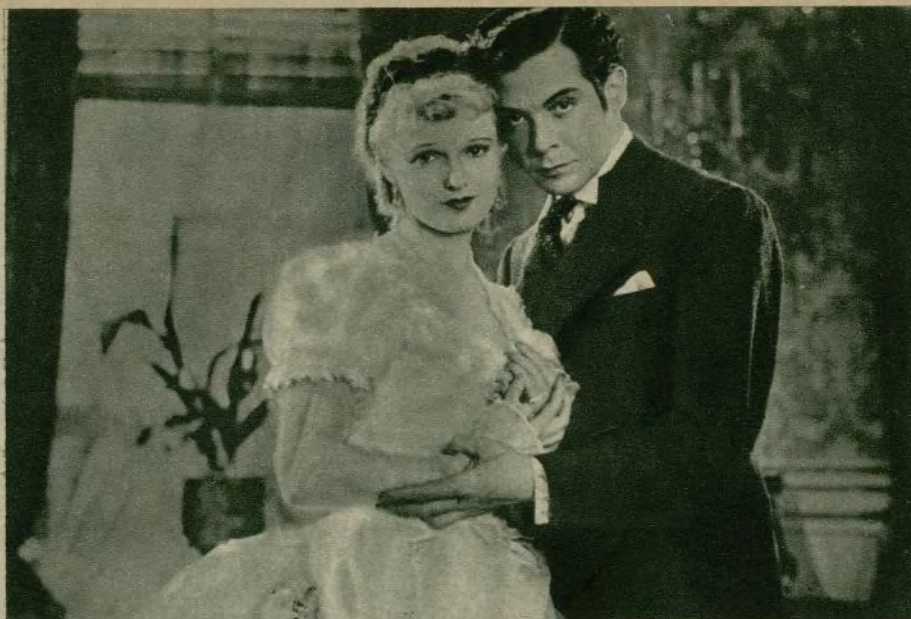
Anna Neagle, encantadora actriz inglesa, y Fernand Graavey, apuesto primer actor francés, protagonistas de la producción British and Dominions de la romántica historia de Noel Coward «Bitter Sweet», dirigida por Herbert Wilcox y distribuida por la United Artists.

Este concurso debe servir de exploración en busca de nuevos valores cinematográficos de jefes y técnicos para el film sonoro. La Oficina de las Semanas de los Festivales Internacionales indicará a los candidatos el lugar de los ejercicios.