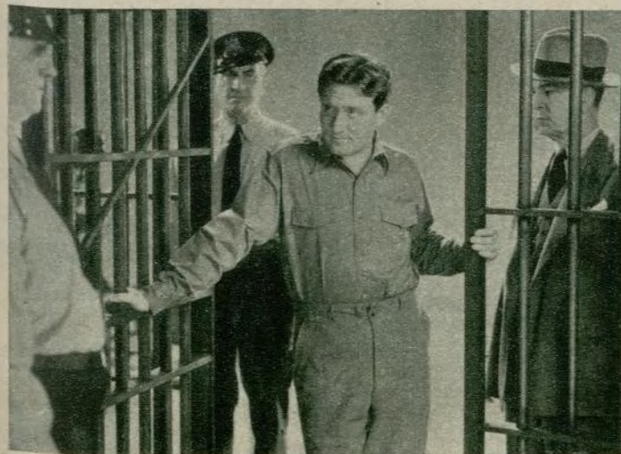
Una escena de «Veinte mil años en Shing-Shing», de la Warner Brothers. Spencer Tracy es el carácter principal de este drama.