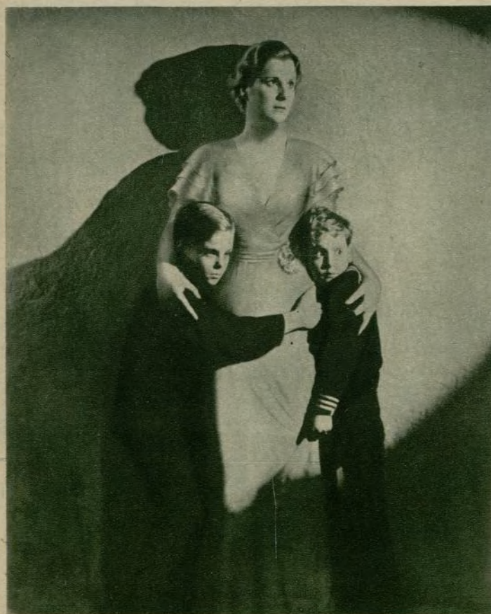
Una escena de «Cabalgata», el más perfecto film épico de 1933 llevado a la pantalla por la Fox Films. Los principales intérpretes son Diana Winyard y Clive Brook. (Foto exclusiva para FILMS SELECTOS.)