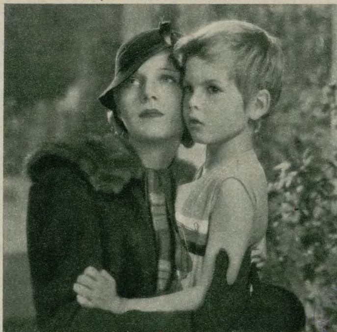
Una escena de «Gallant Lady», de la productora Juventy Century Co., distribuida por los Artistas Unidos.

L a Paramount, por su parte, nos impresionó favorablemente con su producción «El cantar de los cantares», con Marlene Dietrich; «Si yo tuviera un millón», deliciosa comedia de espléndida trama y con el mérito raro de haber sido producido de varios autores y directores. Para nosotros ésa es la mejor comedia producida durante todo el año de 1933. «Un ladrón en la alcoba», también una comedia dirigida por Lubitsch y con el excelente trio de artistas Herbert Marshall, Kay Francis y Mariam Hopkins. «El soltero inocente», con Chevalier y Baby Le Roy, esa criaturita de ocho meses que le robó descaradamente la película eclipsando al gran «gamin» de París. «La juventud manda», dirigida por Cecil B. de Mille; «Adiós a las armas», con Helen Hayes, y «Canción de cuna», adaptada al cinematógrafo de la obra de don Gregorio Martínez Sierra y que presentó en la pantalla americana a la excelente actriz Dorothea