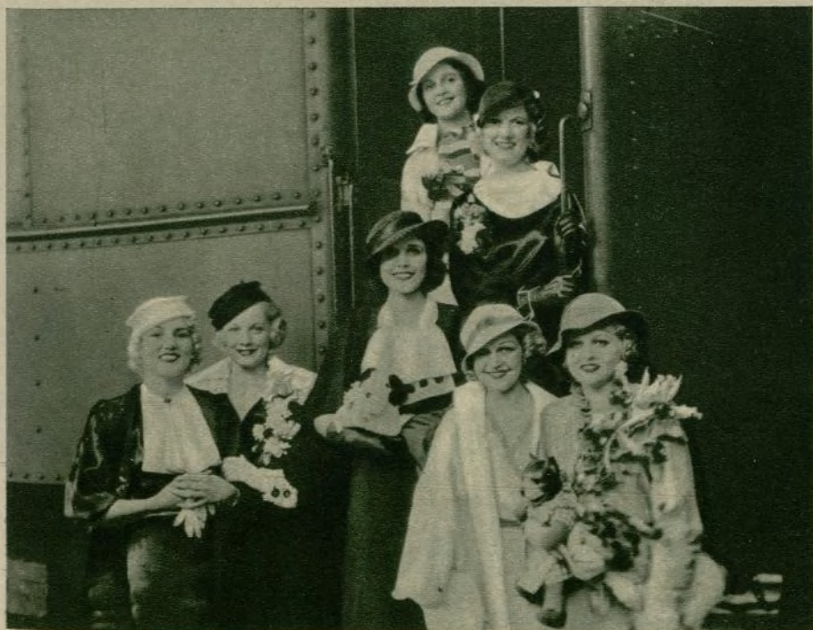
Siete de las cien Goldwyn girls al salir de Nueva York para Hollywood para figurar en la nueva producción de Samuel Goldwyn «Escándalos romanos», film del programa United Artists que protagonizará Eddie Cantor.