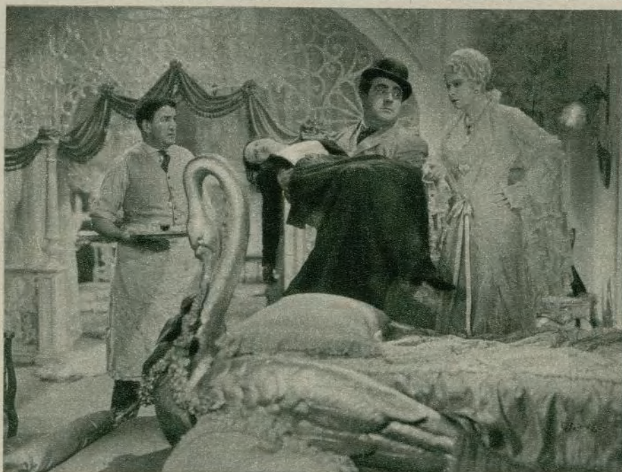
Mae West en cuatro momentos de la película «Lady Lou»

poco tiempo dominó la psicología de las gentes y más especialmente de los públicos. Este estudio intensivo logró convertirla en poco tiempo en la niña mimada de todos los públicos y de todos los empresarios.