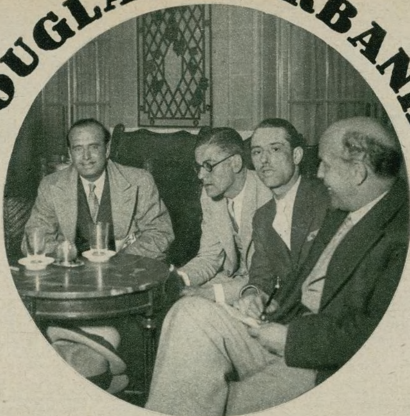
Nuestro director hablando, en el Hotel Ritz, con Douglas Fairbanks.