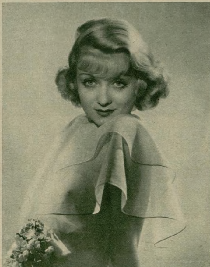
Constance Bennett en «Molino rojo», de la casa productora Juventy Century y distribuida por United Artists.