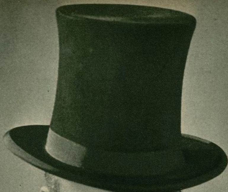
Monolo Vico en el papel de Don Matías, en la peli- cula «Doña Francisquita»