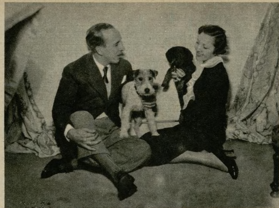
Charles Butterworth, actor de la Metro, fotografiado en compañía de su esposa y de sus dos perros favoritos.

Blanche Montel será compañera de Victor Boucher en «La Banque Nemo», que dirigirá Jean Choux.