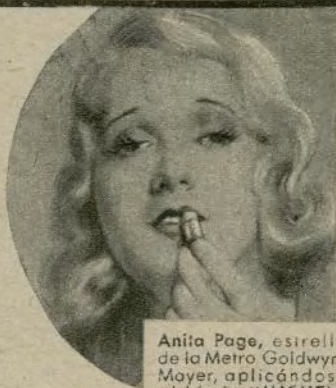
Anita Page, estrella de la Metro Goldwyn-Mayer, aplicándose el lápiz "MICHEL"

De venta en to- dos los quioscos 50 céntimos