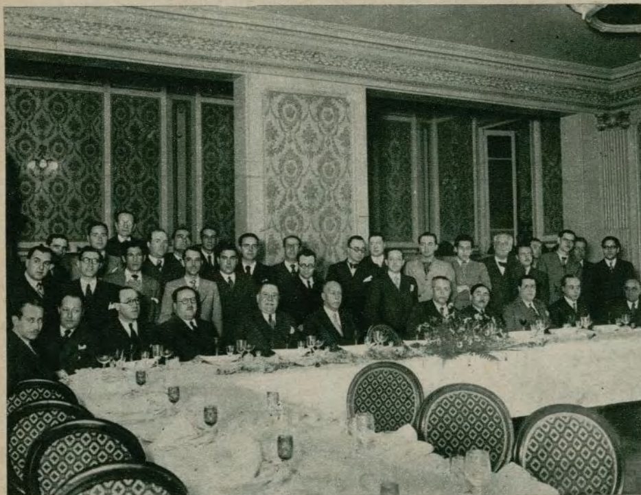
Un grupo de asistentes a este acto de fraternidad y exaltamiento cinematográfico que se celebró el día 20 del corriente en el salón de fiestas del Hotel Continental.

El día 17 de este mes fue fiesta grande para la Hispano Foxfilm S. A. E., pues con lucidos y variados actos celebró el décimo aniversario de su creación, a los que acudieron periodistas, alquila-