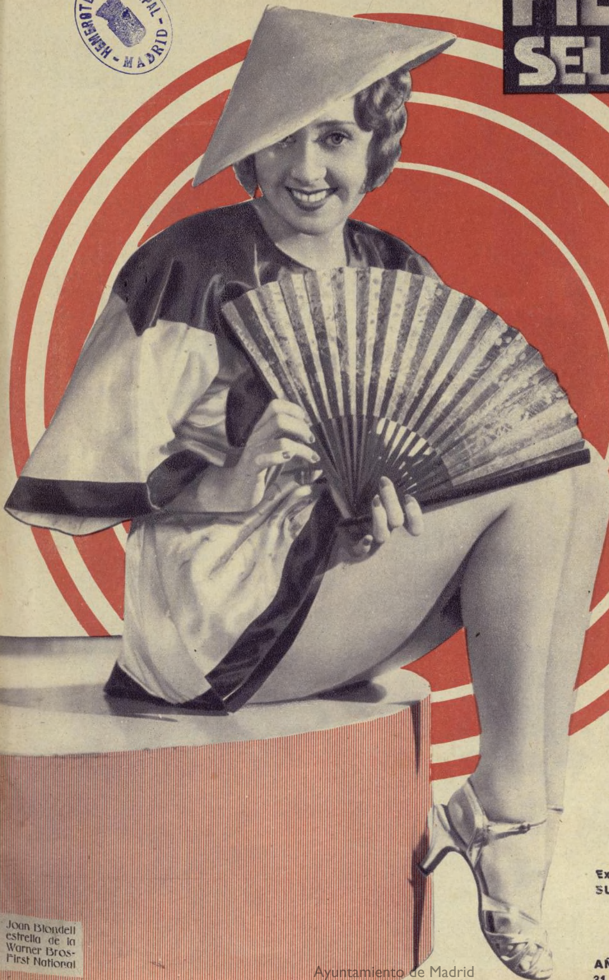
Joan Blondell estrella de la Warner Bros- First National