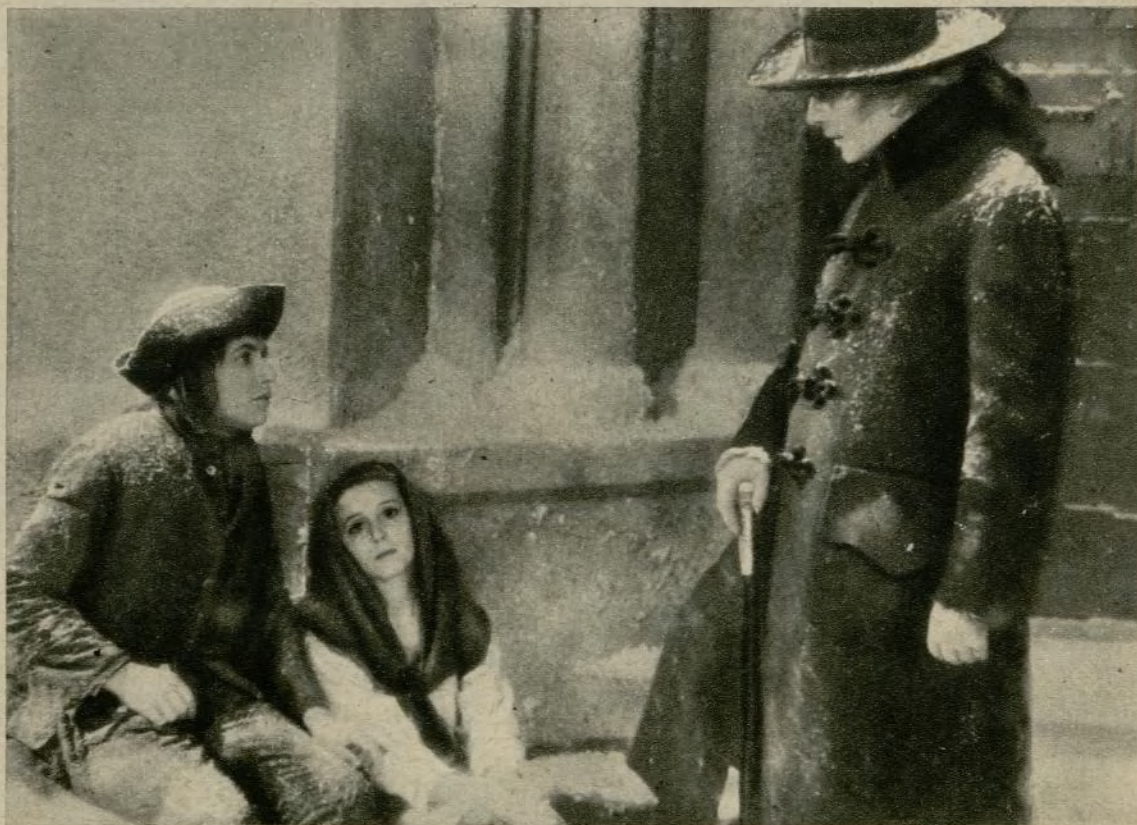
En 1933 se ha estrenado en España otra nueva versión de «Las dos huérfanas», realizada en Francia por Maurice Tourner, a la que pertenece esta escena.