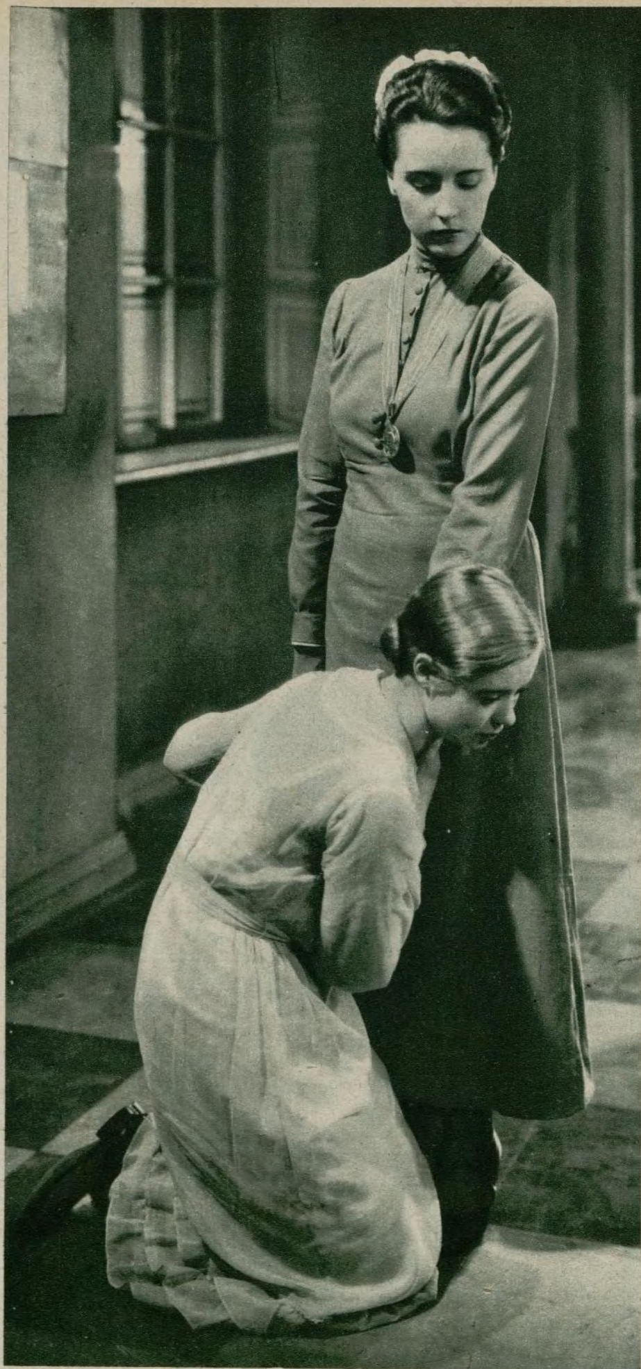
«Muchachas de uniforme» la película más vigorosa y profunda de la anterior temporada se debe a una mujer.

Y luego, sin el romanticismo esencial de las tres cuartas partes del público, esto es, del público femenino del mundo; sin su decidido favor por la nueva forma de diversión; sin su entusiasmo por farsas y asuntos, máscaras y rostros, ¿hubiera nunca llegado el cine a ser la fuente de riqueza formidable que es actualmente, ni hubiera tenido, por lo tanto, estímulo, acicate, para intensificar y elevar la producción?