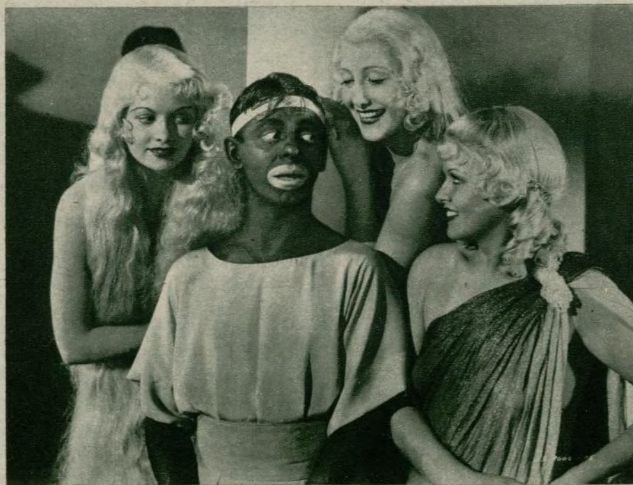
Eddie Cantor y tres de las sandungueras Goldwyn Girls que figuran en el último jocoso gran éxito de Samuel Goldwyn, «Escándalos romanos».

El gobernador de Nankin ha declarado que las películas rodadas por los extranjeros en China no deben ofender los sentimientos patrióticos y que necesitan indispensablemente estar aprobadas por la censura del país.