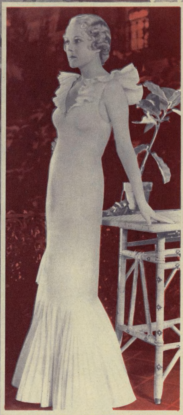
Elegante vestido de noche que luce la bella artista Sally Eilers en la película Warner Bros-First Natio- nal «Aeropuerto central»