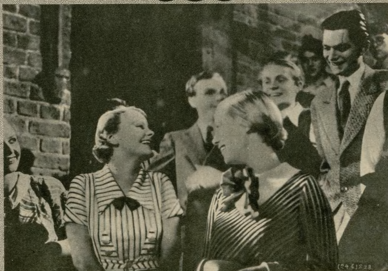
Dos escenas de la película de Exclusivas Cíneas «La segunda juventud»