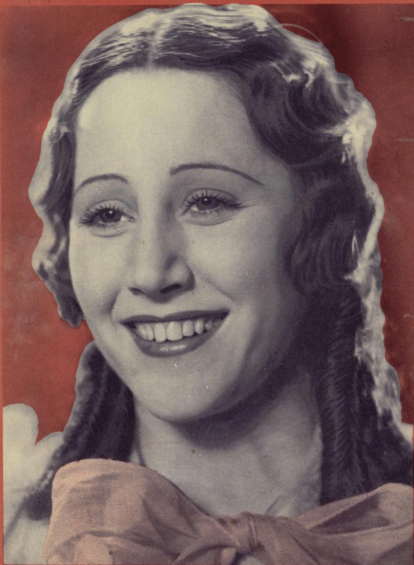
Ayuntamiento de Madrid Raquel Rodrigo protagonista de la película española «Doña Francisquita»