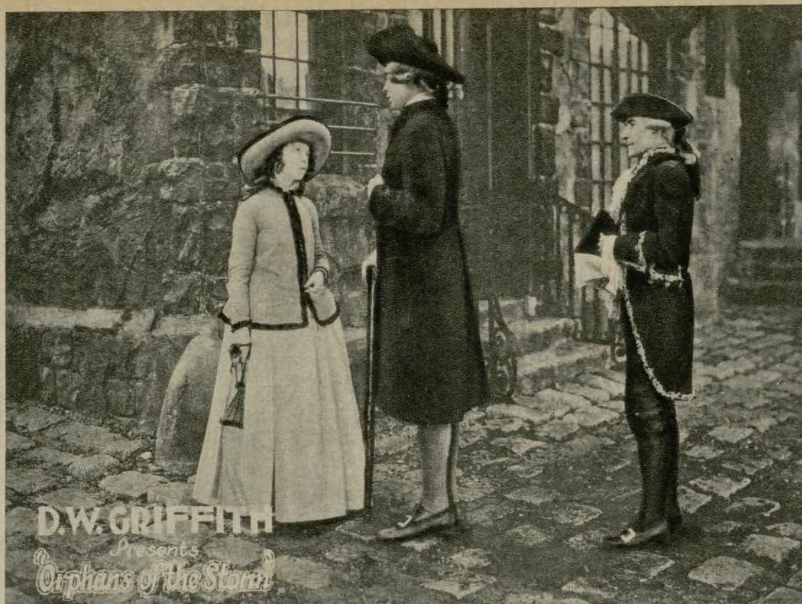
En 1923 D.W. Griffith realizó en Hollywood una versión de «Las dos huérfanas» con el título de «Huérfanas de la tempestad». Las hermanas Gish fueron las protagonistas.

blanca», y repite su drama de amor imposible. Al astracán: nuevos payasos, en la vieja pista rectangular de la pantalla, se arrojan otra vez tartas de harina, mientras se persiguen sin descanso... Vuelta, en fin, al cine de ayer: a sus tópicos, a sus absurdos, a sus ingenuidades, y... ¿a sus éxitos? No: los éxitos quedan inamovibles, ocupando el lugar que les marcó la historia. Los éxitos de ayer se desmoronan en cuanto pierden su categoría de recuerdos.