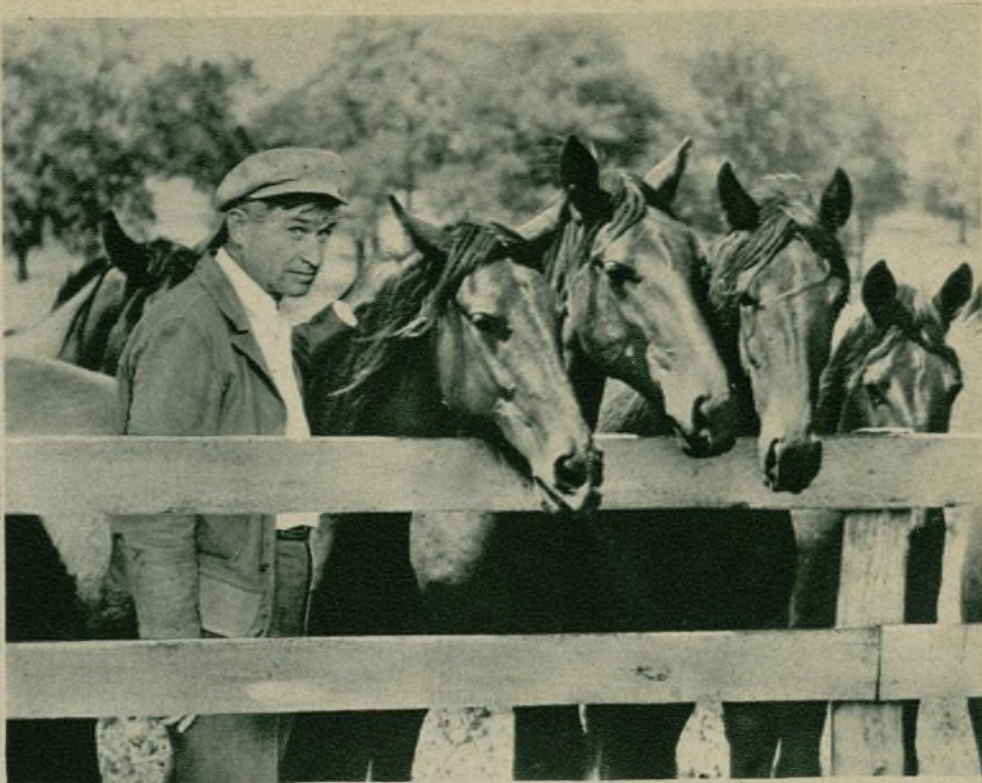
«In Old Kentucky», otra de las películas del gran actor desaparecido que aún no han llegado a la pantalla y que marcan el final de su carrera.

IMPLACABLE, la mano sarmentosa de la muerte tiende de nuevo su guadaña para segar otra vida famosa en los prósperos jardines de Cinelandia, enlutando el corazón de Norteamérica y los demás pueblos de la tierra. De nuevo la tragedia, sombría, fatídica, misteriosa, asoma su rostro pálido y enjuto, desbaratando trágicamente otro hogar.