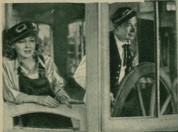
Will Rogers y Ann Shirley en el film de la Fox «Steamboat Round the Bend», que no ha sido aún presentada al público.