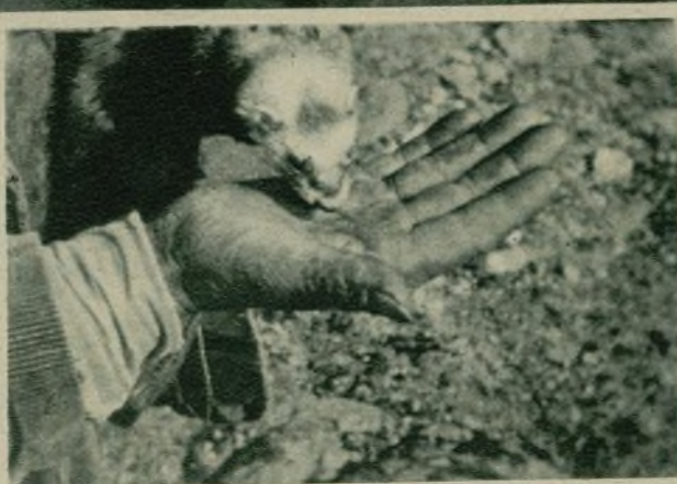
Del film «La caza del conejo con hurón», documental del cineasta madrileño Daniel Gorro, asiduo concursante del C. E. C.

mos decir que uno de los films que llamó más la atención y subrayamos precisamente éste porque aquí no tuvo la acogida debida, fué «L'home que jo he mort», realizado por J. M. Ponseti, J. Arrugat y J. Serra. En general, las demás producciones, exceptuando «Festa Major», hemos leído de ellas que son obras excelentes de forma, pero sin intención; buena factura, exenta de novedad.