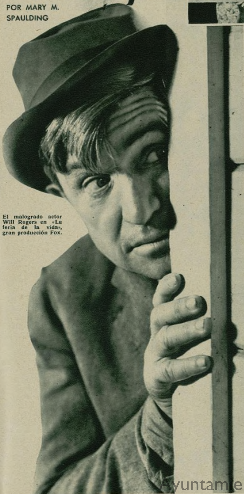
El malogrado actor Will Rogers en «La feria de la vida», gran producción Fox.