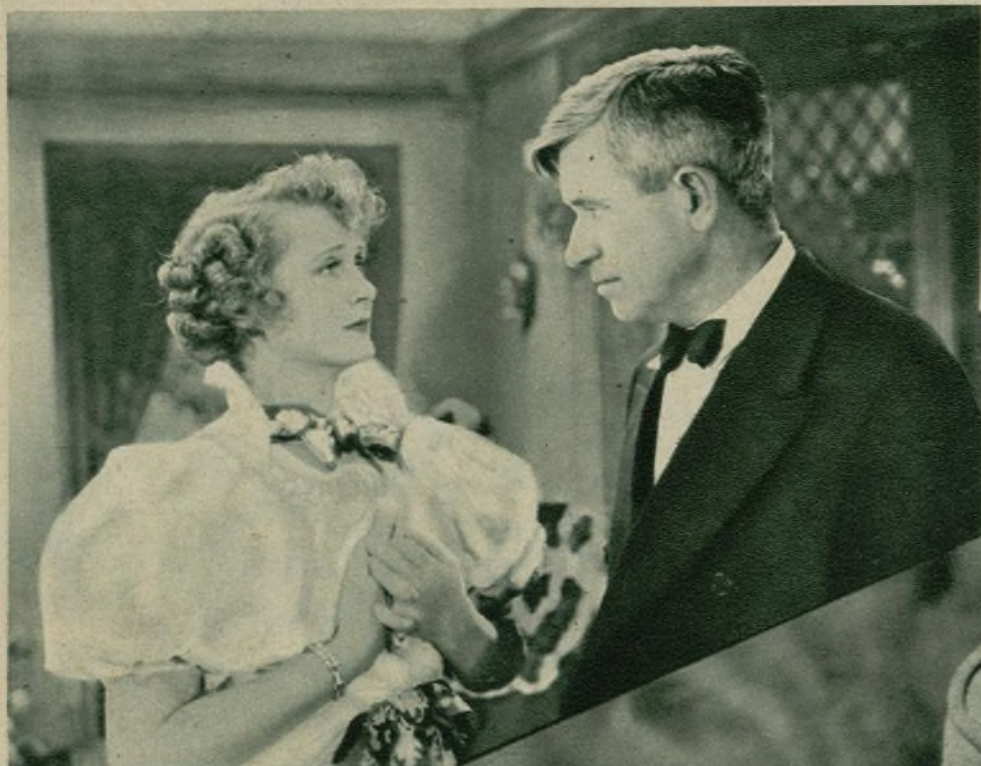
Will Rogers y Billie Burke en una escena de la espléndida película «Donting Thomas», penúltima aparición del actor en la pantalla.

ofreció sus servicios en diversas funciones de caridad, a fin de que el dinero colectado fuera a aliviar la indigencia.