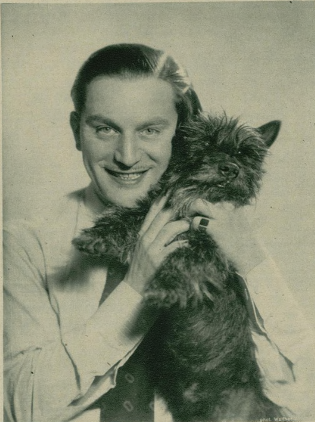
Adolf Wohlbrück es el protagonista de tres nuevas producciones de Tobis-Cinema: «Yo era Jack Mortimer», «El estudiante de Praga» y «El conde del Zar».