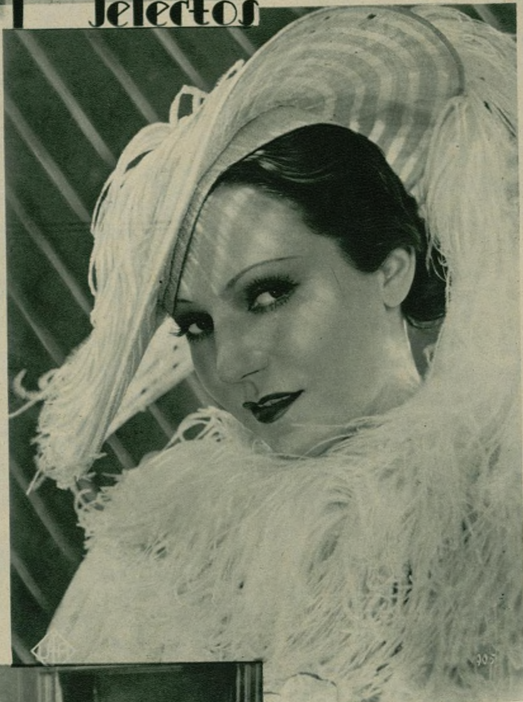
Ultimo retrato de la estrella de la Ufa Kate de Nagy