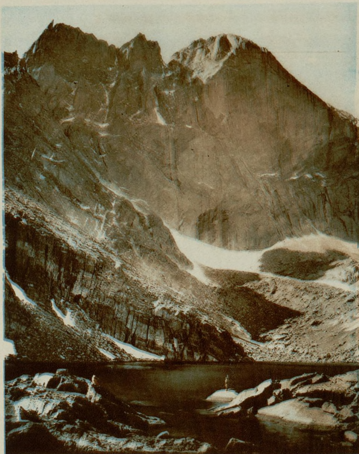
Vista de un lago en las Montañas Rocosas