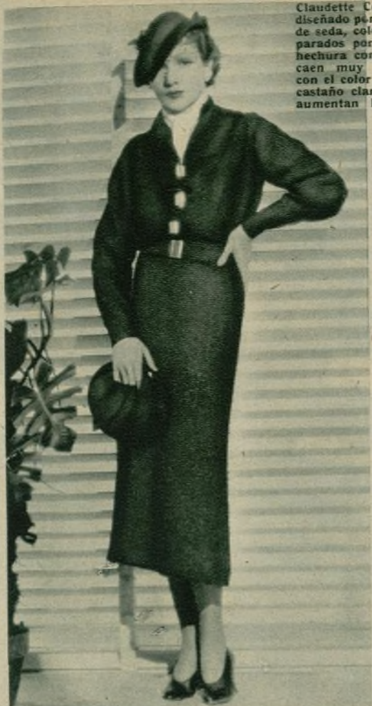
Claudette Colbert luciendo un traje diseñado por ella misma. La tela es de seda, color pardo, con vivos separados por hilos de oro. Tanto la hechura como el color del traje le caen muy bien, pues armonizan con el color de sus ojos y de su pelo castaño claro. Las barritas doradas aumentan la belleza del vestido.