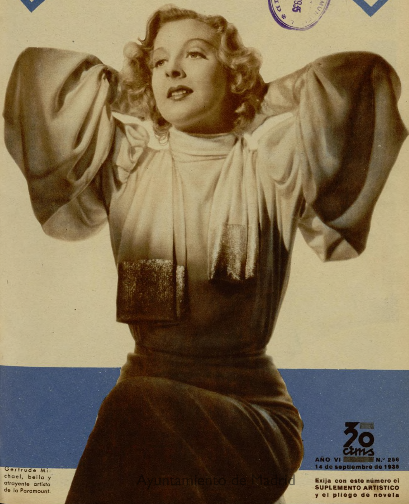
Gertrude Michael, bella y atrayente artista de la Paramount.