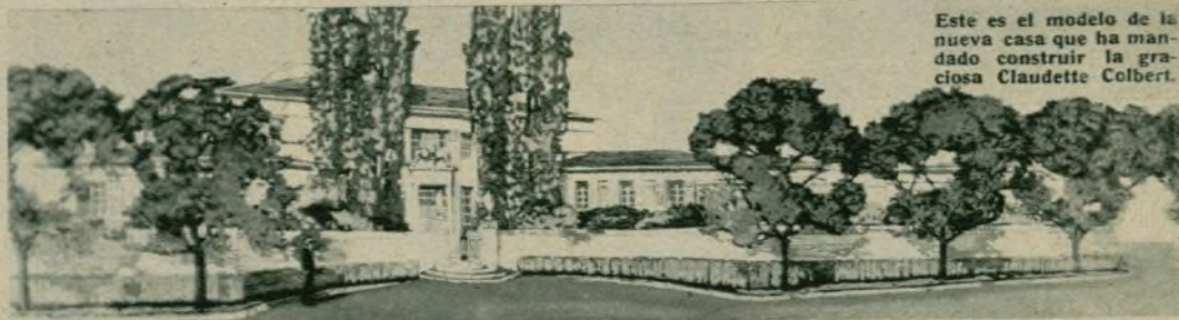
Este es el modelo de la nueva casa que ha mandado construir la graciosa Claudette Colbert.