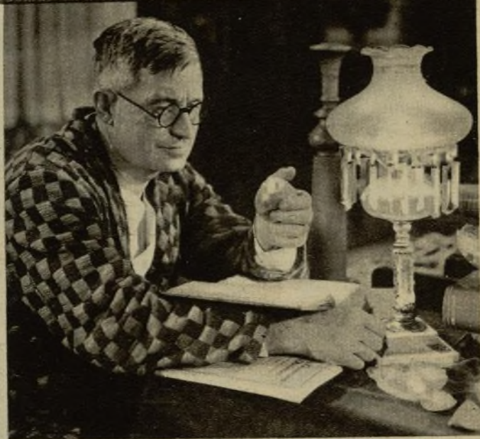
Will Rogers en su espléndida caracterización de «Dr. Bull», otro éxito de taquilla en Norteamérica.

hasta el año 1929 en que hizo su debut en los films parlantes, con la película «They had to see Paris», para la casa Fox. Sus triunfos se sucedieron en rápida sucesión. «Só this is London», «Lightnin», «A Connecticut yankee», «Young as you fell», «Business and pleasure», «Ambassador Bill», «Down to earth», «To bussy to work», «State fair» (premiada por la Academia), «Dr. Bull», «Mr. Skitch», «David Harum» (en la cual Will Rogers interpretó de manera magistral a un tipo famoso de la historia norteamericana), «Merry Andrew», «Judge priest», «The country chairman», «Life begins at 40», fueron todas una serie interminable de éxitos artísticos y de taquilla.