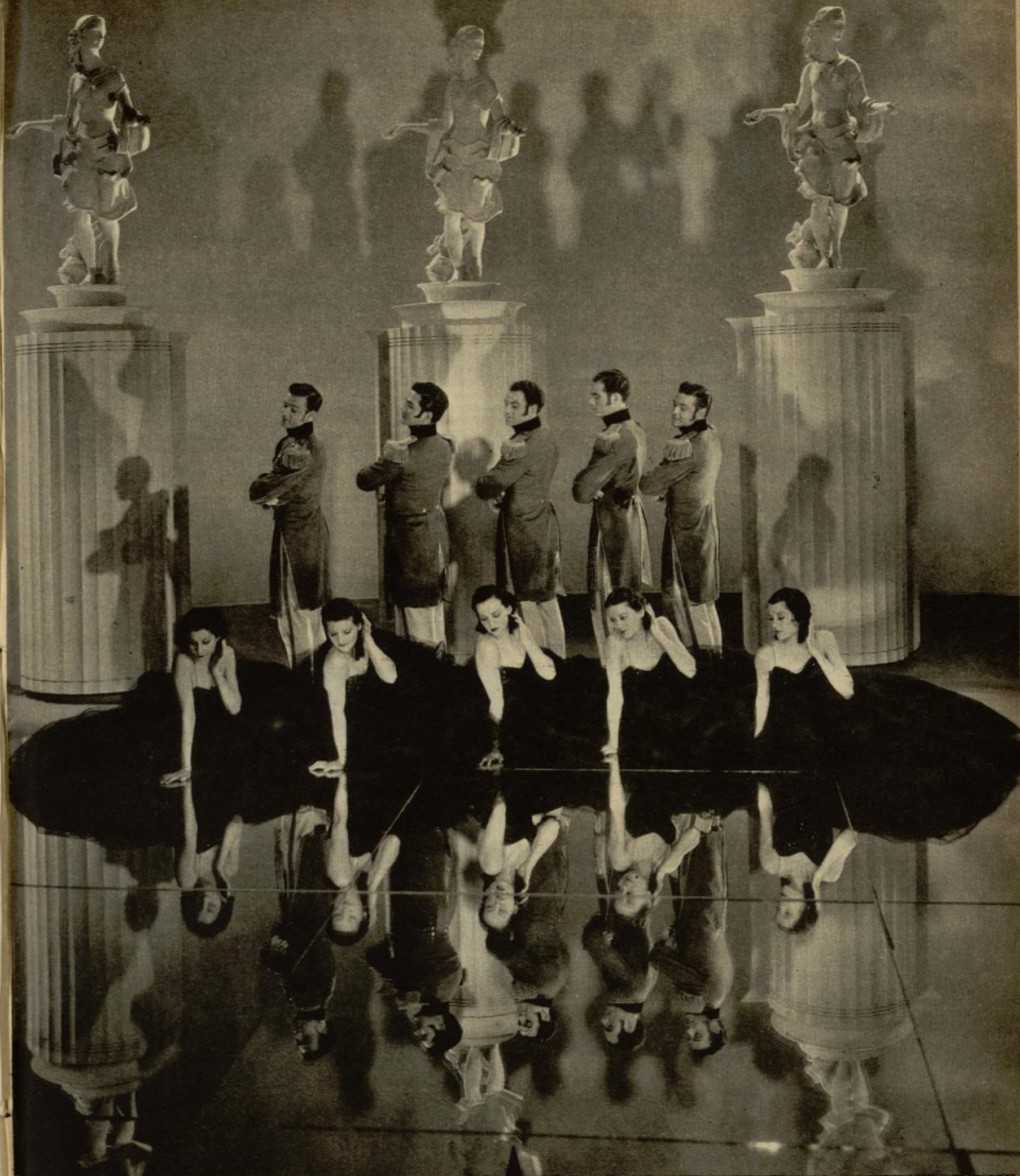
Espectacular escena del film Paramount «Recordemos aquellas horas».