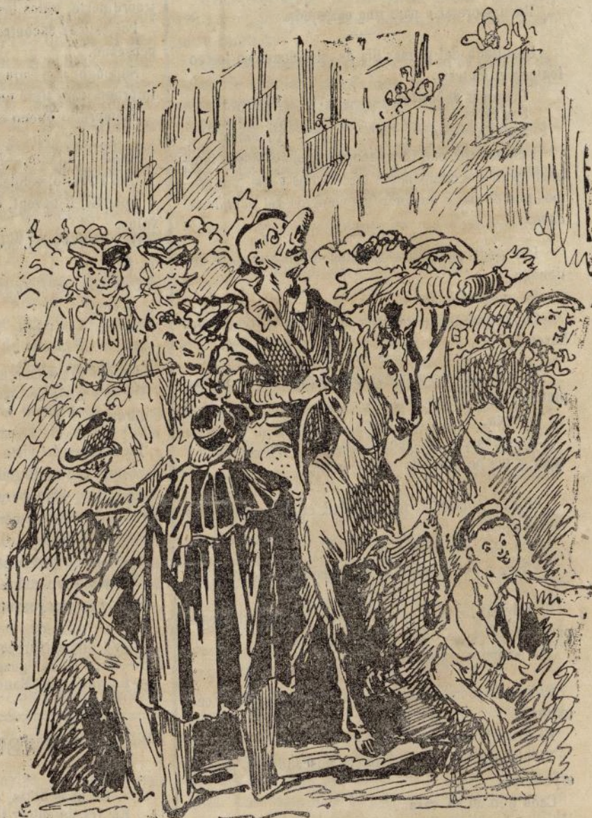
Llega el Carnaval.