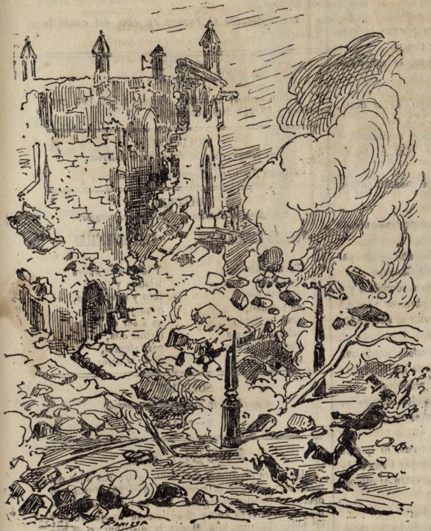
Se derrumba un ex-palacio.