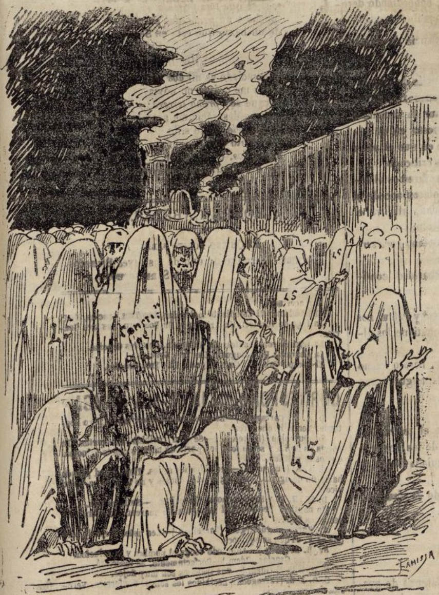
A reunion van los lázaros.