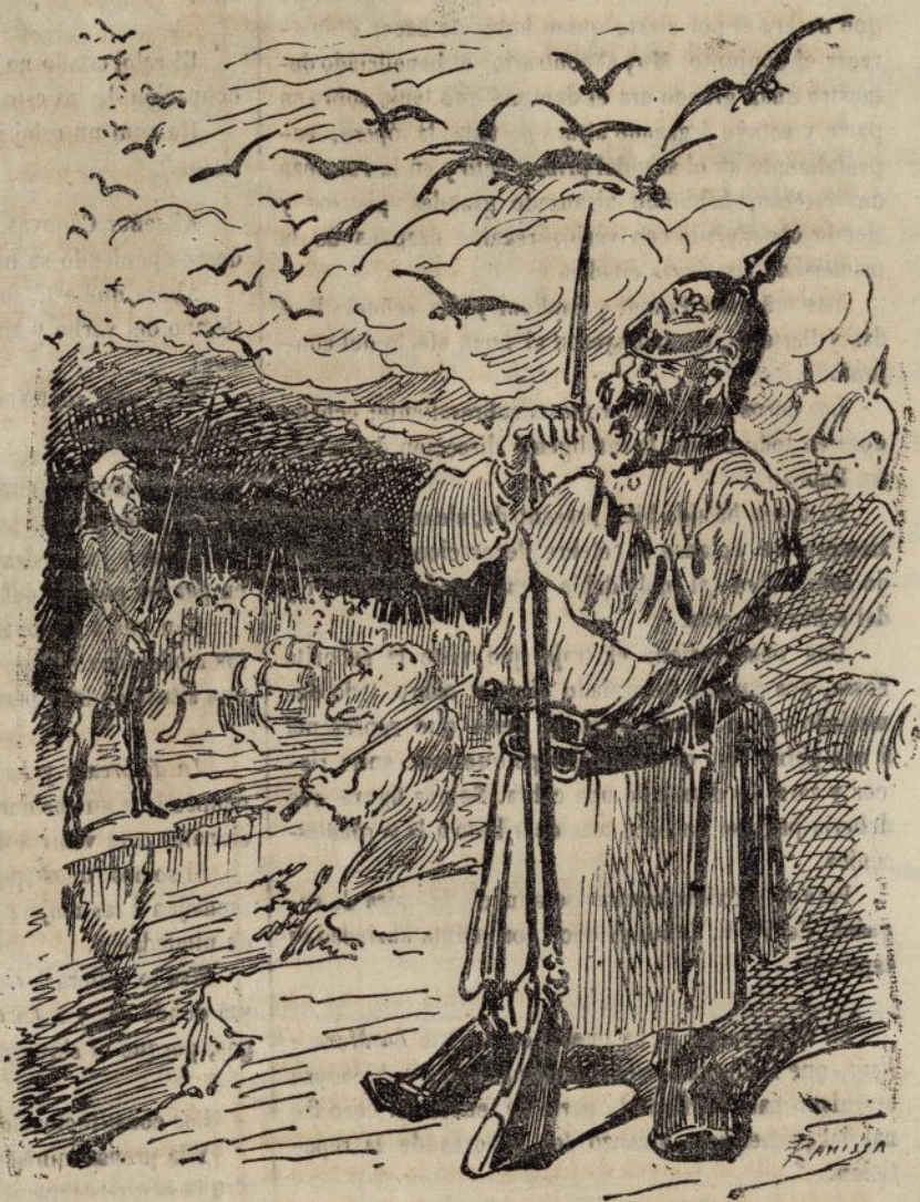
Se empieza una guerra.