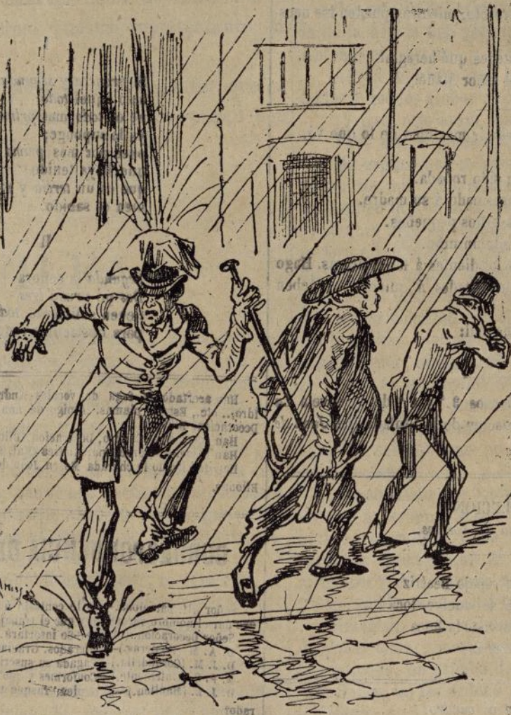
La de mojarse... cuando llueve.