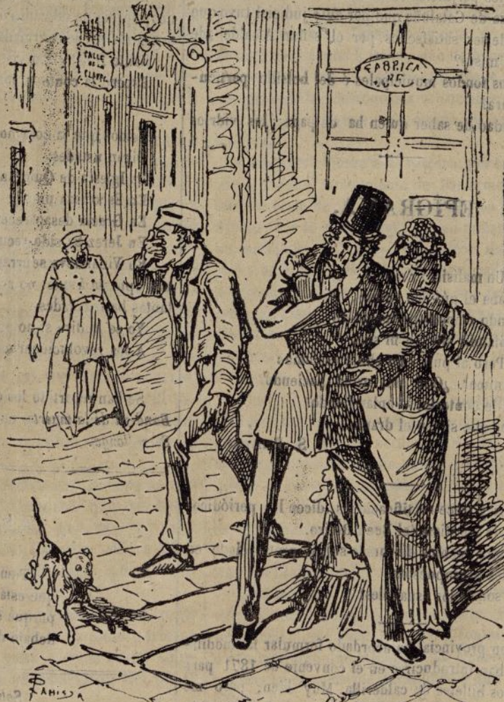
La de asfixiarse á todas horas.