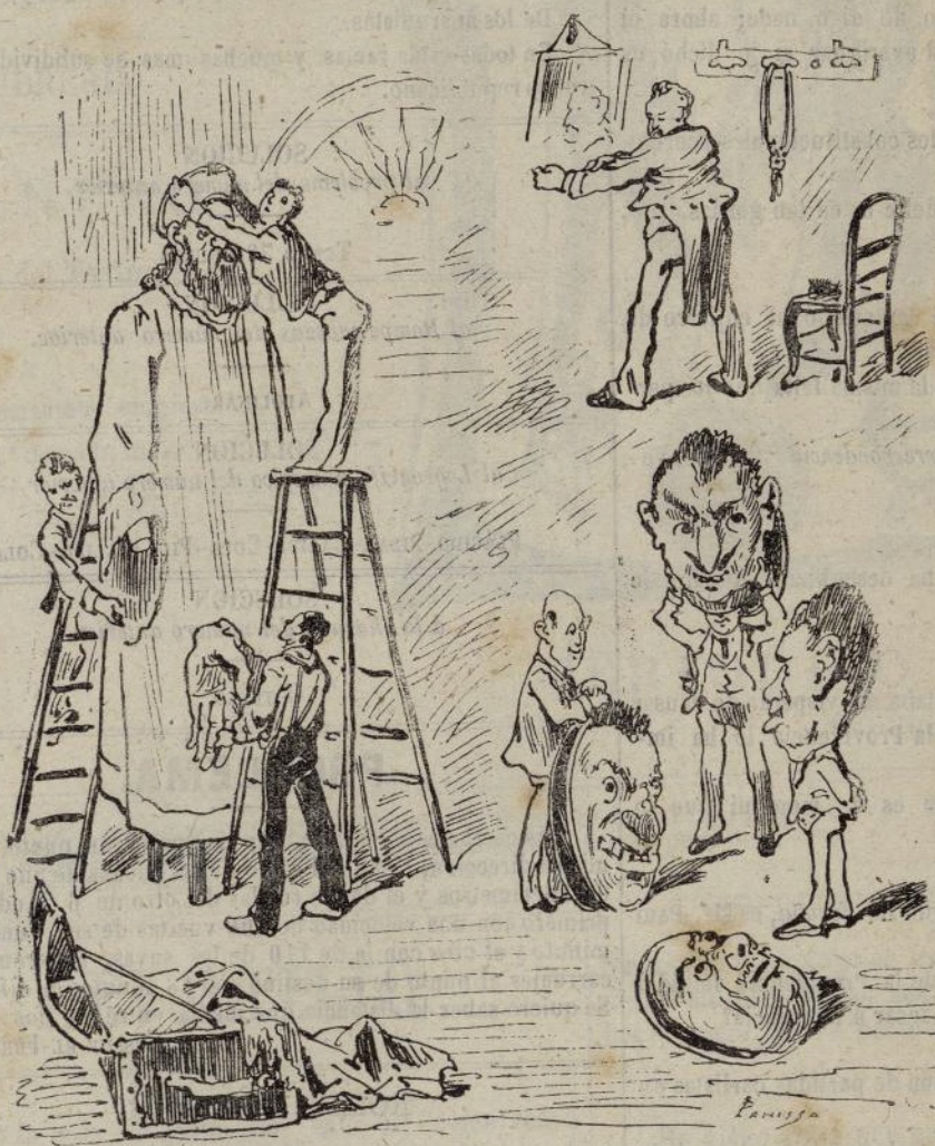
Los héroes de todos los días.