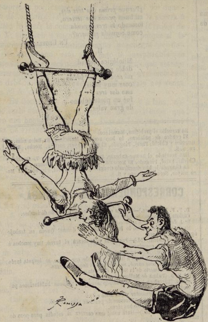
TEATRO DEL CIRCO.

—Si no trabajan ustedes no es por falta de deseo sino de local.