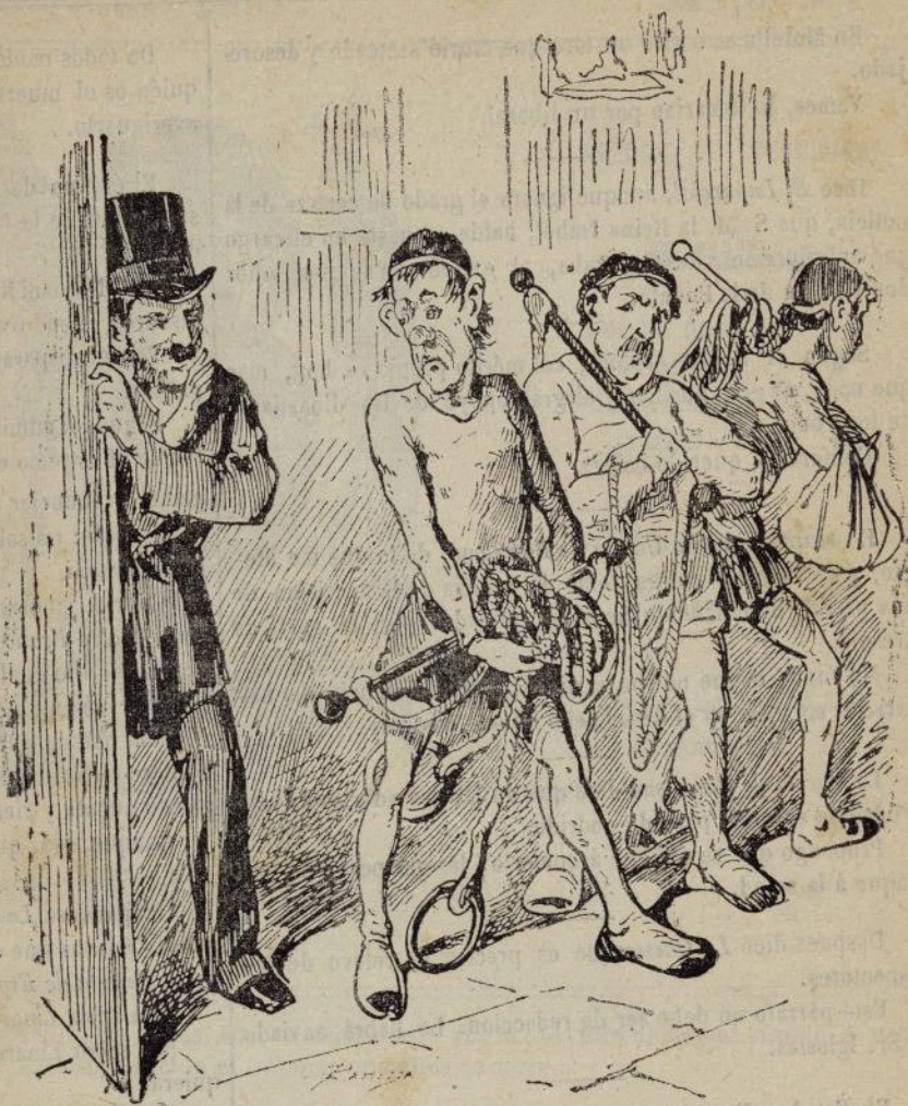
GRAN TEATRO DEL LICEO.

—Si no trabajan ustedes no es por falta de deseo sino de local.