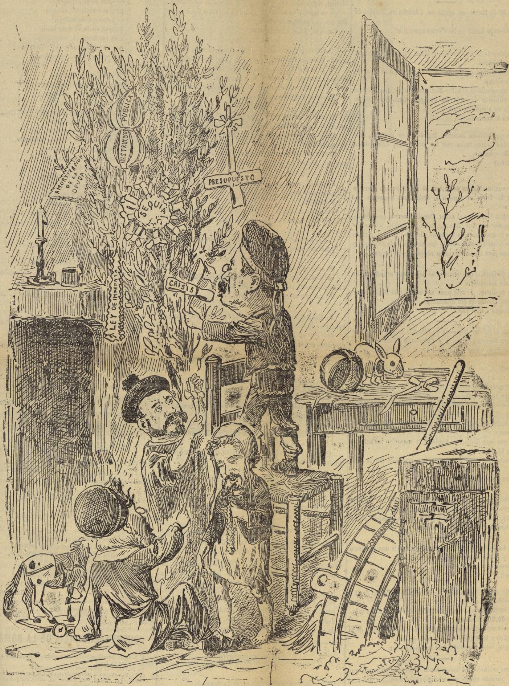
EL RAMO DE LA SITUACION.