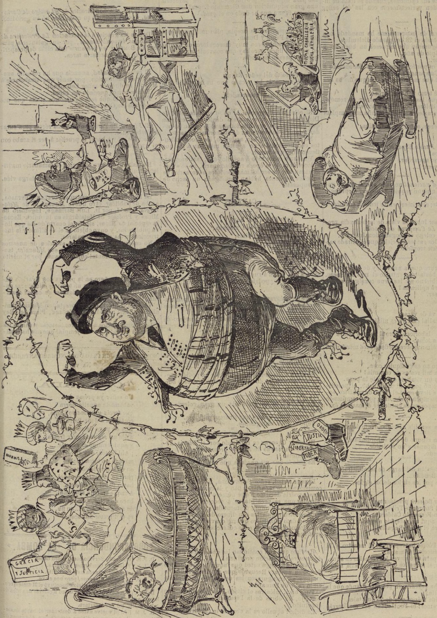
Los reyes magos de Ogaño.