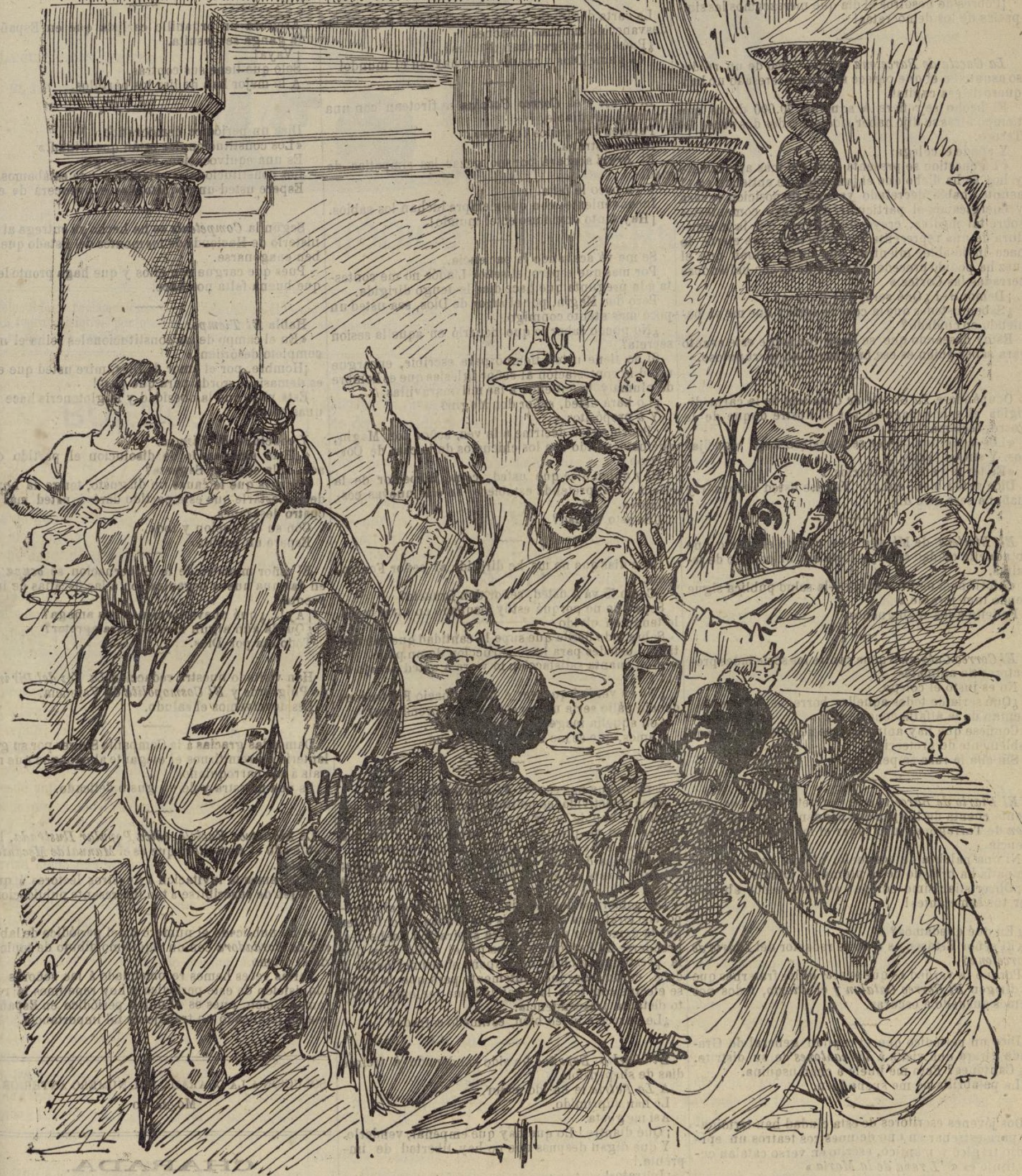
EL FESTIN DE BALTASAR.