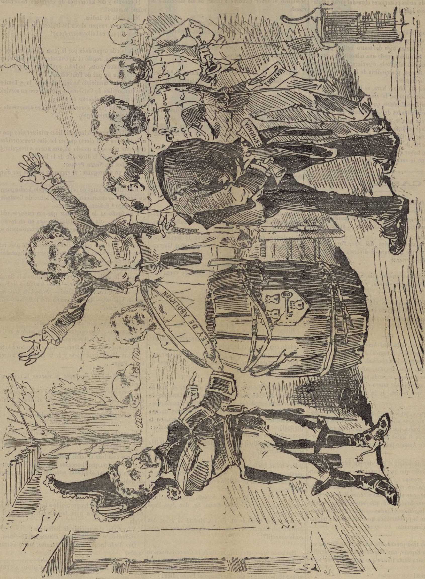
¡¡¡Alto!!! Diez compases de espera.