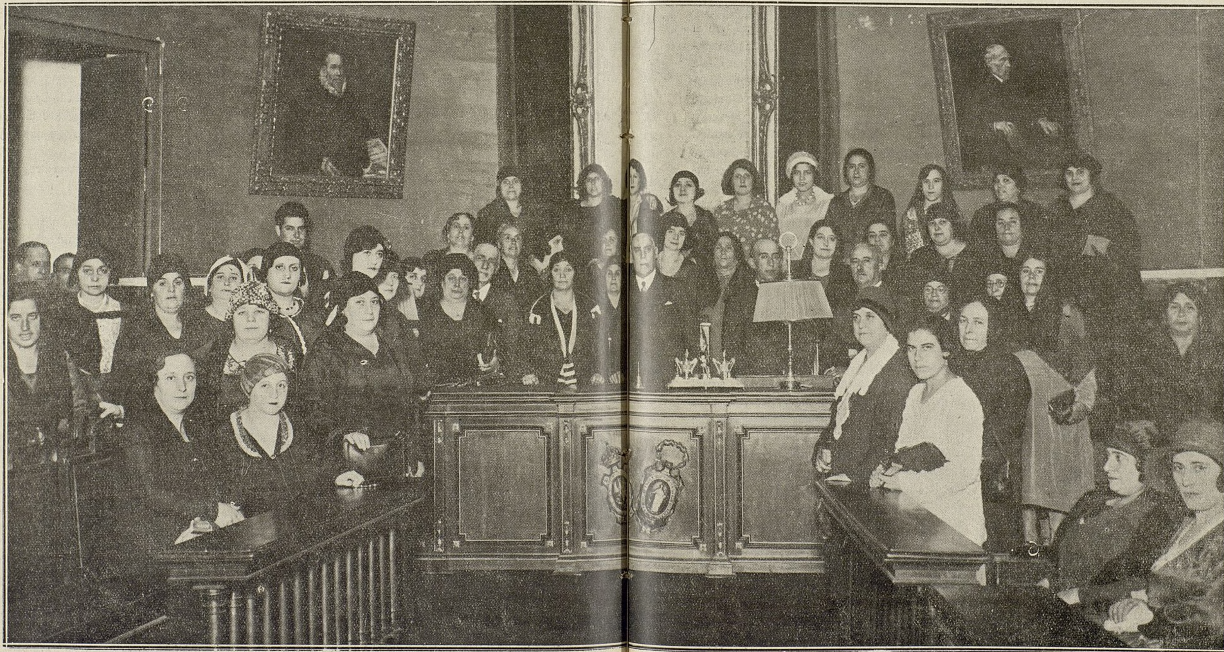
Sesión de apertura celebrada el día 1.º de octubre de 1930