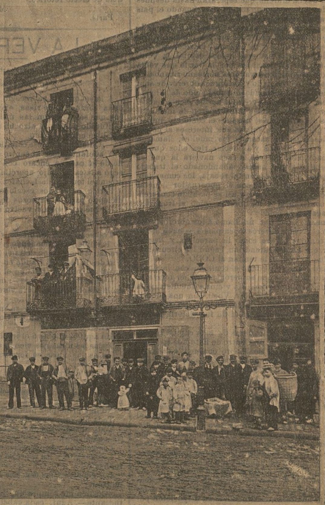
EL PROGRESO, círculo de los obreros de Manlleu.