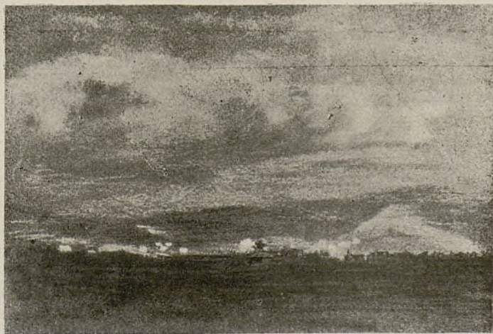
Eclipse de Sol. —Vista tomada en término de Villanueva y Geltrú, en el momento de mayor intensidad.

Bien merecen un recuerdo esos hombres que estudian y trabajan, sin que les atraigan los triunfos de momento, aquí donde tantos bullen y luchan y se afanan por aparecer, soberbios, dominadores de la multitud.