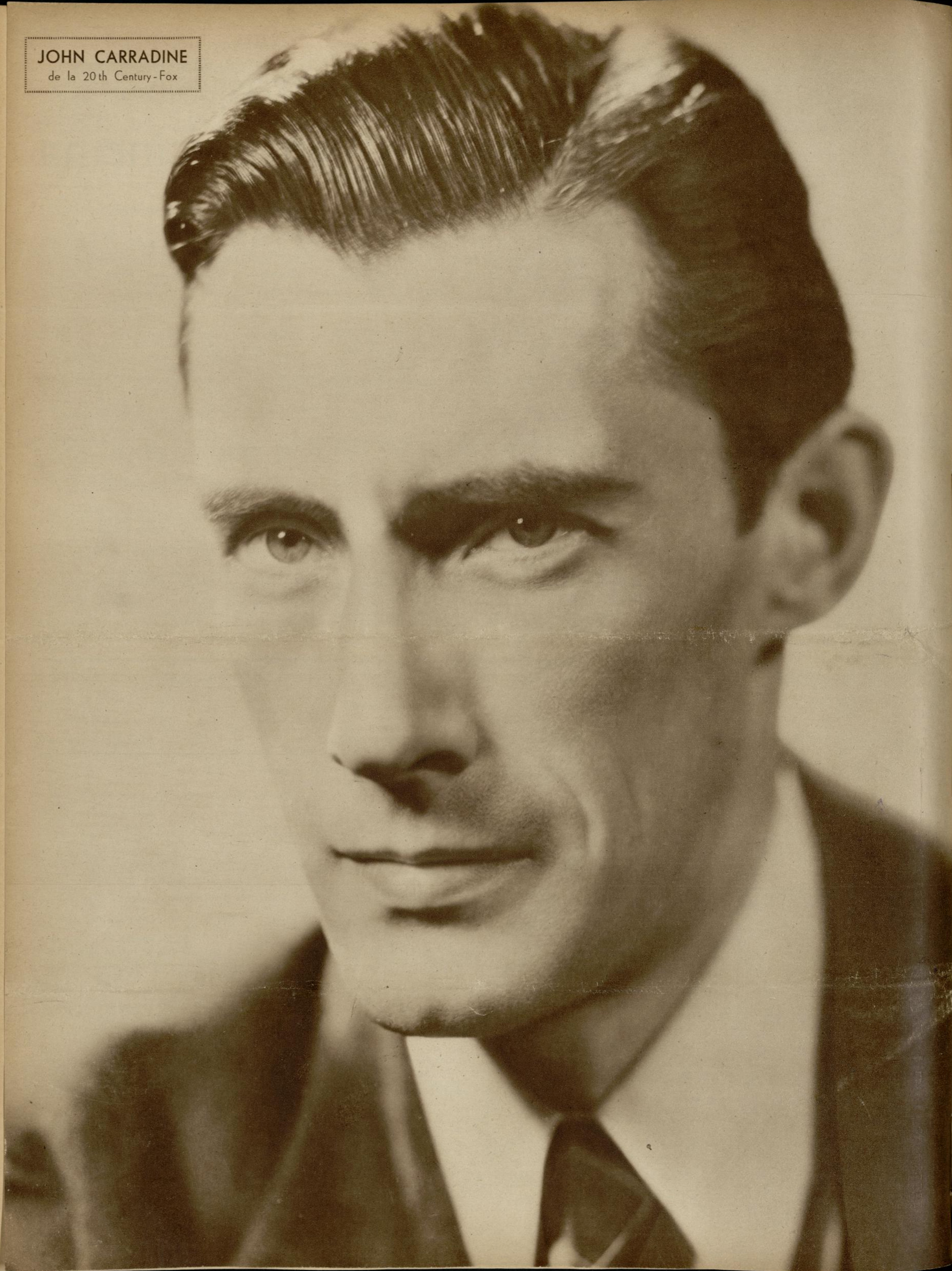
JOHN CARRADINE de la 20th Century-Fox