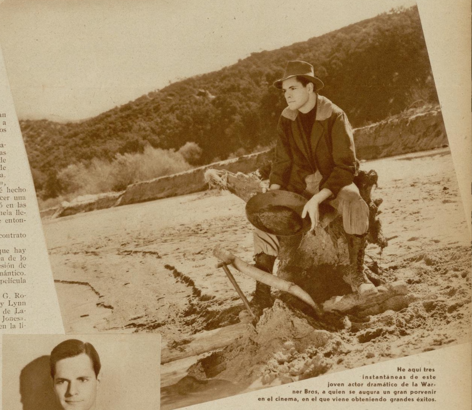
He aquí tres instantáneas de este joven actor dramático de la Warner Bros, a quien se augura un gran porvenir en el cinema, en el que viene obteniendo grandes éxitos.