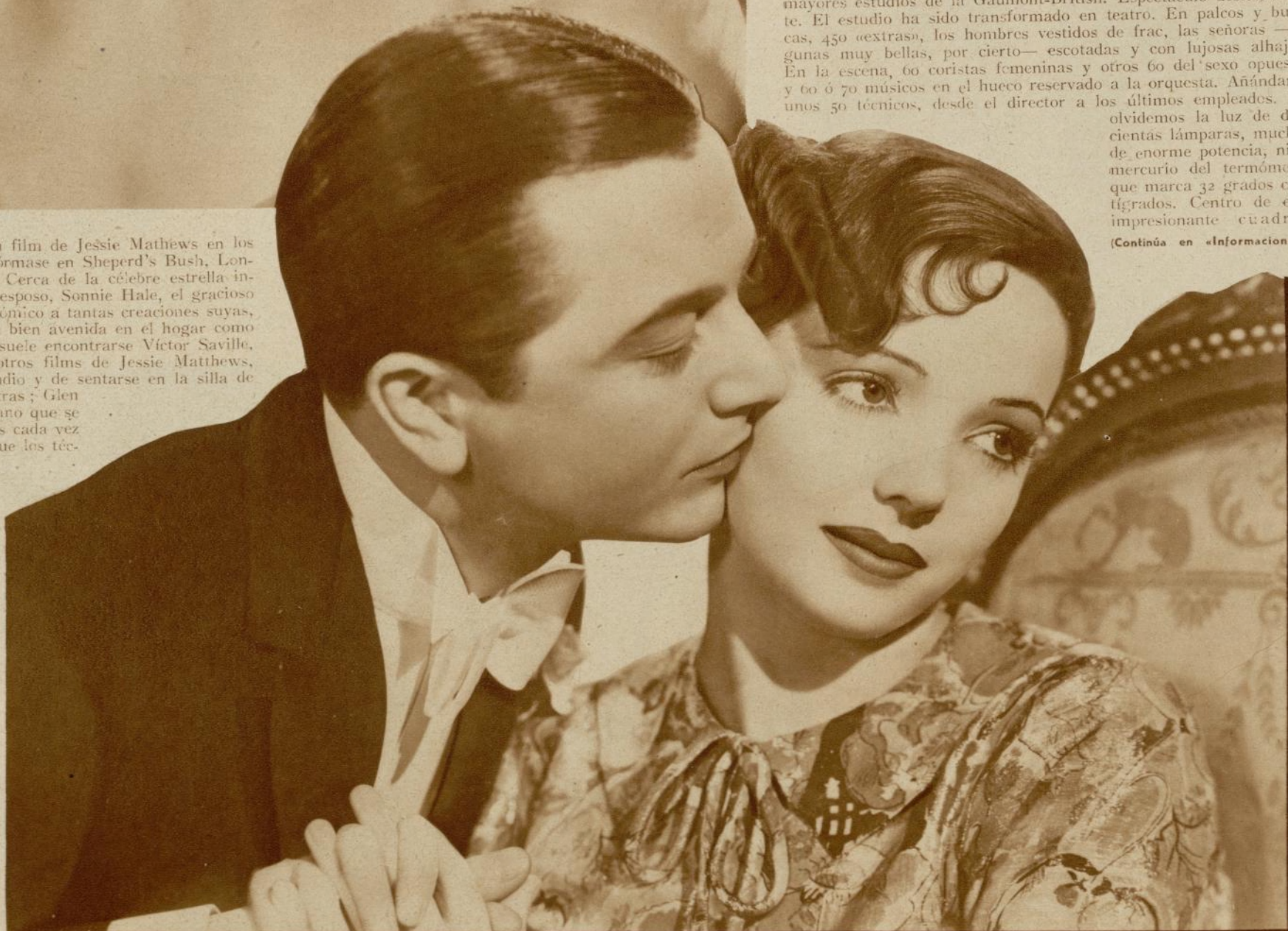
Robert Young y Jessie Matthews en el film de Gaumont British «ES EL AMOR».