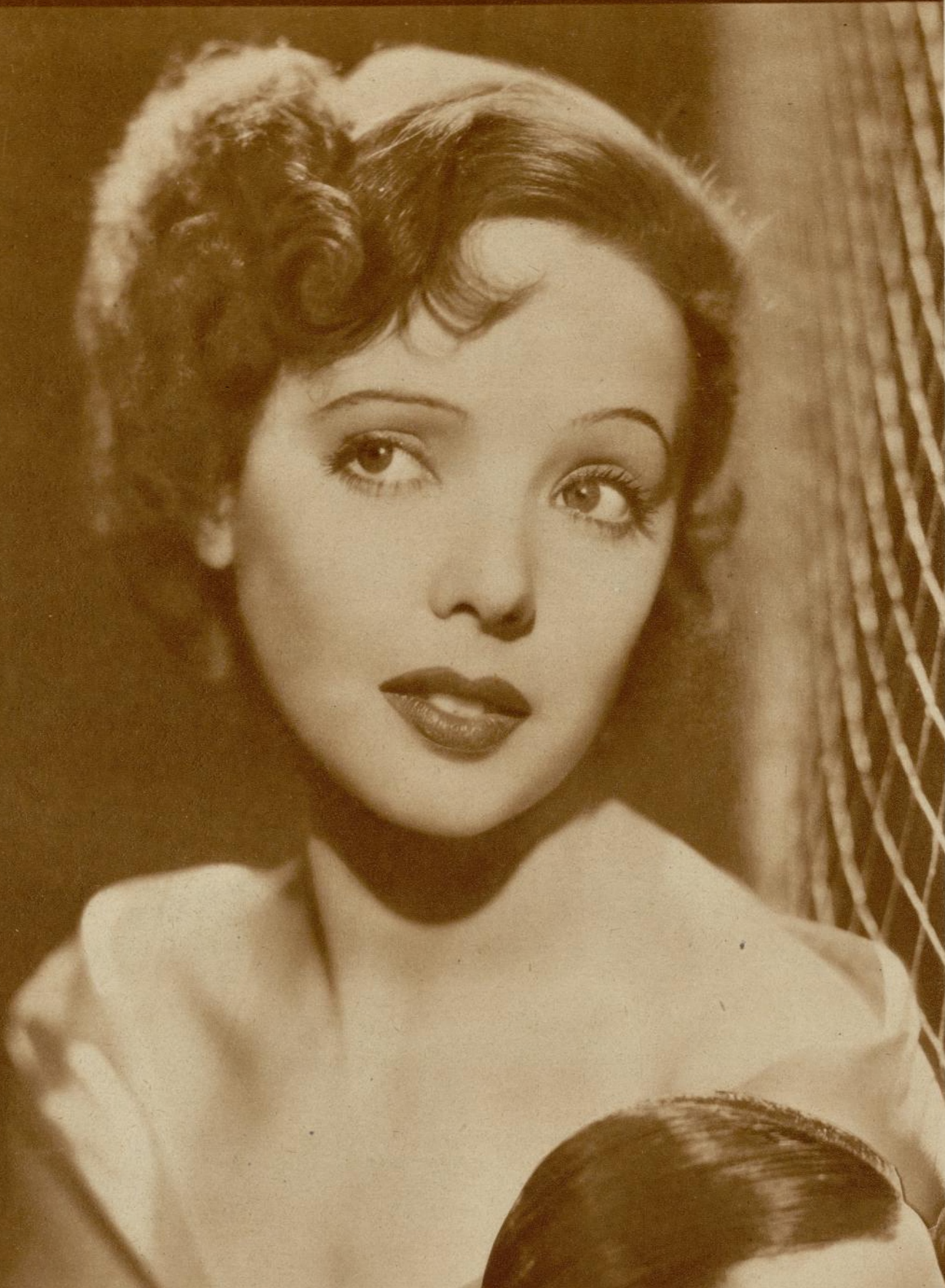
Jessie Matthews, heroína del film.