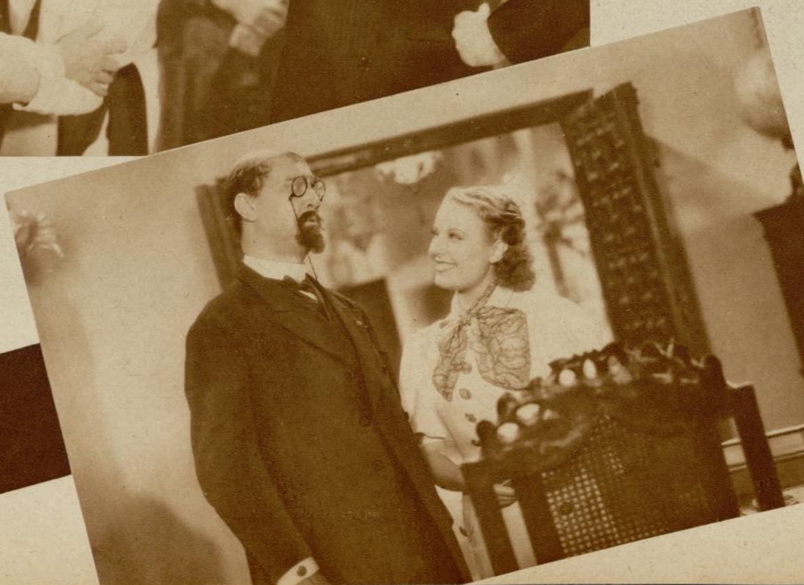
La señorita y el administrador; lo caduco y lo nuevo; lo imponente y rigido del pasado y la sana alegría del presente plasmados en una escena del film, por Fernando Delgado.