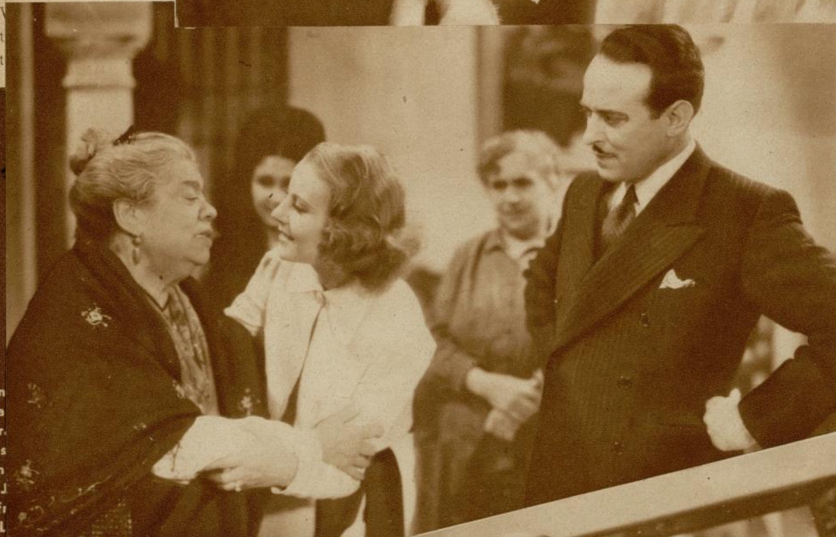
Rosita Díaz Gimeno, la primera de nuestras actrices cinematográficas, viviendo las escenas castizas de esta famosa opereta.