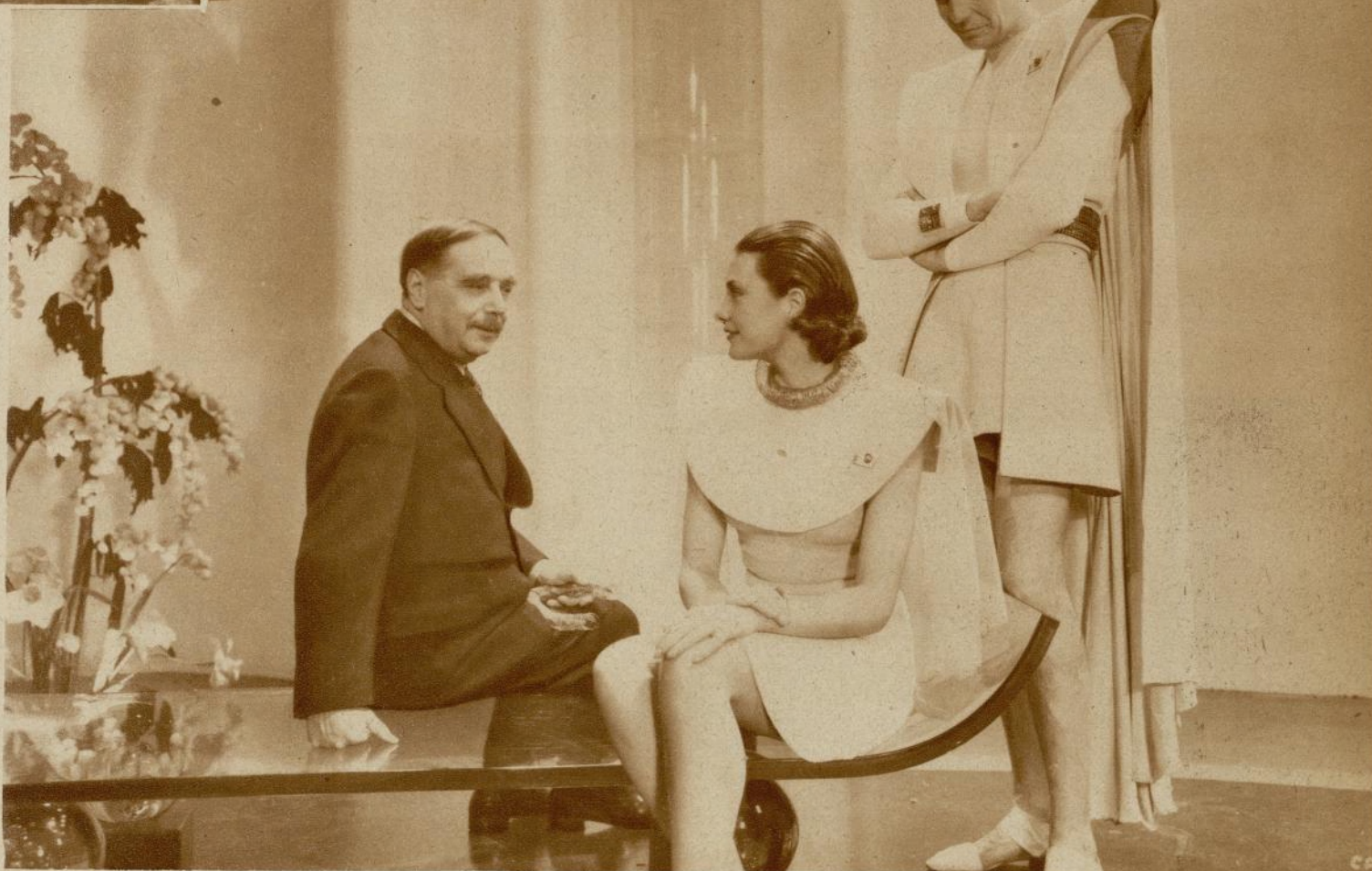
H. G. Wells conversando con Pearl Argyle y Raymond Massey, principales protagonistas del film, durante el rodaje de la película que ya han pasado en prueba privada los Artistas Asociados.

Más importante que todo, desde un punto de vista literario, es la declaración de Wells de que este «procedimiento» señala un momento de vasto significado en su vida, pues, según él dice, no volverá a publicar ninguna otra novela o libro de ninguna especie, dedicándose en el futuro a filmar «procedimientos» exclusivamente. La segunda de sus nuevas obras, «The Man Who Could Work Miracles», está ahora