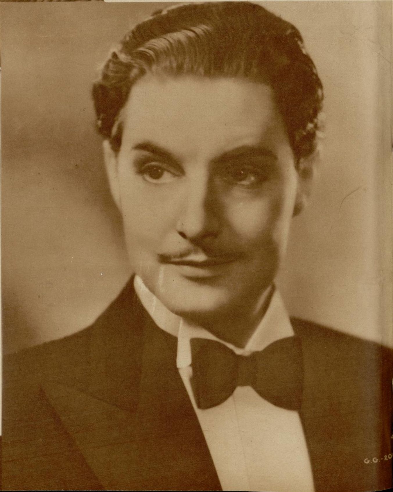
ROBERT DONAT Y RENE CLAIR

Marius celebraba el nacimiento de un hijo, René. Con el mejor vino que sus recursos le permitían, nuestro hombre y sus compañeros brindaron por la prosperidad y futura felicidad del pequeño. Papá Chomette prometió hacer cuanto de él dependiera para que su hijo llegase a ser un respetable y pudiente hombre de negocios.