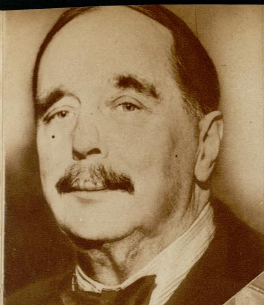
H. G. Wells el famoso novelista autor del libro en que se basa «La vida futura».