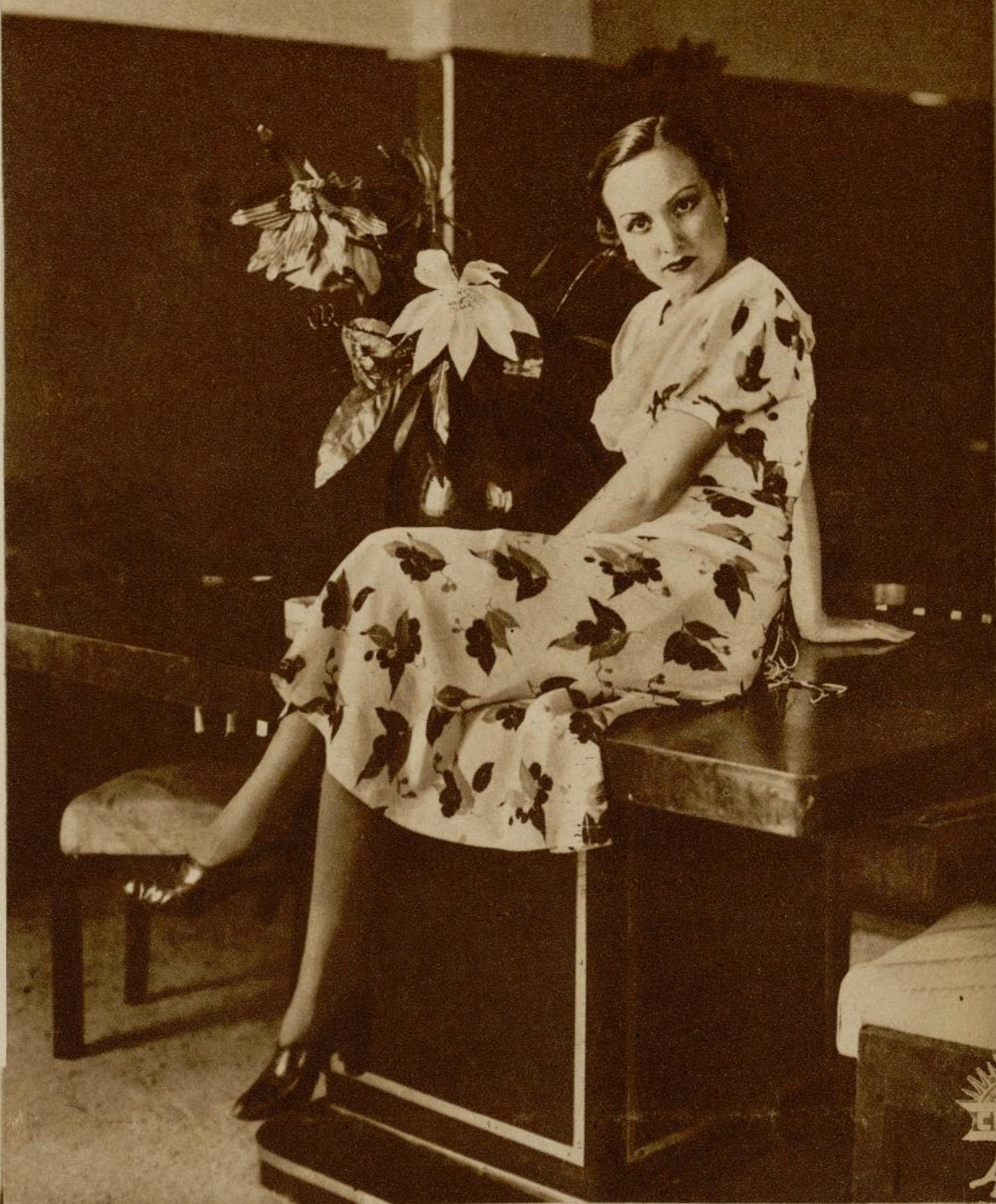
Antoñita Colomé, en un rincón de su estudio.

sa, y es natural que no deje de preocuparse por ello, puesto que de los nuevos films por ella interpretados, que se avecinan, se espera su consagración definitiva como «estrella» de primera magnitud.