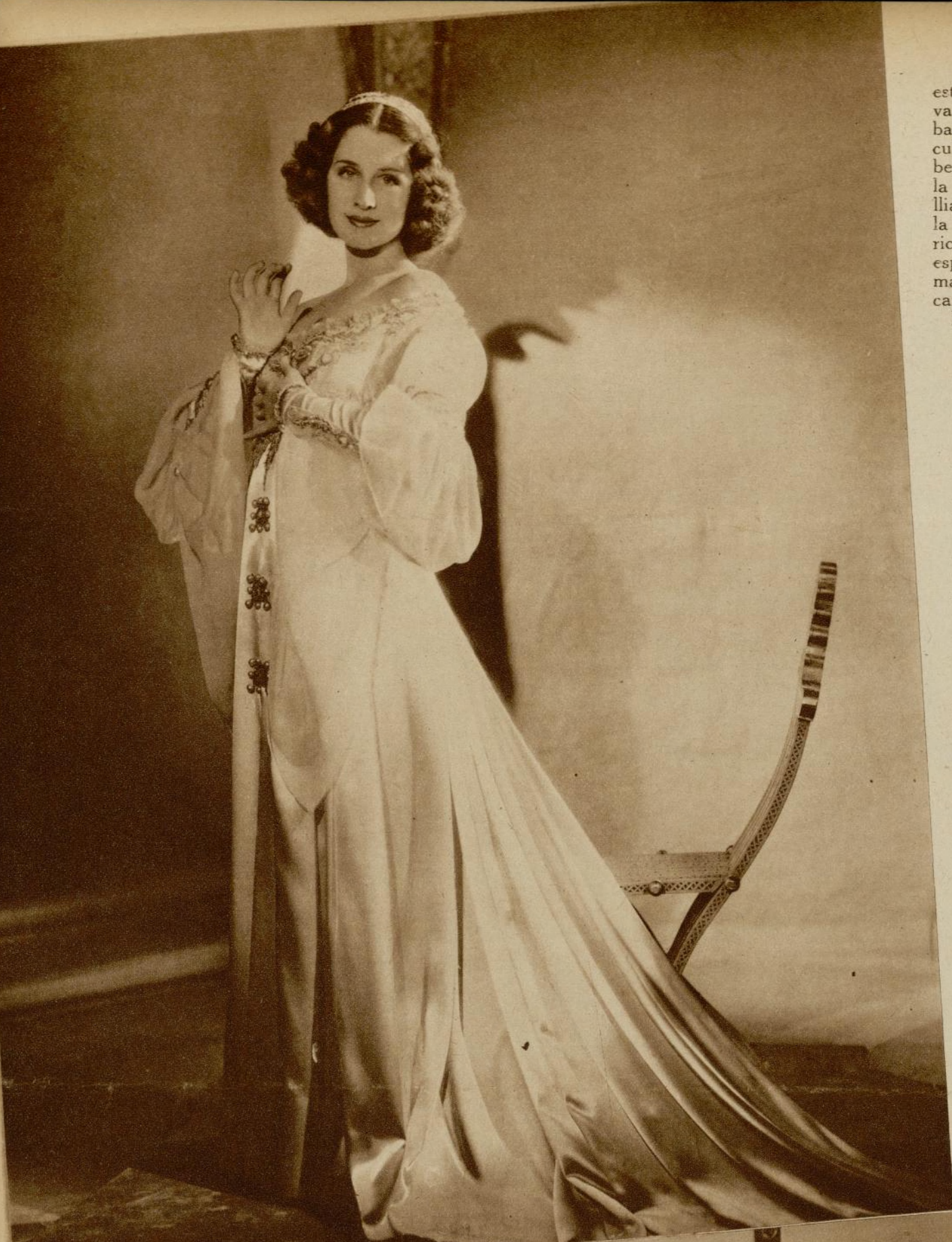
Norma Shearer con el traje que luce en su último film, «Romeo y Julieta».

LA idea de llevar a la pantalla el drama inmortal de Shakespeare «Romeo y Julieta», cuenta ya muy cerca de diez años de edad. Nació en la mente de Irving Thalberg, allá por el año 1927, y fué madurando lentamente, porque la gestación de una obra de esta envergadura es cosa mucho más laboriosa de lo que a primera vista pueda imaginarse. Cuando un espectador, desde su butaca, contempla un film cuyas escenas se desenvuelven en un par de horas, no puede, ni remotamente, imaginarse el cúmulo de dificultades que ha sido necesario vencer para ofrecerle aquellas cortas horas de entretenimiento.