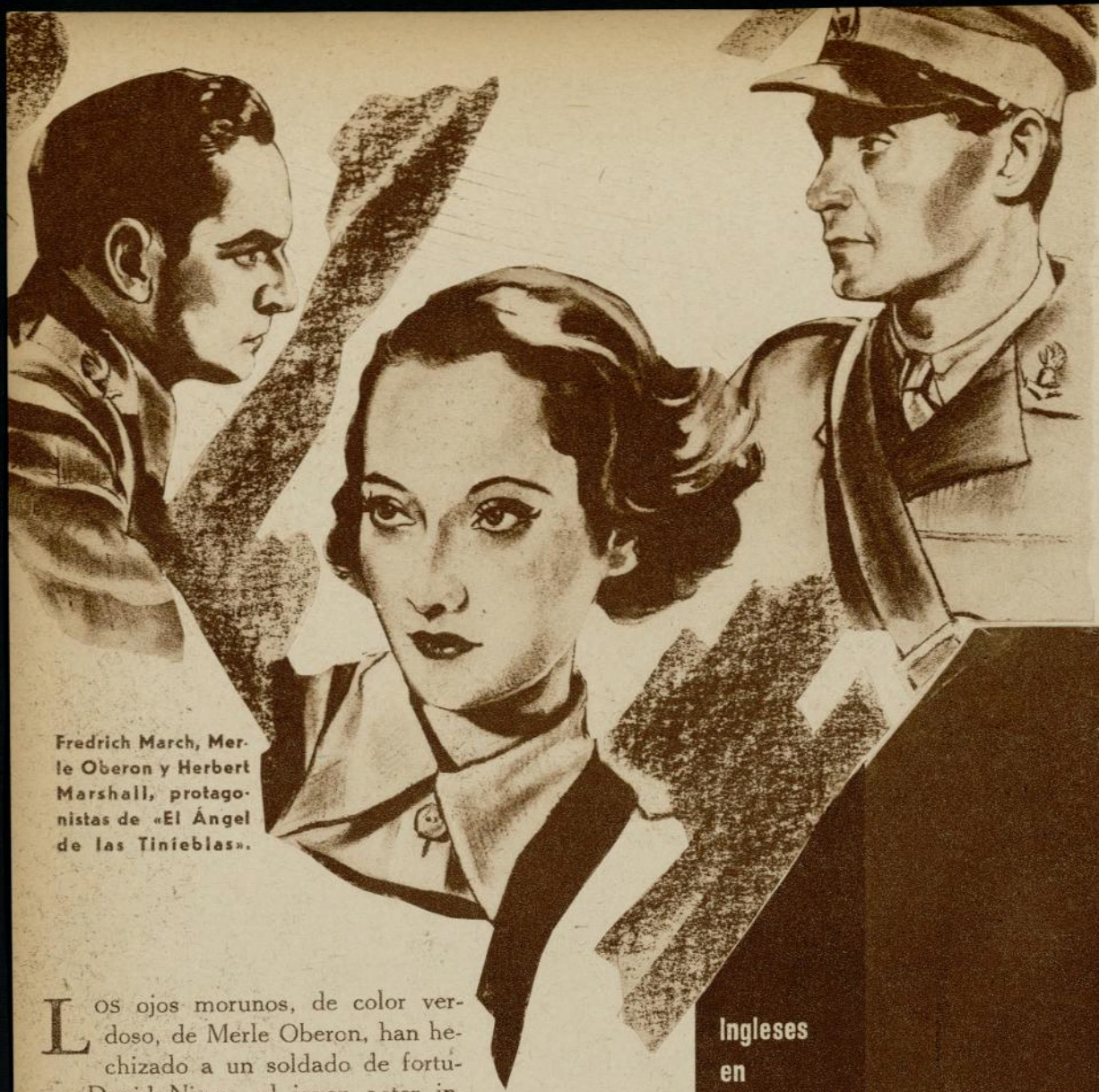
Fredrich March, Merle Oberon y Herbert Marshall, protagonistas de «El Ángel de las Tinieblas».

Los ojos morunos, de color verdoso, de Merle Oberon, han hechizado a un soldado de fortuna. David Niven, el joven actor inglés, dijo hace pocos días: