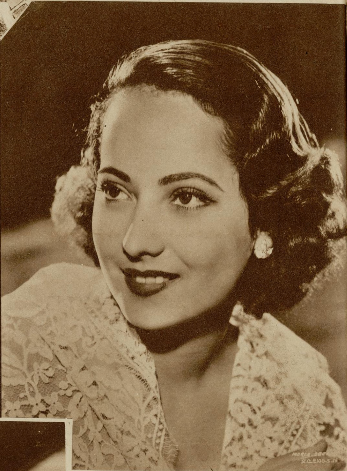
Merle Oberon, tal como la veremos en «Love Under Fire».

Proyectos para el porvenir, vienen a continuación: