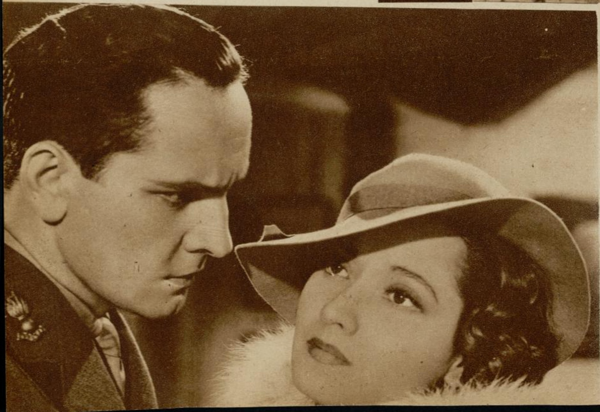
Fredrich March y Merle Oberon, en una apasionada escena de «El Ángel de las Tinieblas».

—¡Naturalmente! El marido también tiene que estar interesado en algo fuera del hogar. Pero su caso es diferente, ya reconocido por todos y de siempre. Hay que trabajar para vivir. Pero la mujer debe también trabajar algo para no vivir siempre «de gorra». El hombre ya tiene, naturalmente, salidas hacia afuera. Lo necesario es que la mujer las adquiera también, para no oxidarse en su