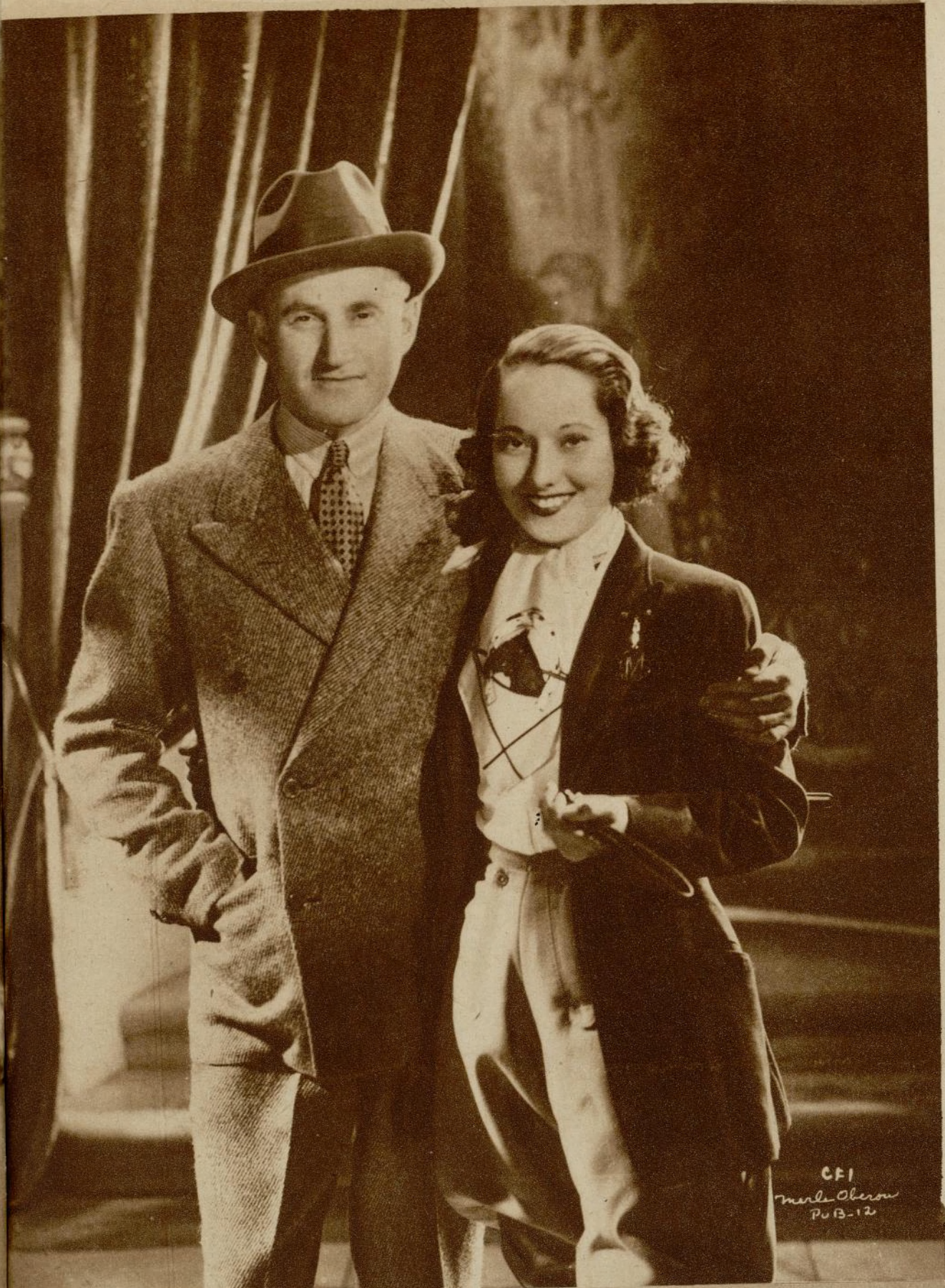
Merle Oberon, la bella inglesita y Samuel Goldwyn, su introductor en el cine americano.

hogar, sin ideales, sin cambios, sin horizontes. ¿No le parece?