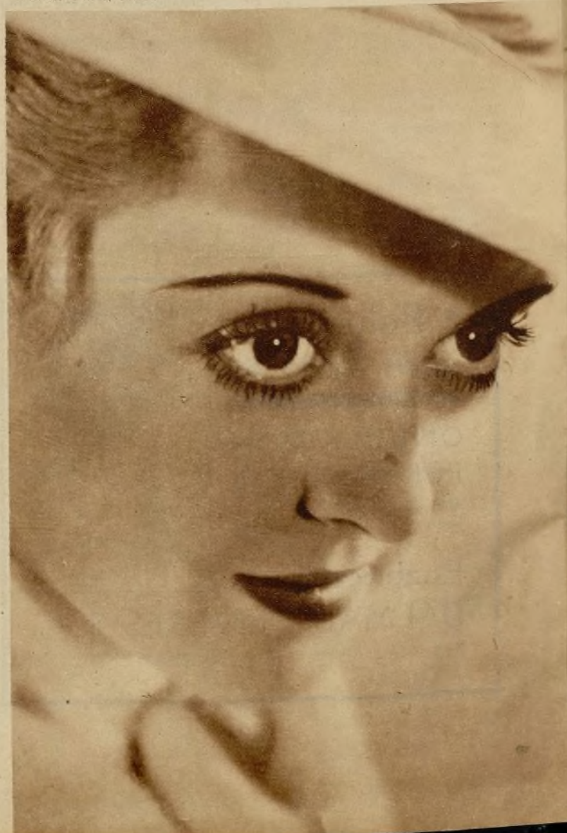
La Academia no lo dice, pero Bette Davis es en rigor la primera actriz cinematográfica de Estados Unidos en 1934.