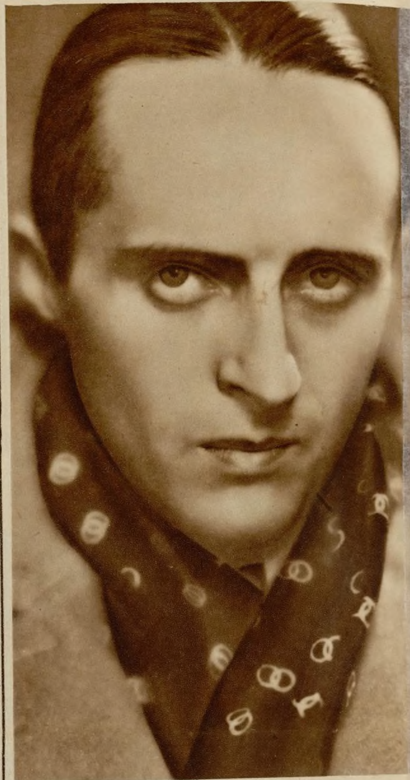
Este gran cinematografista francés ha obtenido el máximo galardón para su película "El último millonario", en el Certamen Internacional de Moscou.

RECIENTEMENTE tuvo efecto en la gran sala de la Casa de los Sindicatos de Moscú una asamblea solemne consagrada a la clausura del primer festival internacional del cinema. Eisenstein, el famoso director ruso, hizo conocer las decisiones del Jurado encargado de la distribución de los premios a las mejores películas extranjeras y soviéticas presentadas en el festival.