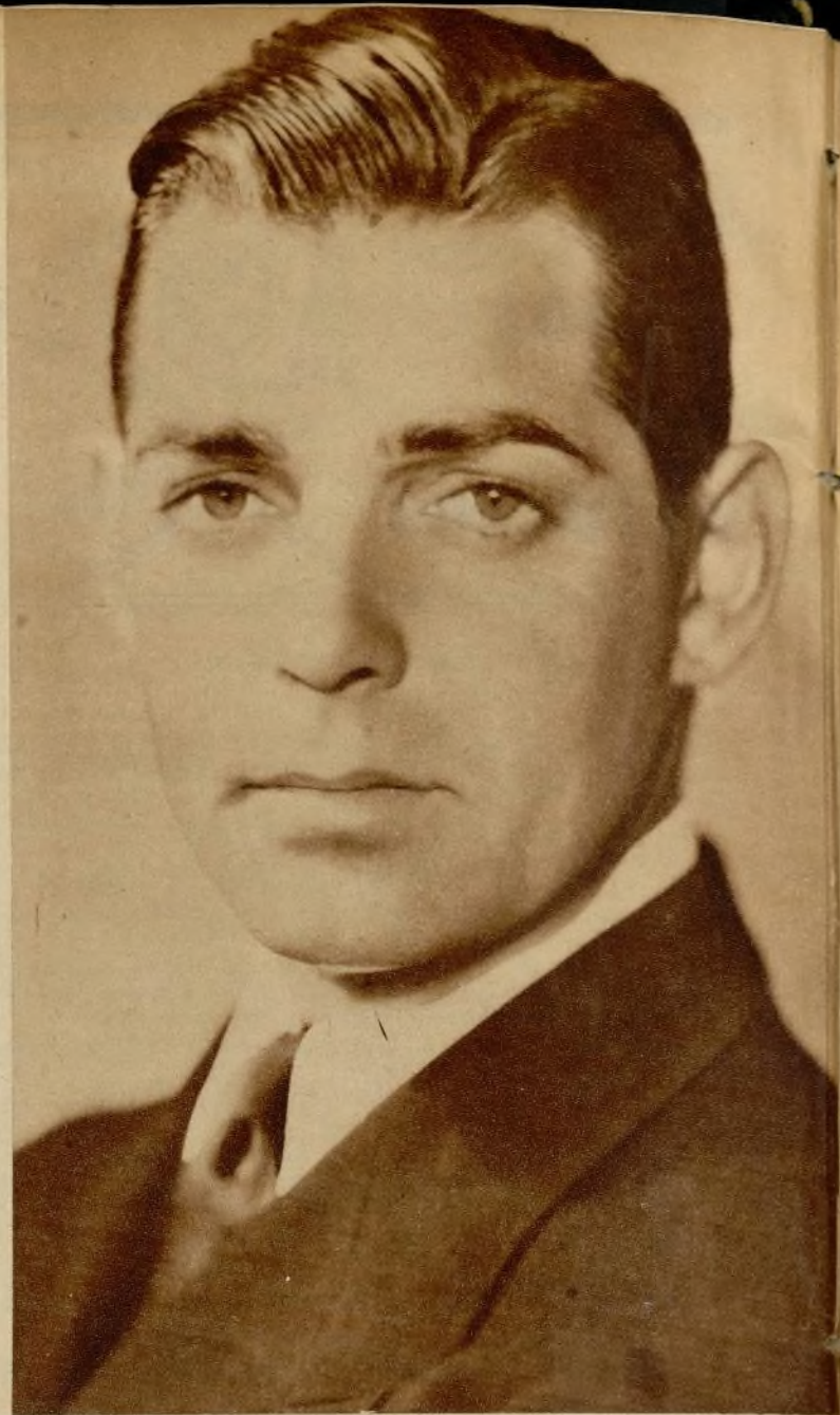
Clark Gable, que con Claudette Colbert se llevó, al alimón, la distinción de ser el mejor actor de Hollywood 1934. La Academia lo dijo entre aceitunas y champán.

Y se quedó sin el galardón de la Academia de Artes y Ciencias Cinematográficas. Pero no sin la protesta de un buen número de sus miem-