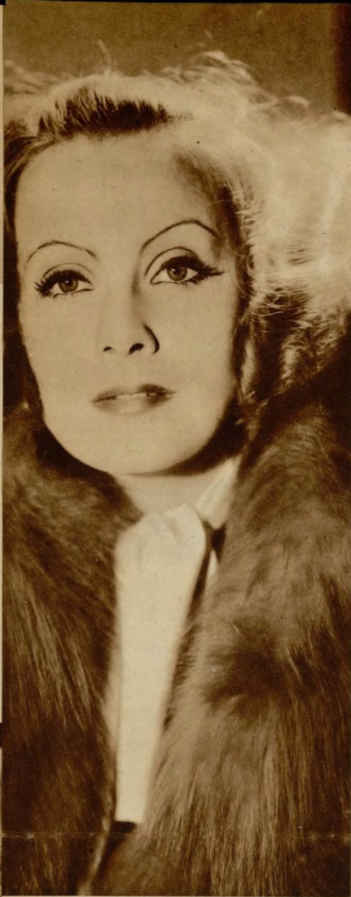
Greta Garbo, la divina, en dos de sus últimas fotografías, en las que resalta la corrección y originalidad de su belleza, sensual y perversa.