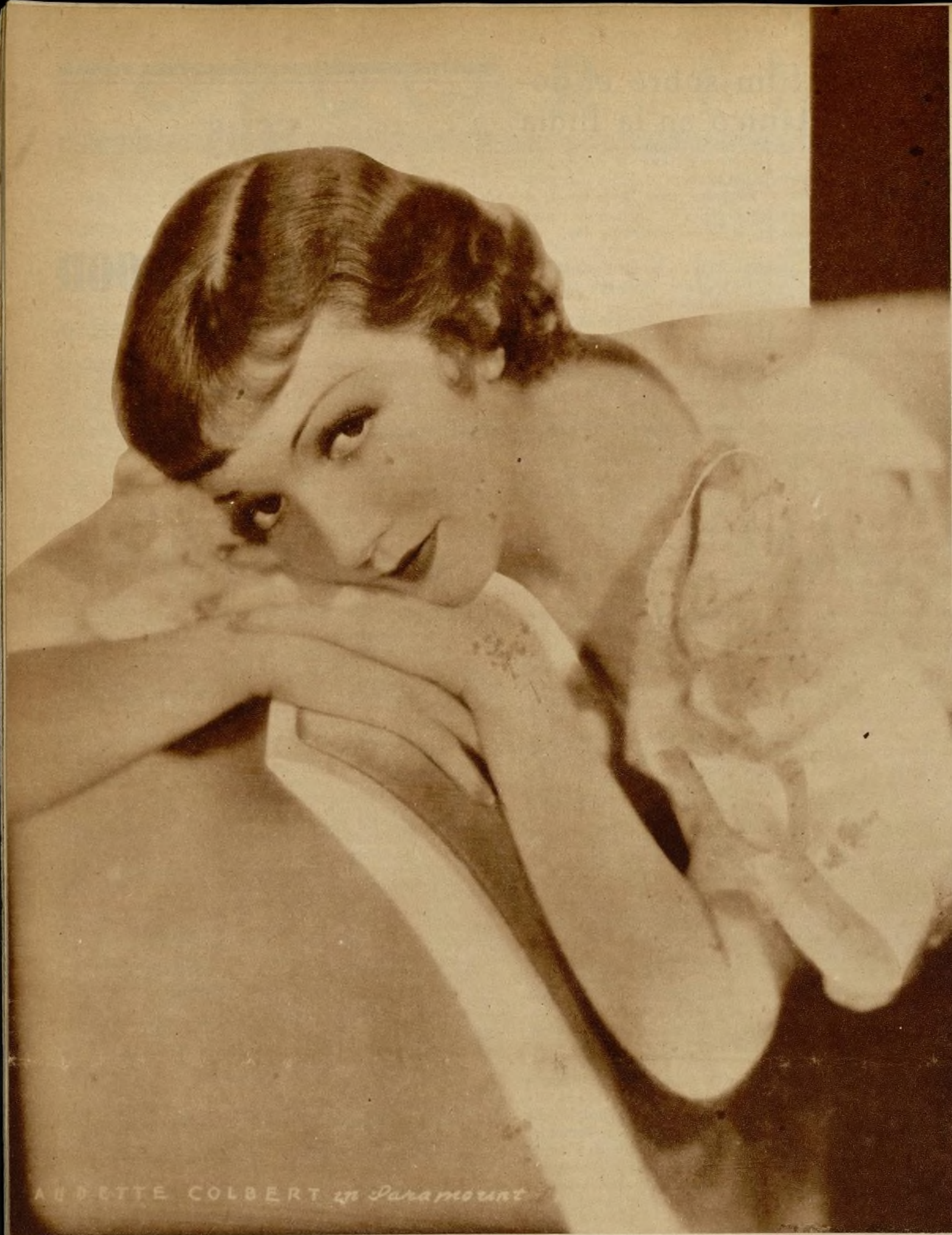
LA BETTE COLBERT en Paramount

La Academia de Artes y Ciencias Cinematográficas lo dice: «Claudette Colbert es la primera actriz de Estados Unidos 1934.» Amen.