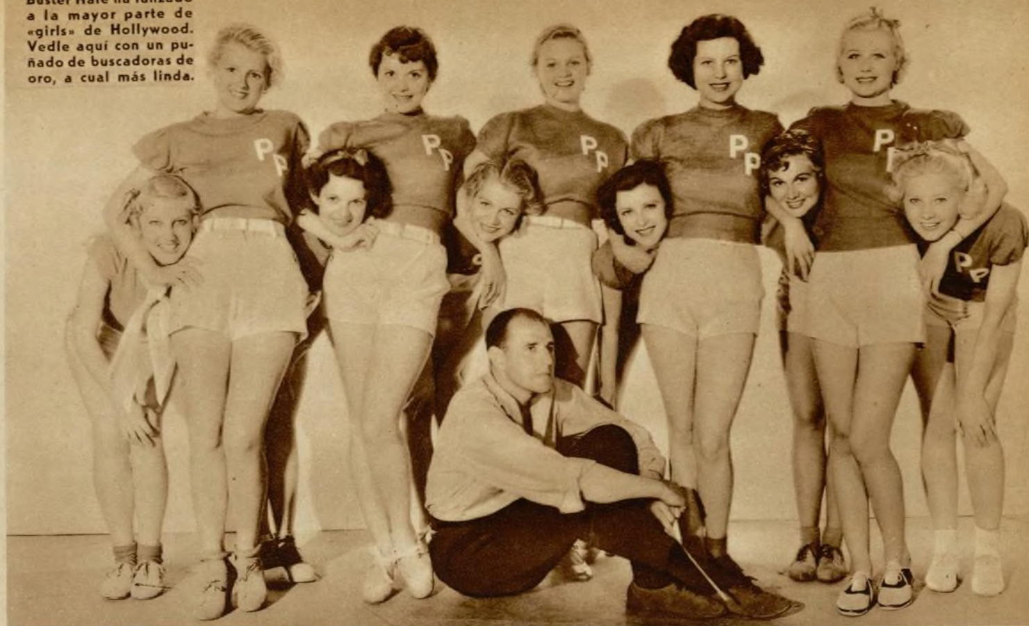
Buster Hale ha lanzado a la mayor parte de «girls» de Hollywood. Vede aquí con un puñado de buscadoras de oro, a cual más linda.