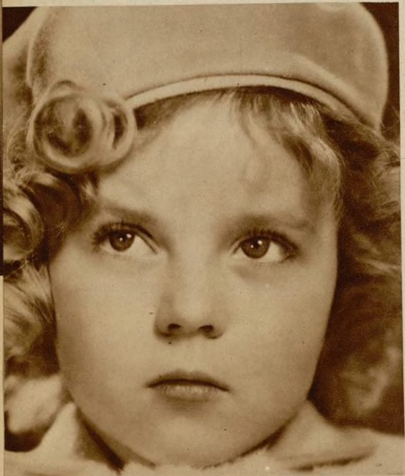
Shirley Temple, la precoz maravilla de la cinematografía, nos cuenta la historia de su vida... Memorias de una corta existencia llena de éxitos y halagos...

Tengo tres muñecas que Papá Noel me trajo y que las guardo en mi casita, ocultas a los ojos de los extraños. Estas muñecas son las más bonitas de Francia e Inglaterra. Cada muñeca lleva el vestido de un país distinto, lo que me hace recordar a los niños y niñas que desde todas las partes del mundo me escriben cartas pidiendo fotos. Mi casa de muñecas tiene cocina y cubiertos. A veces sirvo a mis amigos té y bizcochos. Lo más gracioso es que estos bizcochos parecen de verdad, pero no lo son, y es algo muy chistoso ver a cualquier niño tratando de comerlos. Papá dice que