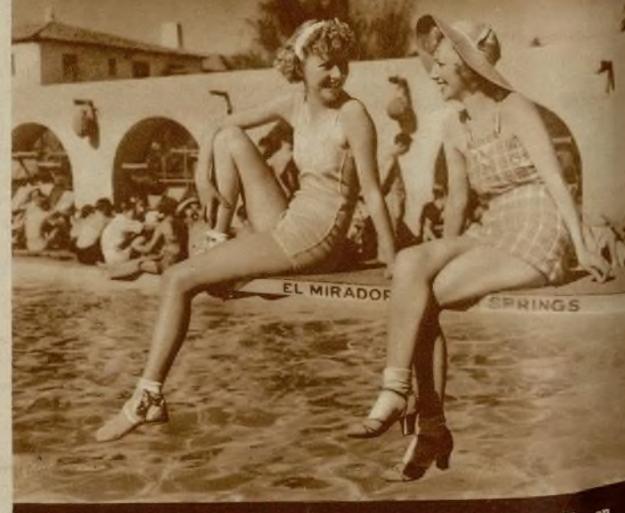
Betty Furness e Isabel Jewell, bellas actrices de M.-G.-M., en la piscina de «El Mirador», uno de los lugares de recreo más concurridos de California