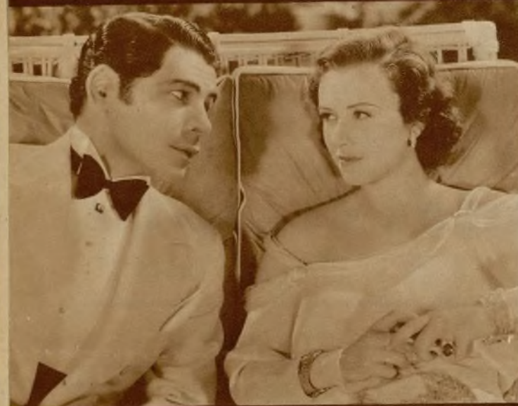
Paul Muni y Margaret Lindsay en un primer plano de su nuevo film para la Warner Bros «Bordertown»