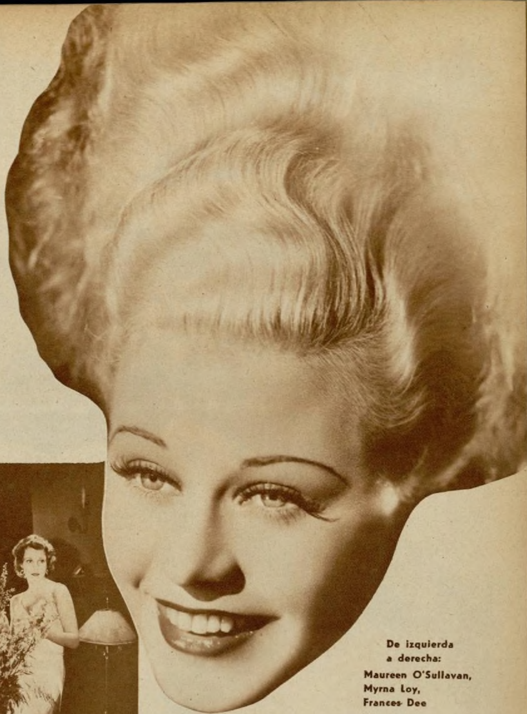
De izquierda a derecha: Maureen O'Sullivan, Myrna Loy, Frances Dee y Ginger Rogers.

Ginger Rogers nació en una ciudad de América que se llama (es todo un programa) «Independencia». Entró en la vida bailando, según cuenta ella. A los diez y seis años había triunfado en cierto número de campeonatos de charleston. Se pasó al profesionalismo, y en todos sus films ha bailado. Desde «La calle 42» hasta «Gay Divorcée», pasando por «Volando hacia Río Janeiro», donde creó «La carioca», con su compañero Fred Astaire, Ginger no ha cesado de bailar. Casada a los diez y siete años, divorciada a los diez y nueve, es hoy en día la esposa del galán Lew Ayres. Tiene veinticuatro años, y por ahora dice que es muy dichosa. Que dure esta felicidad.