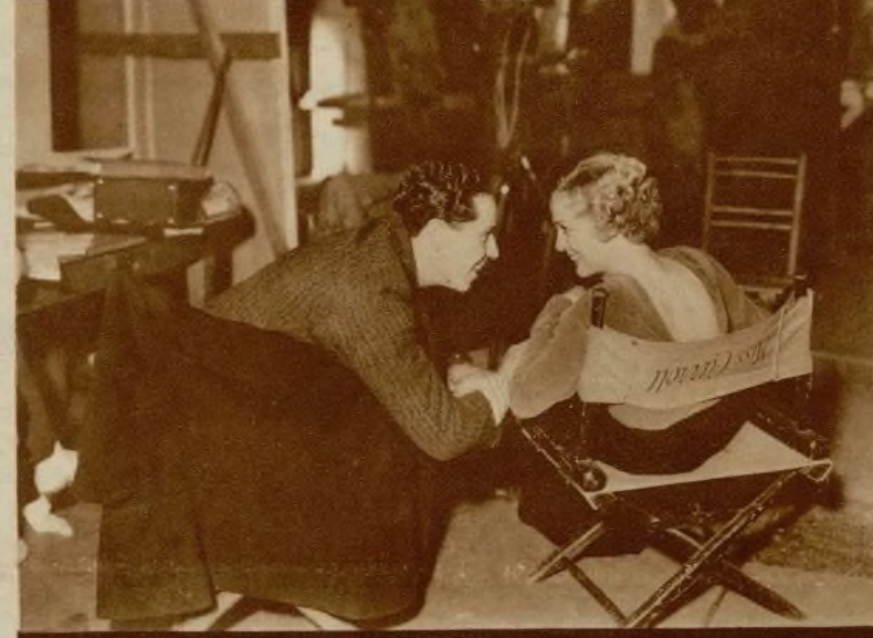
Roger Pryor y Gloria Stuart charlando amigablemente en un descanso durante la filmación de «I Like It That Way»