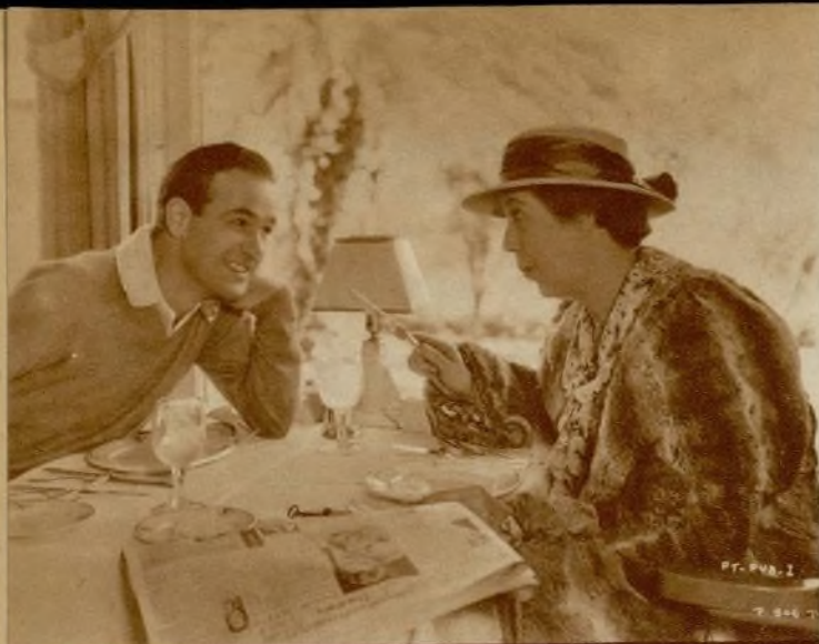
Chick Chandler y Edna May Oliver en un descanso durante la filmación de «Murder on a Honeymoon», para la R. K. O.