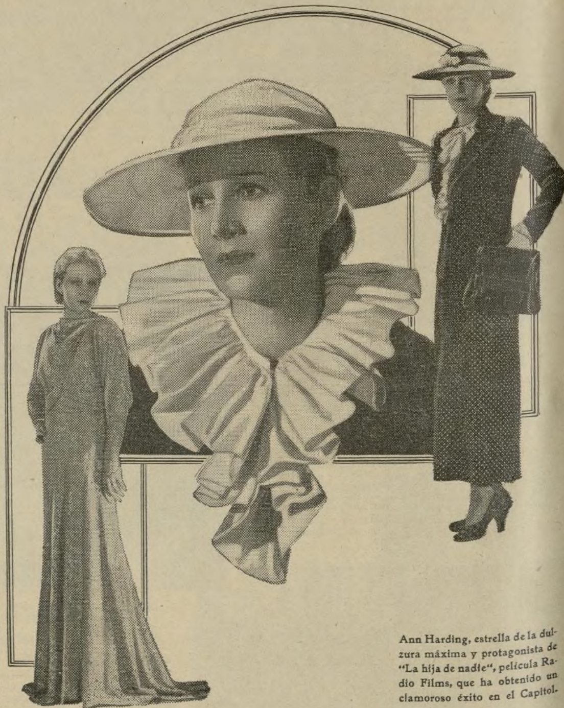
Ann Harding, estrella de la dulzura máxima y protagonista de «La hija de nadie», película Radio Films, que ha obtenido un clamoroso éxito en el Capitol.