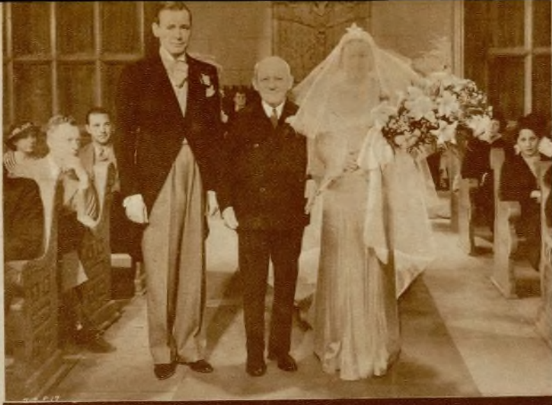
Carl Laemmle, presidente de la Universal, con Herbert Marshall y Margaret Sullivan, que se disponen a contraer matrimonio en uno de los films que interpretan para la Universal.