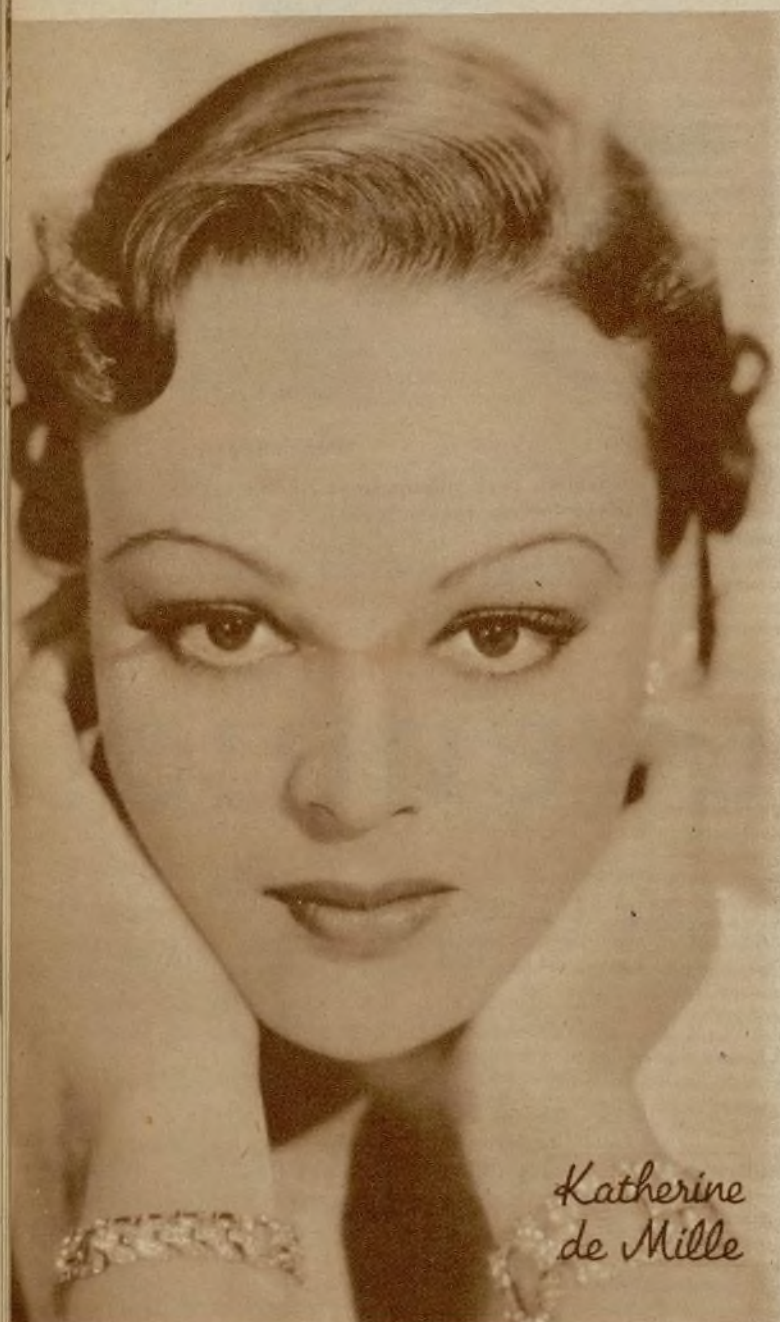
Katherine de Mille

Cecil B. de Mille, joven de belleza morena, de líneas rotundas, que se distinguió en «Viva Villa!», en «Suenan las clarinas» y en «No es pecado», y a quien volveremos a ver en «The Call of the Wild», de la obra de Jack London (con Clark Gable y Loretta Young), y en el nuevo gran film de De Mille, «Las Cruzadas», puede ser una de las más interesantes.