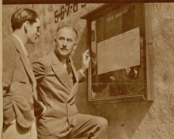
John Hallyday y Laurence Olivier «co-stars» de Ann Harding en el film R. K. O. «Westward Passage», consultando en la tablilla del estudio las escenas en que tendrán que intervenir.