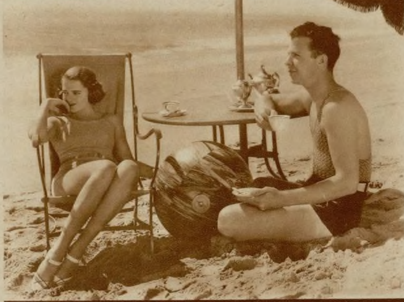
Dick Powell y Ruby Keeler durante sus vacaciones en la playa de Miami