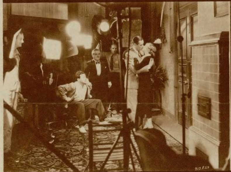
Margaret Sullivan, Herbert Marshall y Frank Morgan interpretando una escena bajo la vigilante mirada del director William Wyler (sentado) para su nueva producción Universal.