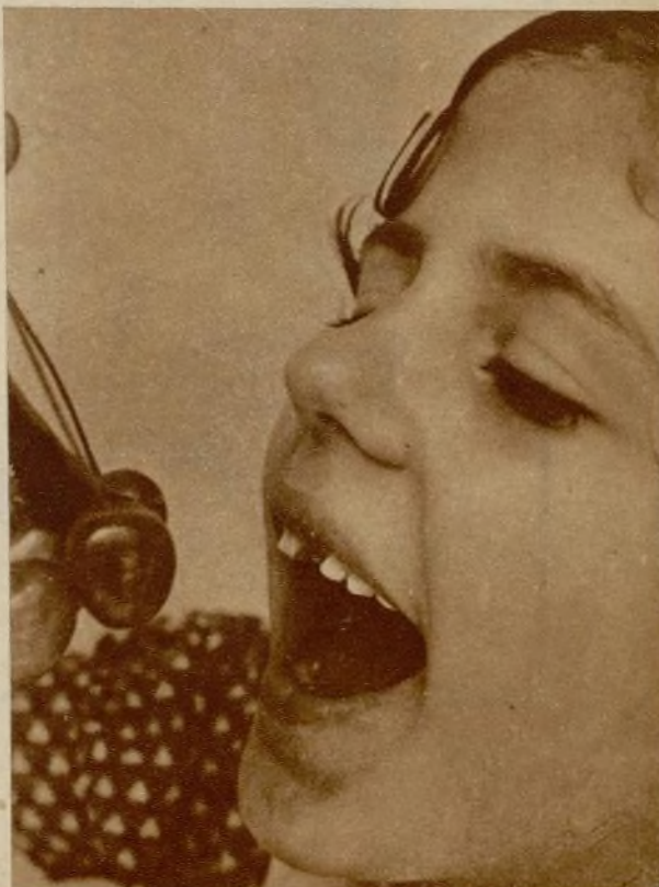
«Las cuatro estaciones»