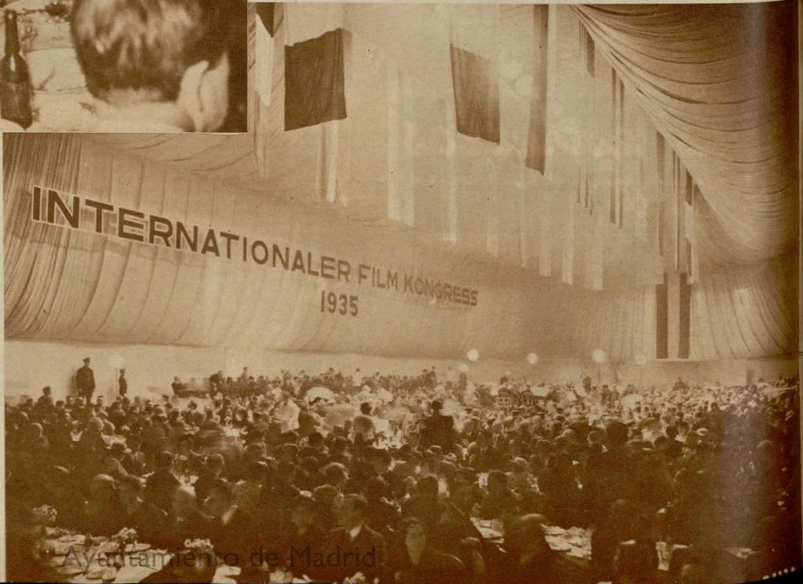
Imponente aspecto de la sala donde se celebró el banquete con que la UFA obsequió a los asistentes al Congreso.

Añadió que podía anticipar, sin temor a equivocarse, que la producción española para la temporada 1935-1936, constará por lo menos de 25 a 30 producciones.