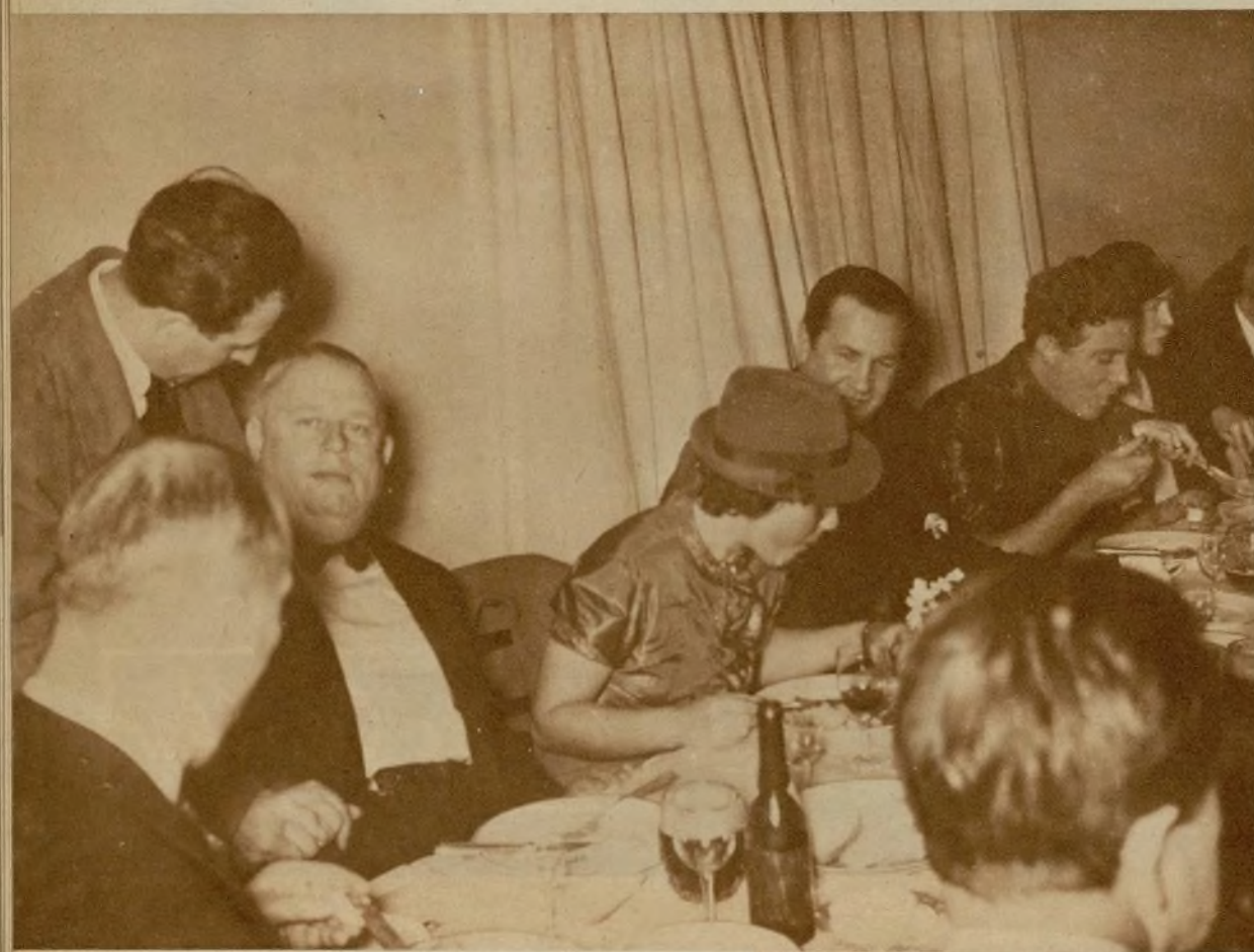
Artistas cinematográficos que asistieron al banquete ofrecido por la UFA a los congresistas.