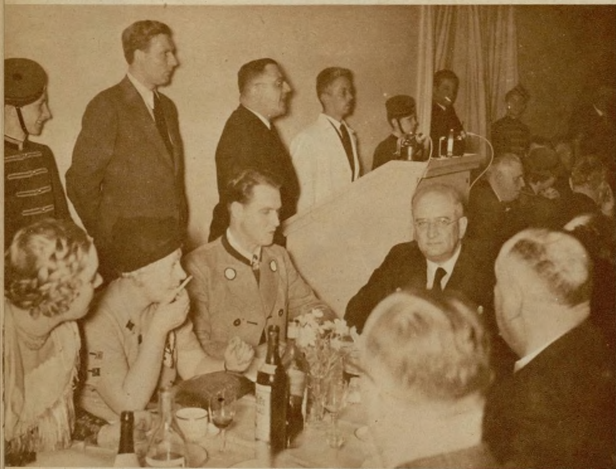
La primera editora europea, la UFA, de Berlín, ofreció una cena a los congresistas. — He aquí una de las mesas del banquete.

H a inaugurado sus trabajos el Congreso Internacional del Film. Los congresistas pasan de 600 y están representados la mayor parte de los países europeos. Las autoridades berlinesas y las del gobierno, atienden con el mayor cuidado y solicitud a los huéspedes extranjeros. El acto de apertura del Congreso ha constituido una grandiosa solemnidad.