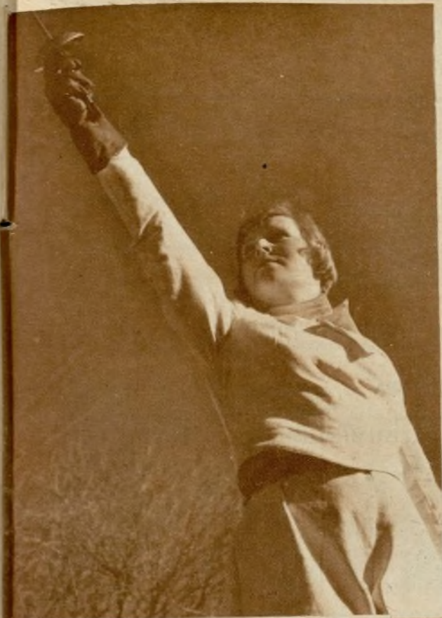
«La dona i els sports»

Después de un paréntesis de cuatro días, la Federación Catalana de Cinema Amateur celebró el pasado jueves la tercera sesión de este concurso que está resultando interesantísimo, a pesar de no reunir a todos los valores de Cataluña. Los siete films proyectados en esta sesión hablan muy alto en honor de los entusiastas amateurs que, venciendo grandes obstáculos, logran filmar breves ensayos de cinema (y digo ensayos, porque su corto metraje no les permite sino bocetar) que a veces contienen valores artísticos y técnicos insospechados.