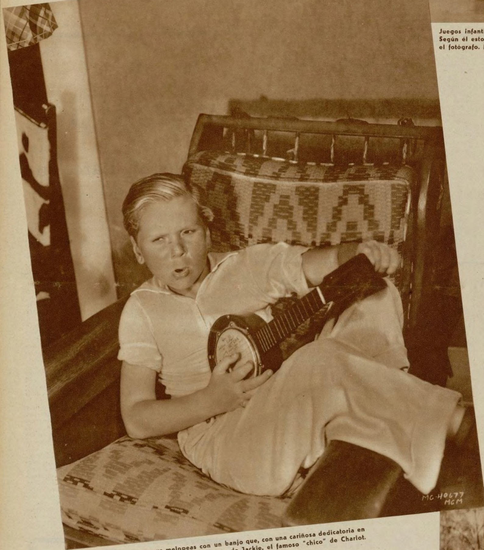
Jackie Cooper acompaña sus melopeas con un banjo que, con una cariñosa dedicatoria en el parche, le regalara Robert Coogan, hermano de Jackie, el famoso "chico" de Charlot.

gastos originados con el nacimiento de su hijito. El crecimiento anormal del nene preocupaba a la madre. Según todas las apariencias, la criatura padecía de raquitismo. Sus constantes quejidos degeneraron más tarde en severos ataques de tos ferina, y gracias a los esfuerzos infinitos de la joven madre, el niño tuvo la mejor atención médica que podía esperar. Después de incontables angustias, se logró el completo restablecimiento del pequeño. Súbitamente, y como por magia, el muchacho comenzó a mejorar y ganar en peso. En poco tiempo Jackie estaba robusto y fuerte, y casi al mismo tiempo comenzó a dibujarse en sus labios infantiles, esa adorable sonrisa de «pucherito» que ha sido después una de las características de su personalidad artística, y que le conquistó el corazón de todos los pueblos de la tierra.