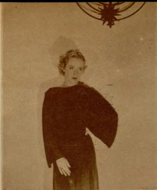
A Miriam Hopkins le gustan los hombres muy enérgicos...