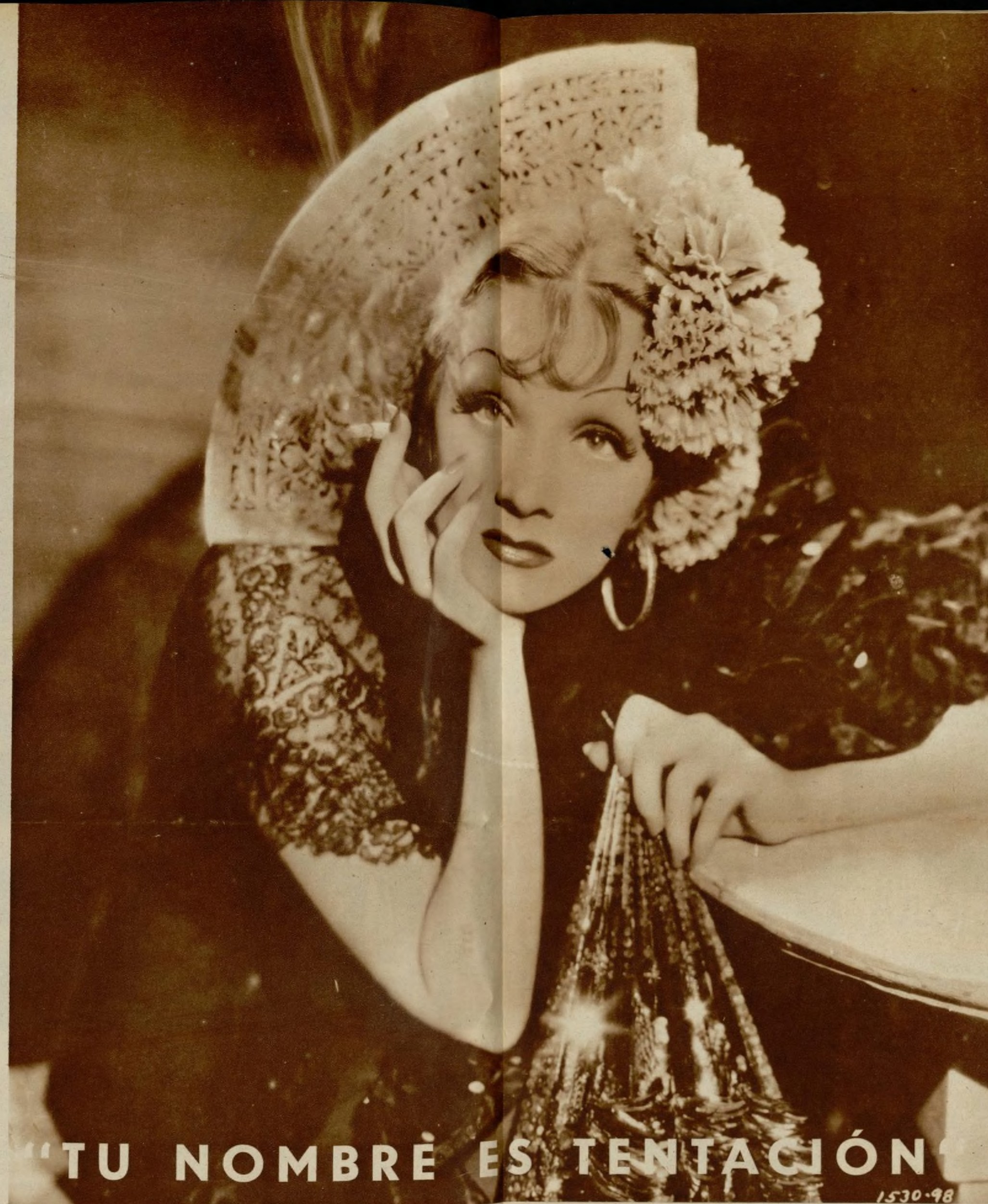
FILM PARAMOUNT, INTERPRETADO POR MARLENE DIETRICH

ESPAÑA no ha tenido suerte hasta hoy con los intentos cinematográficos que han buscado en ella ambiente para sus films. América y Francia han tratado en años anteriores, con harta ligereza, temas españoles que, de haber llegado hasta nuestras pantallas, hubiesen despertado la vergüenza nacional.