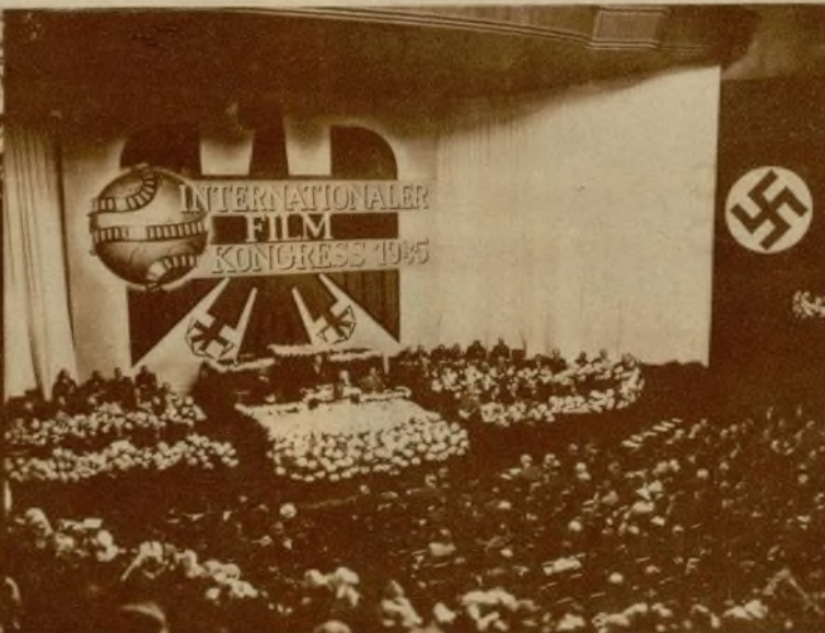
El Dr. Scheuermann durante su discurso en la solemne apertura del Congreso.