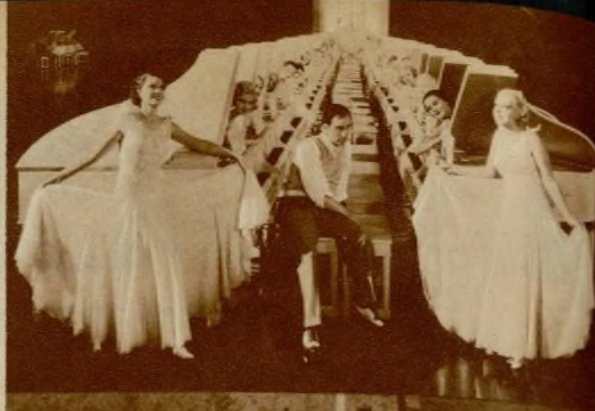
Busby Berkeley, director de «Vampiresas 1936», dirigiendo un cuadro de dicha revista.