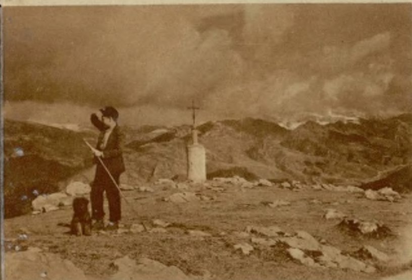
«Catllarás», de R. Puiggrós.

Hacemos una breve visita al local de «Amics de les Arts» y nos dirigimos hacia San Pedro de Tarrasa, maravilla arqueológica que guarda la ciudad como un tesoro. Cuando entramos en el baptisterio es la hora bella y brujal del crepúsculo; de entre la frondosa vegetación del rústico y romántico jardín, surgen las airosas y