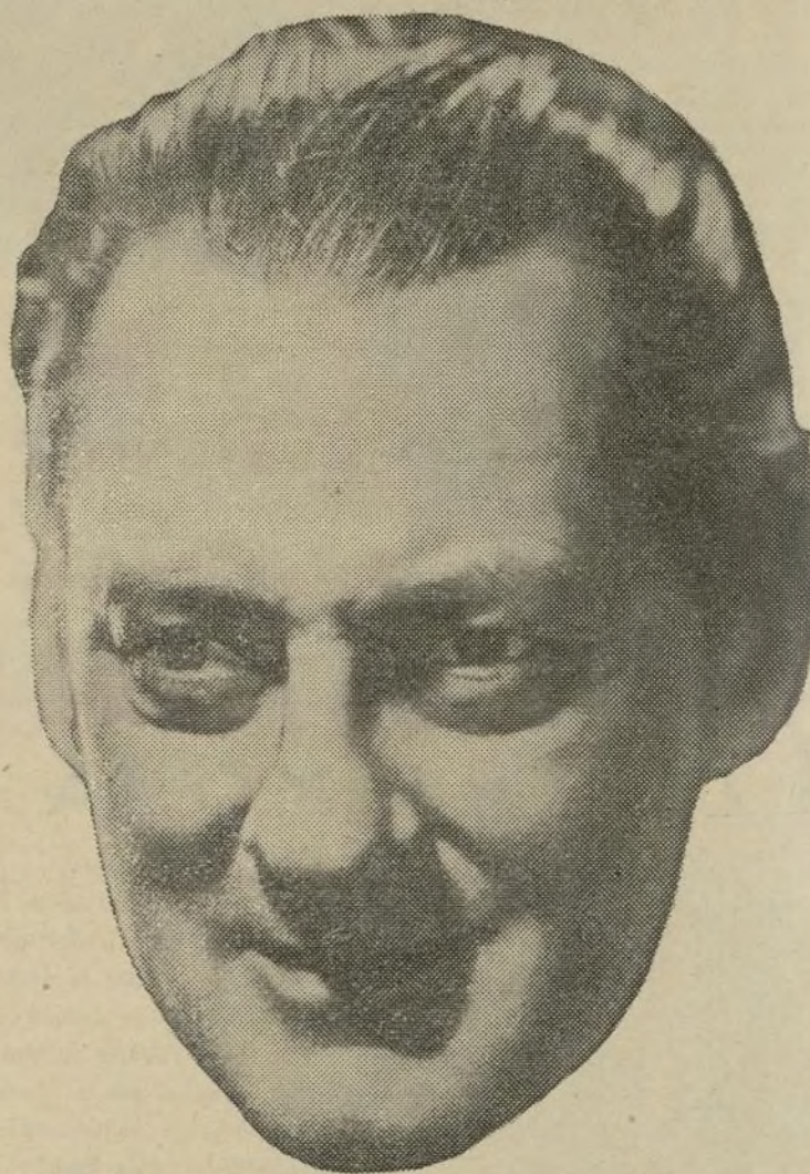
LIONEL BARRYMORE, protagonista de “EL VIAJERO SOLITARIO” que se proyecta en el Cine MARYLAND