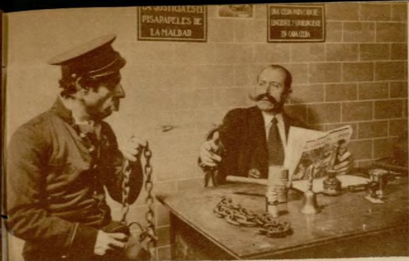
«Sangre en la pampa», de R. Serinyá y A. Sarsanedas.

Aprovechando la gentil invitación del dinámico secretario de la «Federación Catalana de Cinema Amateur», señor Colomer, tuve ocasión, el pasado día 12, de visitar la histórica ciudad egarense.