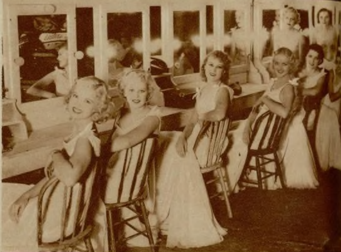
Un grupo de «girls» maquillándose para una escena del film Warner, «Vampiresas 1936».