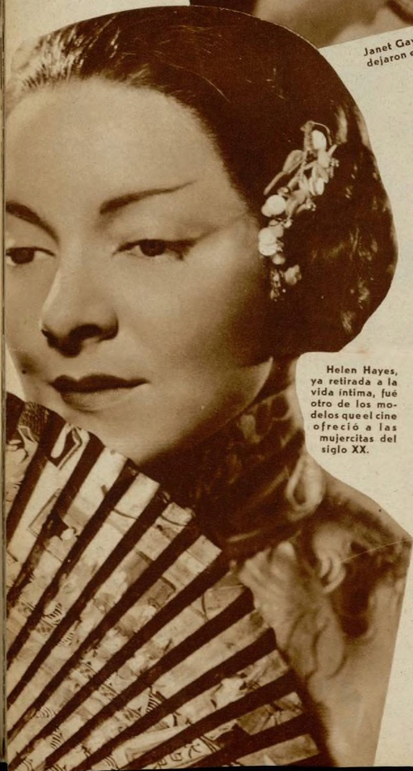
Helen Hayes, ya retirada a la vida íntima, fue otro de los modelos que el cine ofreció a las mujercitas del siglo XX.

El noventa por ciento de las mujercitas de hoy, ya sean modistillas, mecanógrafas o empleadas, imitan a las «stars» por coquetería, por un deseo de llamar la atención, o más aún: por originalidad. Y eso, en vez de criticarlo hay que elogiarlo, porque, bien mirado, tiene mucho de una pueril infantilidad. Todas esas muchachitas que vemos por la vía pública con las cejas a lo Dietrich, la boca maquillada al estilo gretagarboniano, el cerquillo a lo Herpburn y el andar sportivo de una Crawford, son—pese a todas sus apariencias—unas niñas. Las obreritas que con sus delantales claros, sus alpargatitas y su humildad se creen dignas sucesoras de Janet Gaynor, no dejan también de serlo. Hasta esa otra que fu-