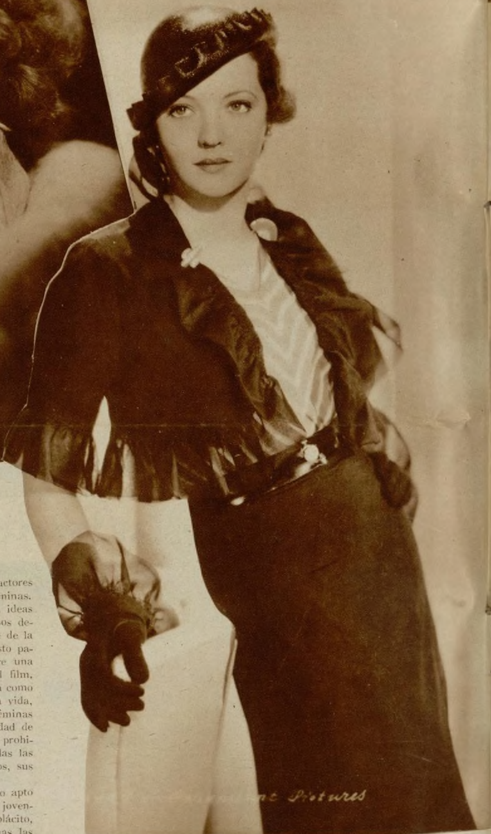
Sylvia Sidney, la exótica belleza de la Paramount, que ha puesto afanes dramáticos en más de una mente femenina.