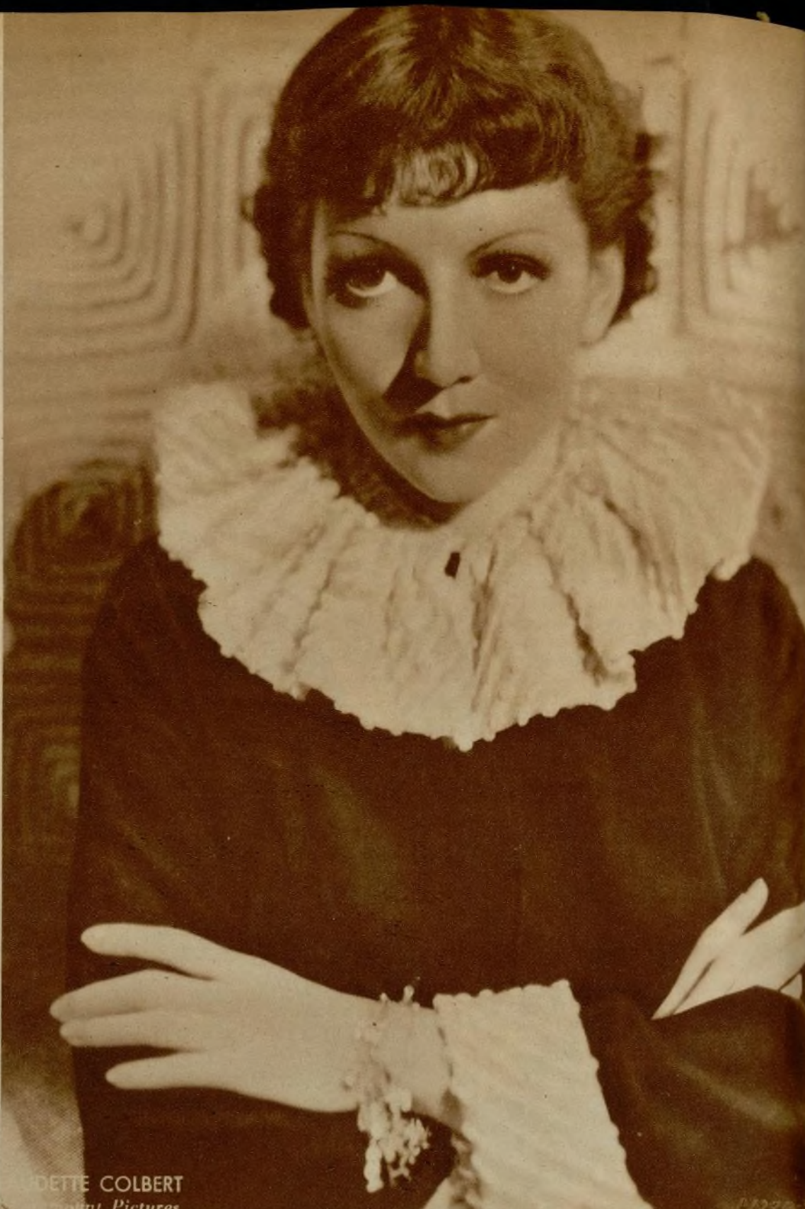
CLAUDETTE COLBERT Paramount Pictures