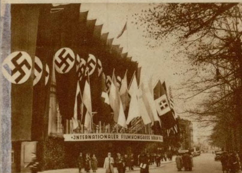
Entrada a la sala de sesiones del Reichstag (Kroll) donde se ha celebrado el Congreso Internacional del Film.

La Comisión VIII para films culturales y de propaganda, recomienda, en su resolución, a todos los países, que figuren siempre films culturales en el programa normal de los cinematógrafos. Considera, además, que todos los films culturales deben ser liberados en absoluto de impuestos, y señala la necesidad de que se den toda clase de facilidades en lo que se refiere a la censura, contingentes, aduanas, etc. Por lo que respecta al film de propaganda, desea el Congreso que se dé a tales films un valor cultural, instructivo y artístico, pues únicamente para films de propaganda producidos en esa forma, pueden formularse las facilidades que se desean obtener para los films culturales. En cuanto al trabajo aunado internacional, desea el Congreso que todos los países