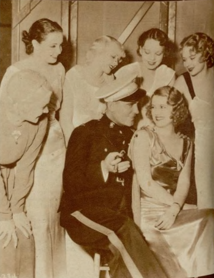
Pat O'Brien conversa con un grupo de coristas durante un descanso en la filmación de «Los diablos del aire».