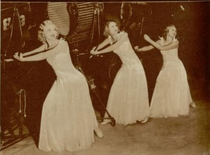
Un grupo de coristas que aparecen en «Vampiresas 1936».