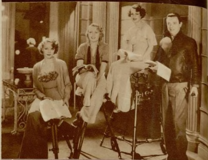
El director Robert Florey, ensayando el guión de la película «Caprichos», con las artistas que aparecen en dicha producción: Claire Dodd, Joan Blondell y Joan Wheeler.