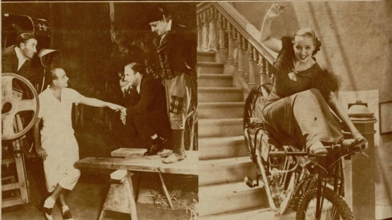
Lowell Sherman, veterano actor que actualmente figura entre los realizadores de la Universal, preparando el rodaje de una escena.