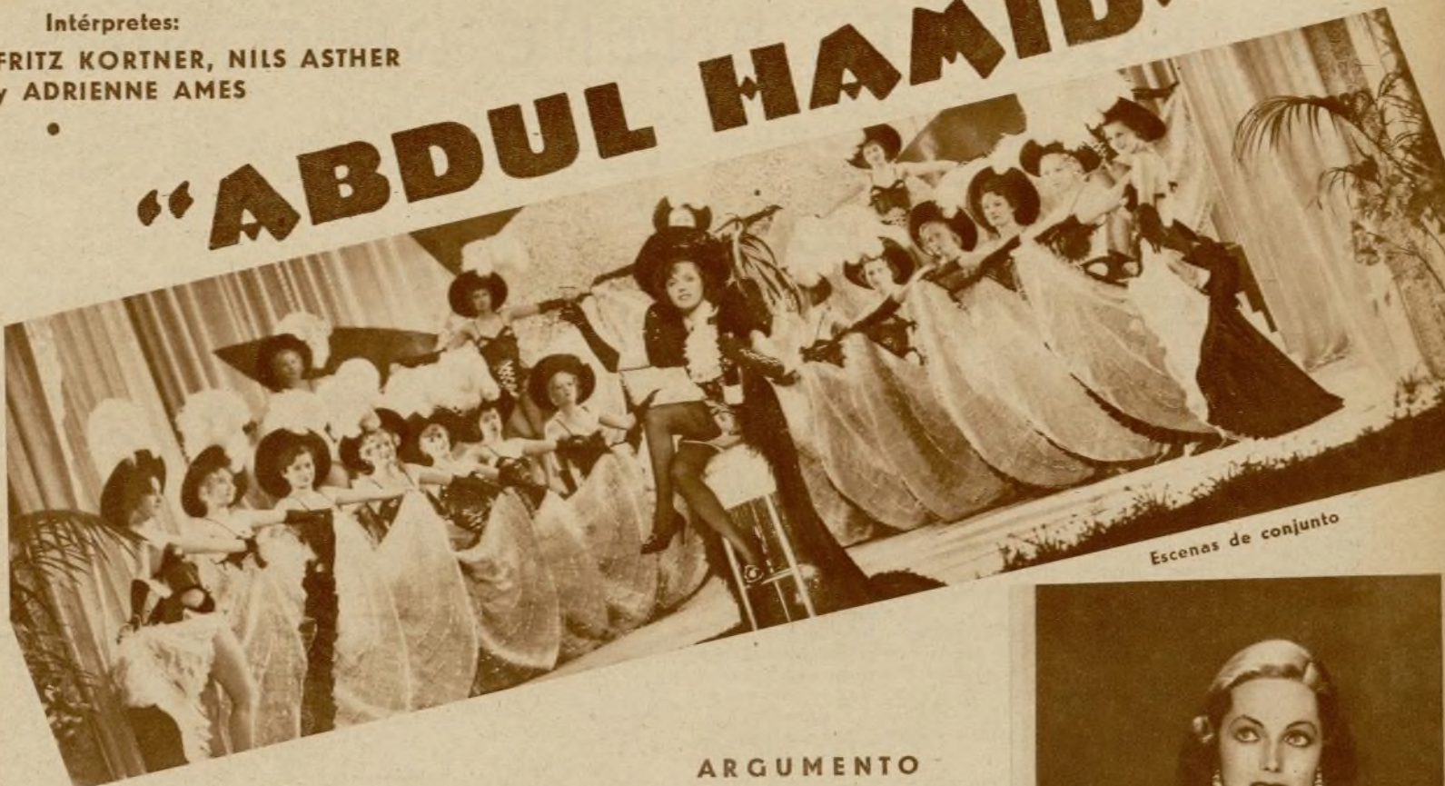
Escenas de conjunto