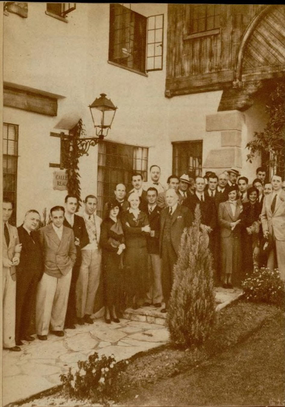
Foto histórica: Elementos de la colonia española de Los Angeles que asistieron a la inauguración de la calle Real de Fox Movietone City, reproducción de una vieja calle española.