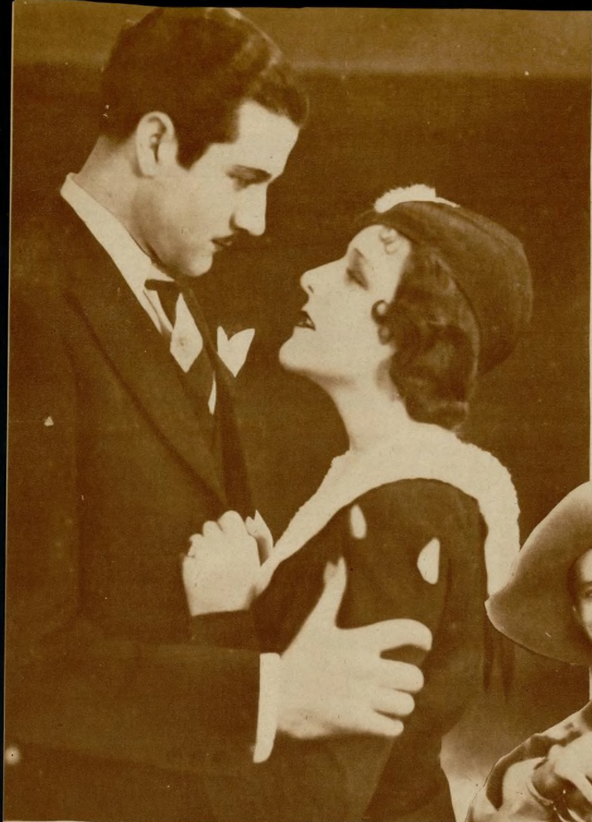
Enrique Guitart con Imperio Argentina en "El novio de mamá"