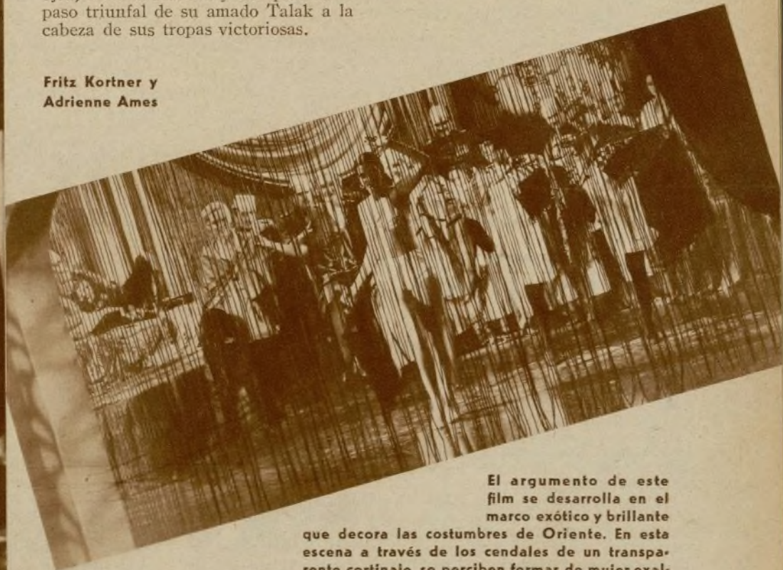
Fritz Kortner y Adrienne Ames

El argumento de este film se desarrolla en el marco exótico y brillante que decora las costumbres de Oriente. En esta escena a través de los cendales de un transparente cortinaje, se perciben formas de mujer exaltadas por las danzas sensuales de estas tierras de sol, encendidas en el fuego de todas las pasiones de la materia. Fritz Kortner, Nils Asther y Adrienne Ames, son los protagonistas de este film distribuido por Cifesa.