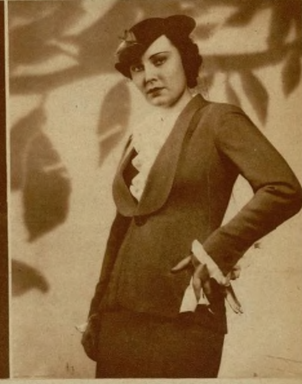
LOS INTERPRETES DE "BARCAROLA"

el curso de una apuesta, pone una sola bala en el barrilete de su revólver, que hace rodar hasta que él mismo no sabe el lugar que ésta ocupa. Toma después la pistola, apunta, dispara... y la bala estaba en el lugar preciso para que no fallara el tiro.