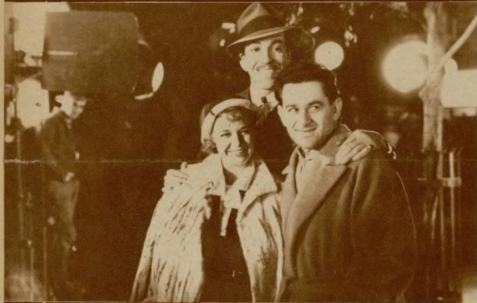
César Romero, Margaret Sullivan y William Wyler, aprovechan un descanso en el estudio para posar como buenos compañeros ante la cámara.