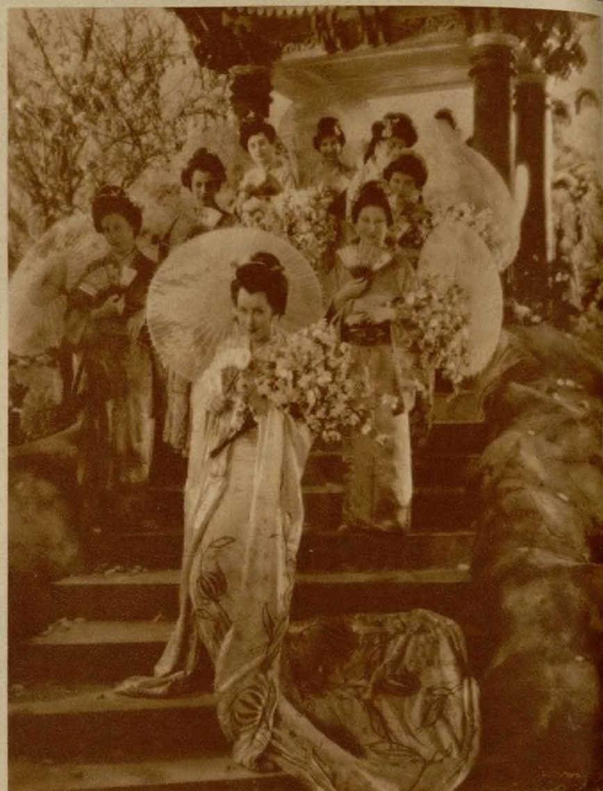
Una original escena de conjunto de «Una noche de amor»

¡Que se cree usted eso! Esta noche, después de cenar, ha consultado usted la horrible libreta memorándum. Tiene usted una recepción en tal sitio, después un baile que da Fulano a quien no se debe desairar, y finalmente una audición por la radio a las 11'42... Precisamente a las 11'42. ¡Que una mujer tenga que sujetarse a