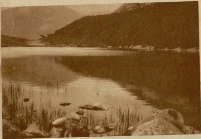
"Octubre" de Juan Roig

—Sí, todo está muy bien cuando de criticar obras se trata; pero es que usted lo que más duramente censura es la organización de