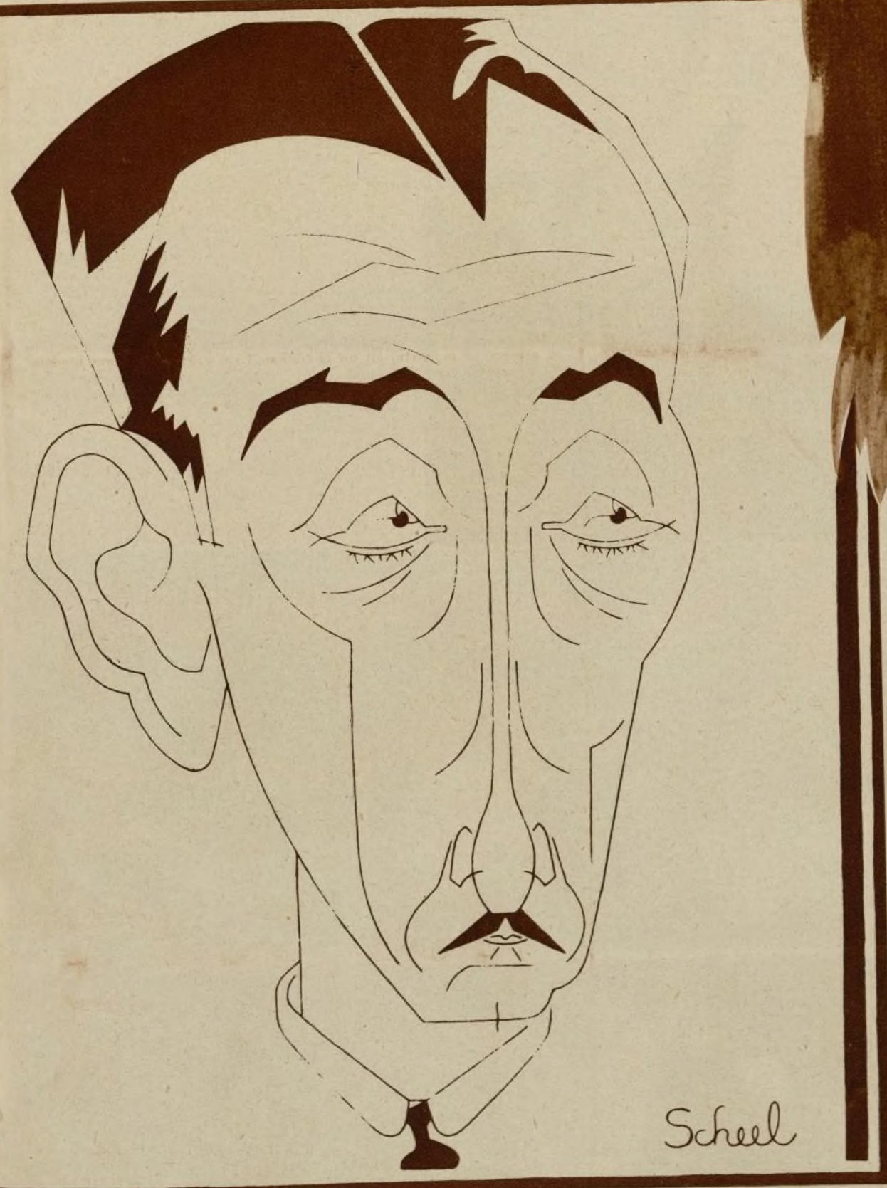
Adolfo Menjou el hombre más elegante de Hollywood, debe a su sastre la posición que ocupa en el cinema yanqui.

Cecil B. de Mille, el gran realizador de films históricos, tiene una extraña y original manía: la de usar botas mientras trabaja en el estudio.