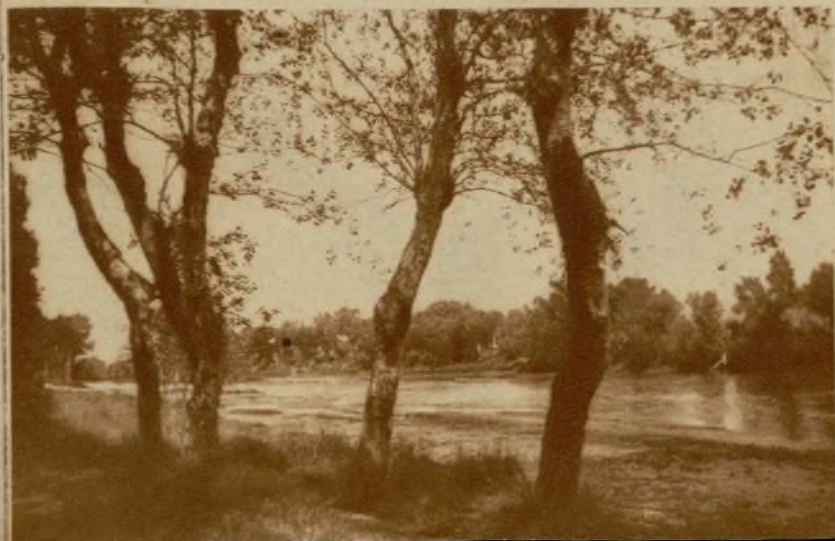
"Baix Llobregat" film inédito de Amadeo Real