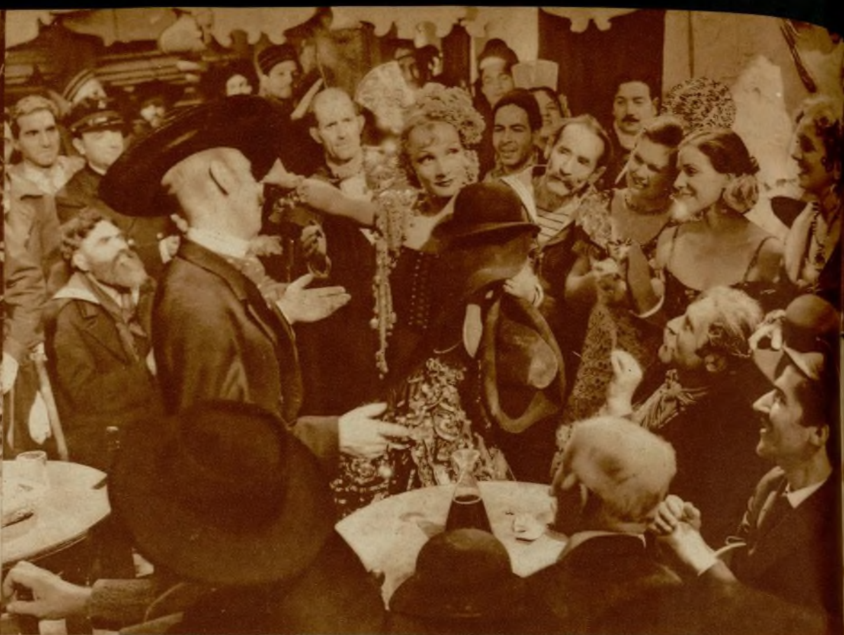
...La España de Sternberg es una España de dormilona después de una borrachera.