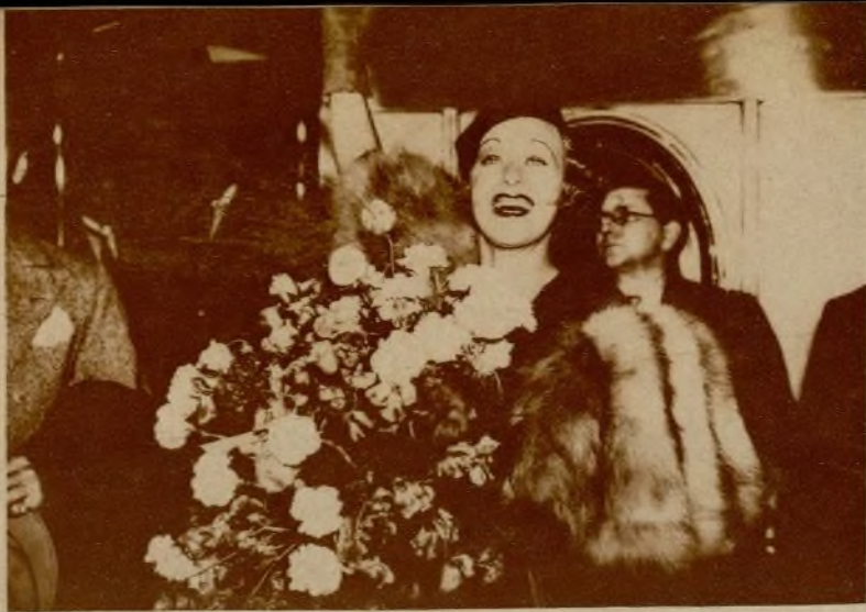
Grace Moore acaba de llegar a Europa para cantar en sus primeros teatros de ópera. Héla aquí dirigiendo un cordial saludo a los admiradores que fueron a recibirla a la estación Victoria de Londres.