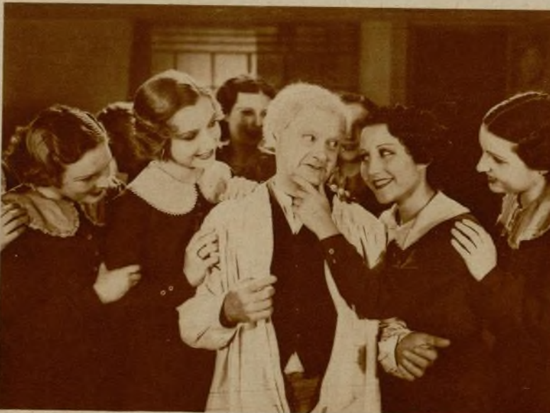
Otra de las escenas, ya rodadas, de este film nacional en curso de rodaje.