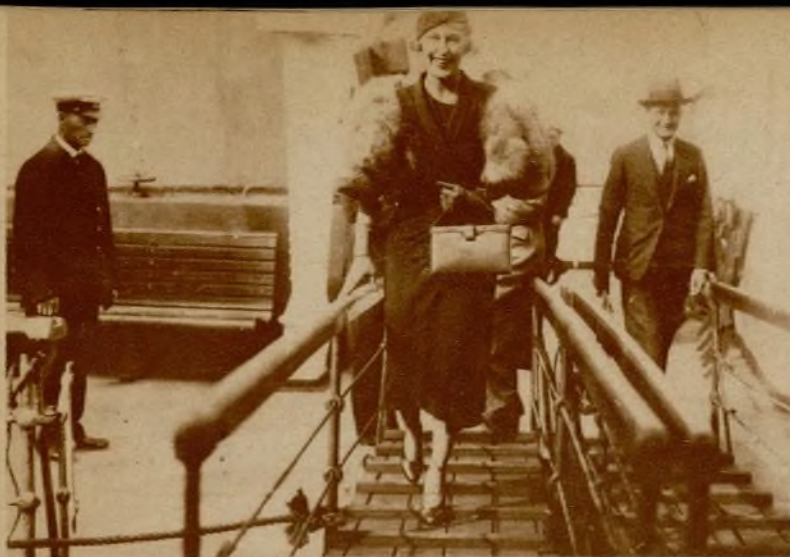
Grace Moore a su llegada a Dover, procedente de América, demuestra su alegría por la entusiasta acogida que le dispensan sus admiradores.