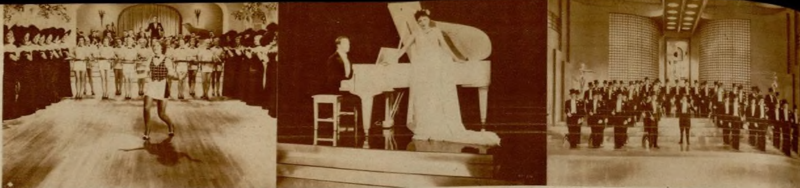
Ilustran esta página varias escenas de "Casino de París", film musical de la Warner Bros, con Al Jolson, Glenda Farrell y Ruby Keeler, como protagonistas.

Contratado en la actualidad para cantar por radio, Al Jolson tuvo que presentarse en la Emisora el día de su llegada, declarando que siente extraordinario entusiasmo por estas transmisiones que alcanzan tan extenso radio de acción, que le parece que cuando canta ante este micrófono está impresionando con su sentimentalismo al mundo entero.