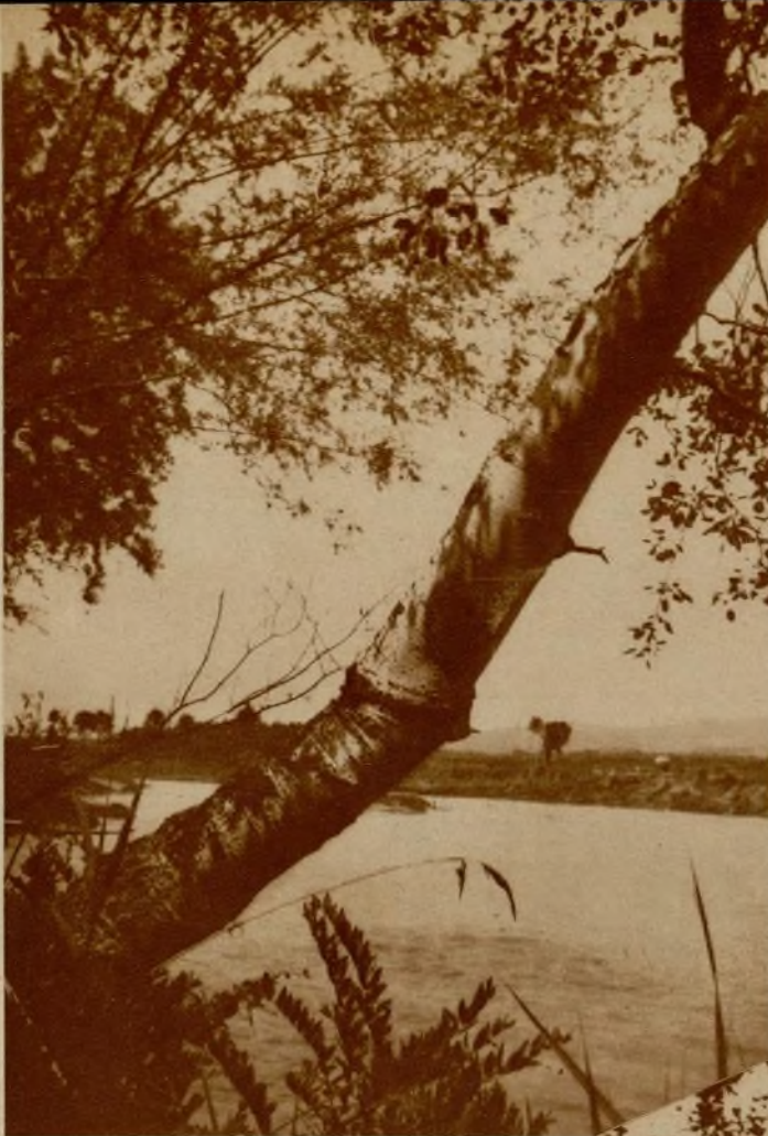
Dos instantáneas bellísimas de "Baix llobregat" de Amadeo Real.