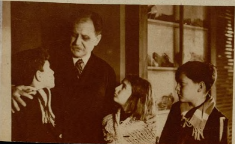
Una escena del film nacional "Los 20.000 duros".