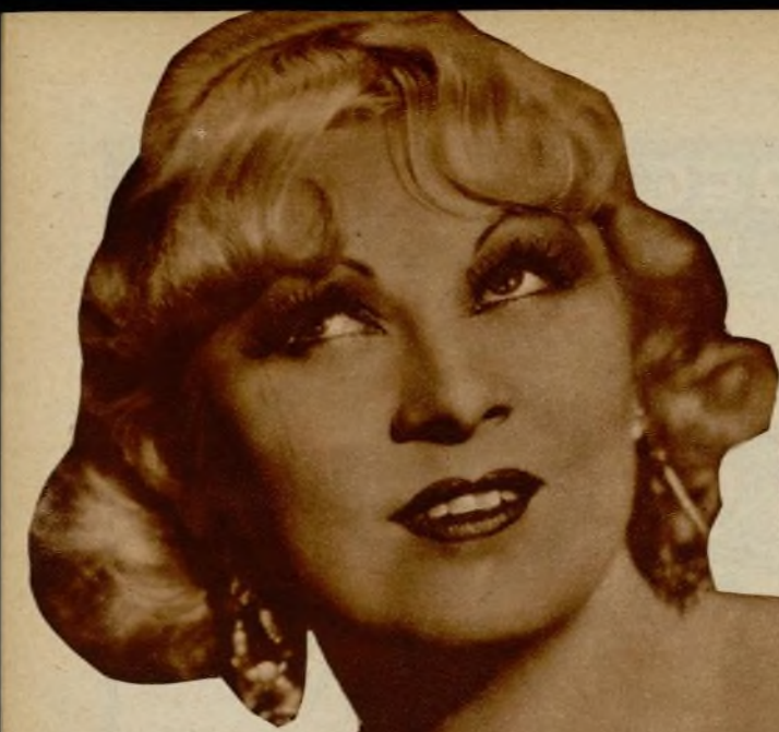
Mae West, la auténtica representante del sex-appeal en Norteamérica.

canos, y, gente despreocupada, alegre y sobre todo negociantes de mucha vista, llegaron a la conclusión de que al cinema le faltaba una buena dosis de pimienta, mujeres bonitas, desenfadas y, sobre todo, mucho menos peligrosas para el espectador que las de carne y hueso.