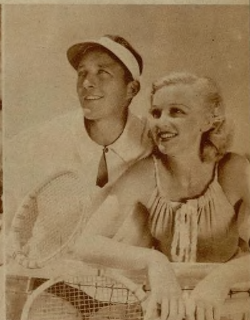
Tres instantáneas de los esposos Bing Crosby y Dixie Lee, una de las parejas más enamoradas de Hollywood.

los de azahar». En una de las escenas, la cámara nos muestra a Joe Morrison queriendo hacer dormir a Dixie Lee con una de sus canciones, mientras ella procura secarse del chaparrón que los pilló en pleno campo, calándoles hasta los huesos, tendida en el piano de cola y envuelta en una gruesa manta.