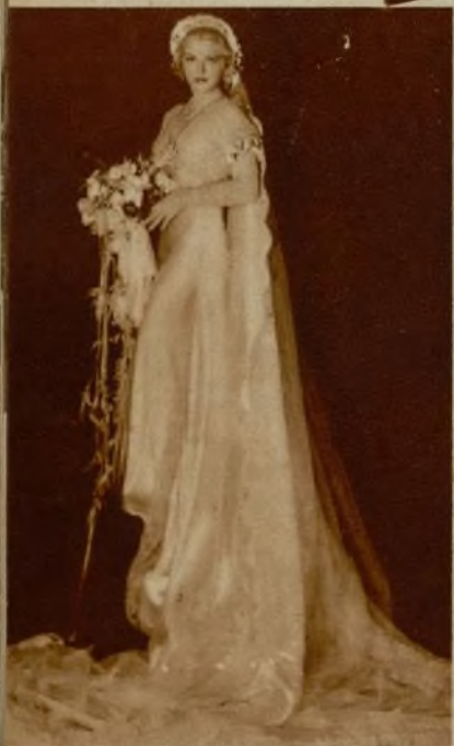
El traje de novia es el que más me gusta de cuantos pueda vestir una mujer—dice Claire Trevor—, y al igual que ella, opina por lo menos, la mitad del bello sexo.

Claire Trevor. Aunque la joven estrella de la Fox tiene una personalidad propia y un modo de «hacer» completamente personal, la doble influencia de la Pickford y de la Gaynor es evidente idéntica dulzura de expresión que ambas gloriosas actrices, igual sobriedad mímica, semejante naturalidad en la acción ante la cámara. Pero—hay que decirlo—mejor figura y tan bonita, por lo menos, como la que fué considerada como la «muñeca del mundo».