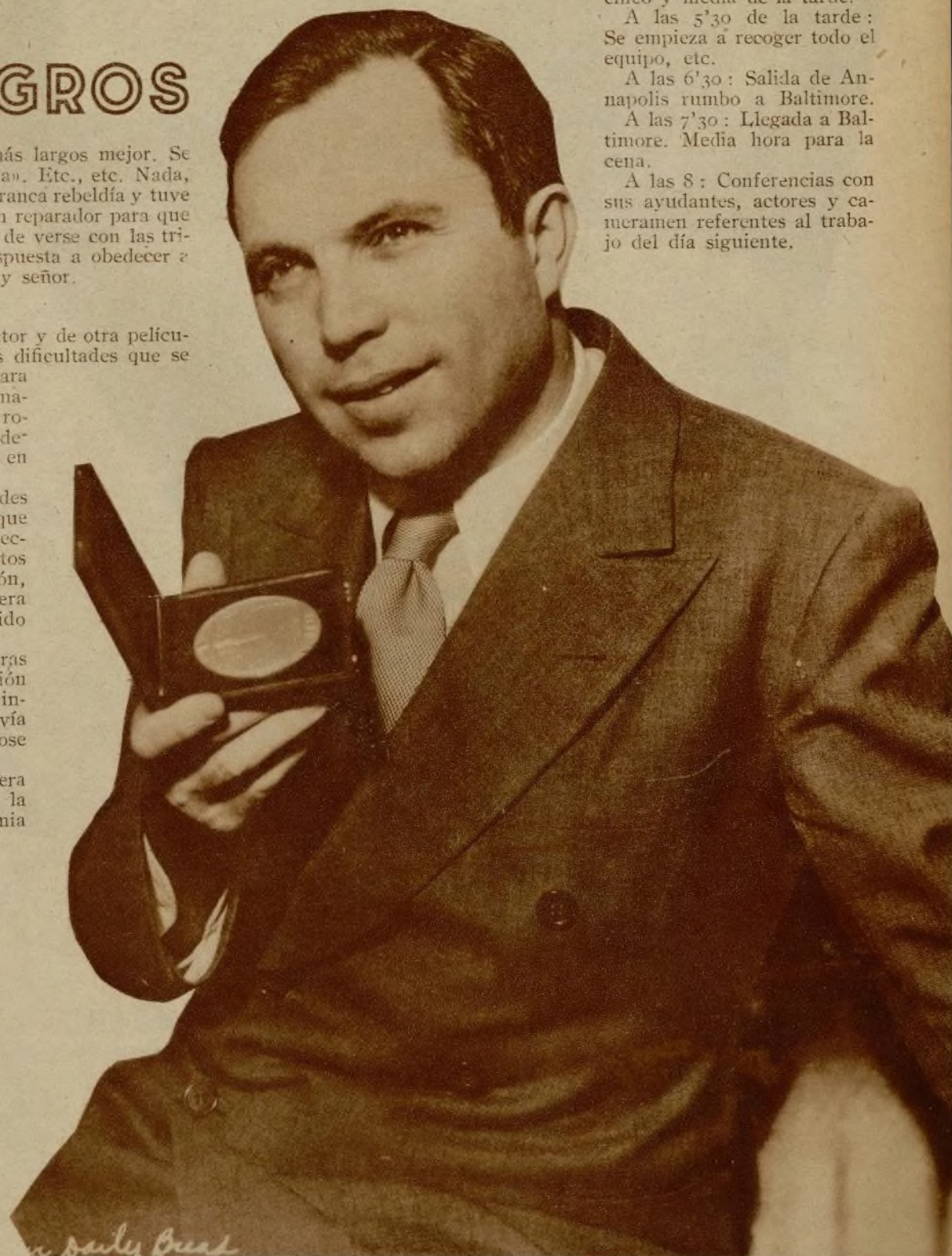
He aquí a King Vidor, el gran realizador yanqui, mostrando en su mano la medalla de oro con que la Liga de las Naciones premió su última producción «El Pan nuestro», considerada por el citado Tribunal internacional como «la más sobresaliente dirección cinematográfica en 1934».

A las 8: Conferencias con sus ayudantes, actores y cameramen referentes al trabajo del día siguiente.