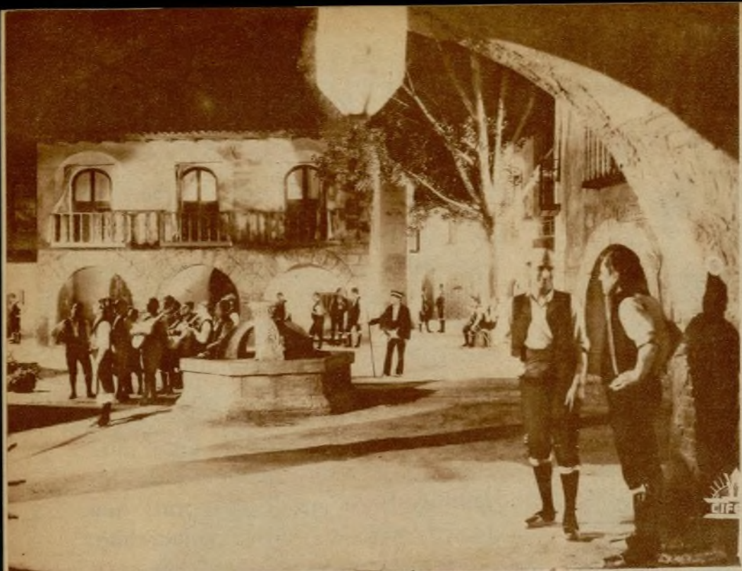
Mozos de ronda en una escena de «Nobleza baturra».