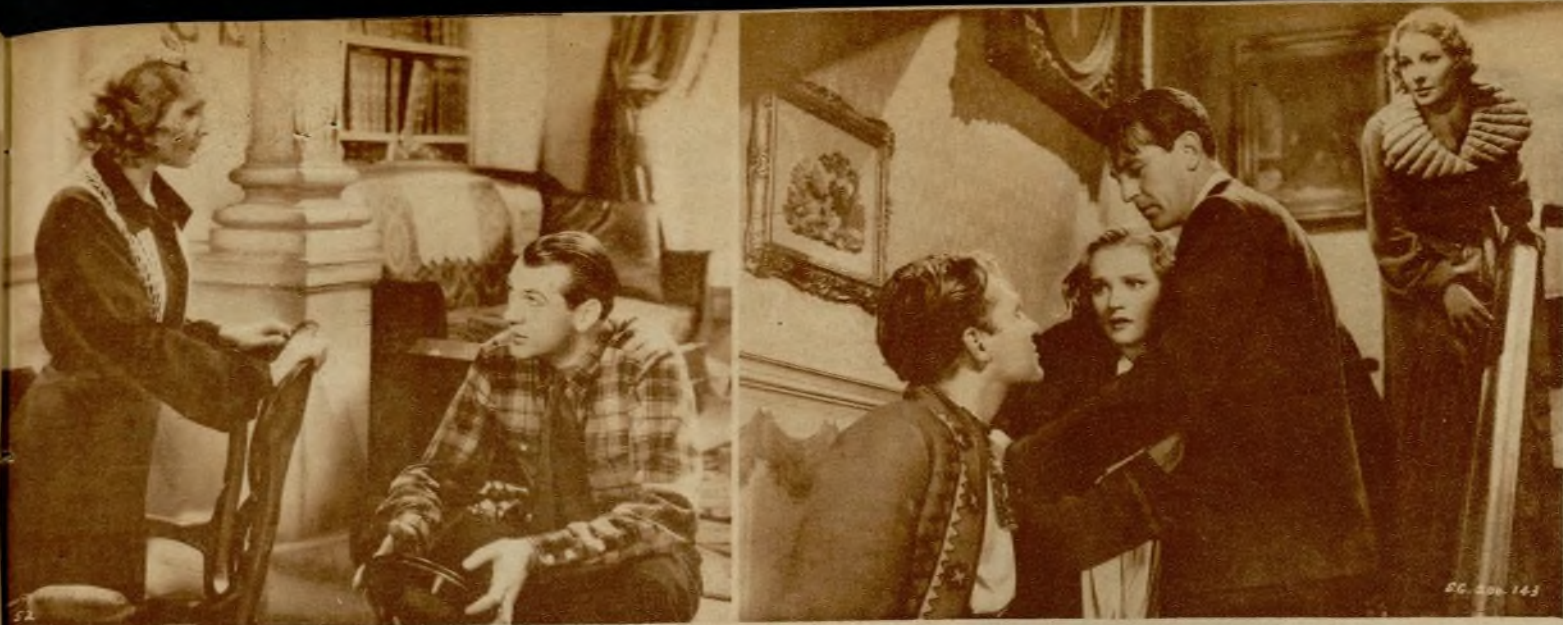
Dos interesantes escenas del último film realizado para los Artistas Asociados por el gran realizador King Vidor. El título del film, «Noche nupcial», y los protagonistas Anna Sten y Gary Cooper.