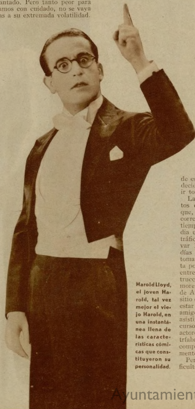
Harold Lloyd, el joven Harold, tal vez mejor el viejo Harold, en una instantánea llena de las características cómicas que constituyeron su personalidad.

Llega a Baltimore y la primera noticia que recibe es de que en la academia citada hay una epidemia