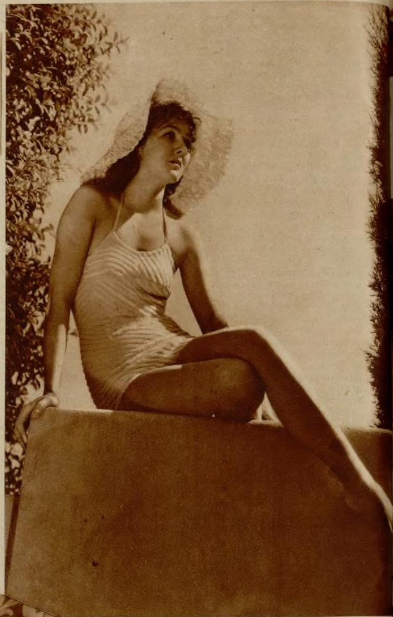
Jean Parker, que siempre fué símbolo de la ingenuidad, ha de rendir tributo de desnudo al imperativo categórico del sex-appeal.

Las girls han nacido un poco en cada sitio, y son amablemente impúdicas. No podemos abrir una revista sin tener que admirar las piernas de Marlene Dietrich o de algunas docenas de desconocidas que unas veces se llaman Kay, otras Joan, Dixie, Alice o Belle..., pero, ¡ay, de vosotros el día que pretendáis ver al desnudo la troupe de girls, puro sex-appeal de una gran producción americana! Encontraréis entre ellas todo lo contrario a lo que esperarabais.