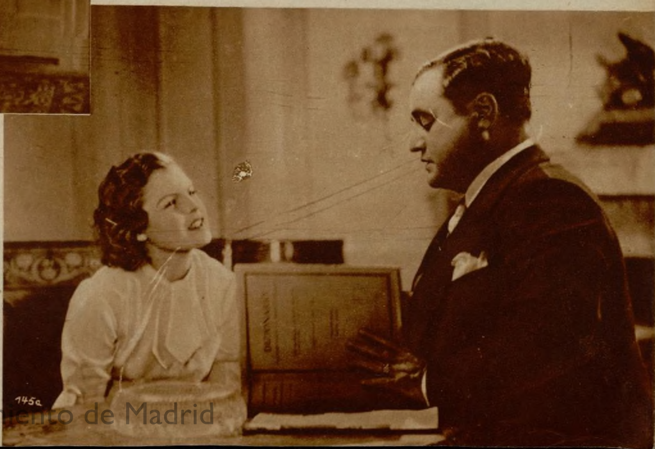
Magda Schneider y Benjamino Gigli en otra escena del mismo film