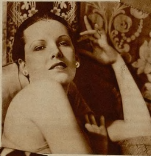
Gail Patrick, vista por la cámara con ganas de exaltar ritmos y formas.

De todas maneras, no abandonan jamás la fórmula con la cual conquistaron los mayores éxitos: girls, mujeres bonitas (?), pimienta, gracia y eso..., eso... Llámelo como quieran. El sex-appeal.