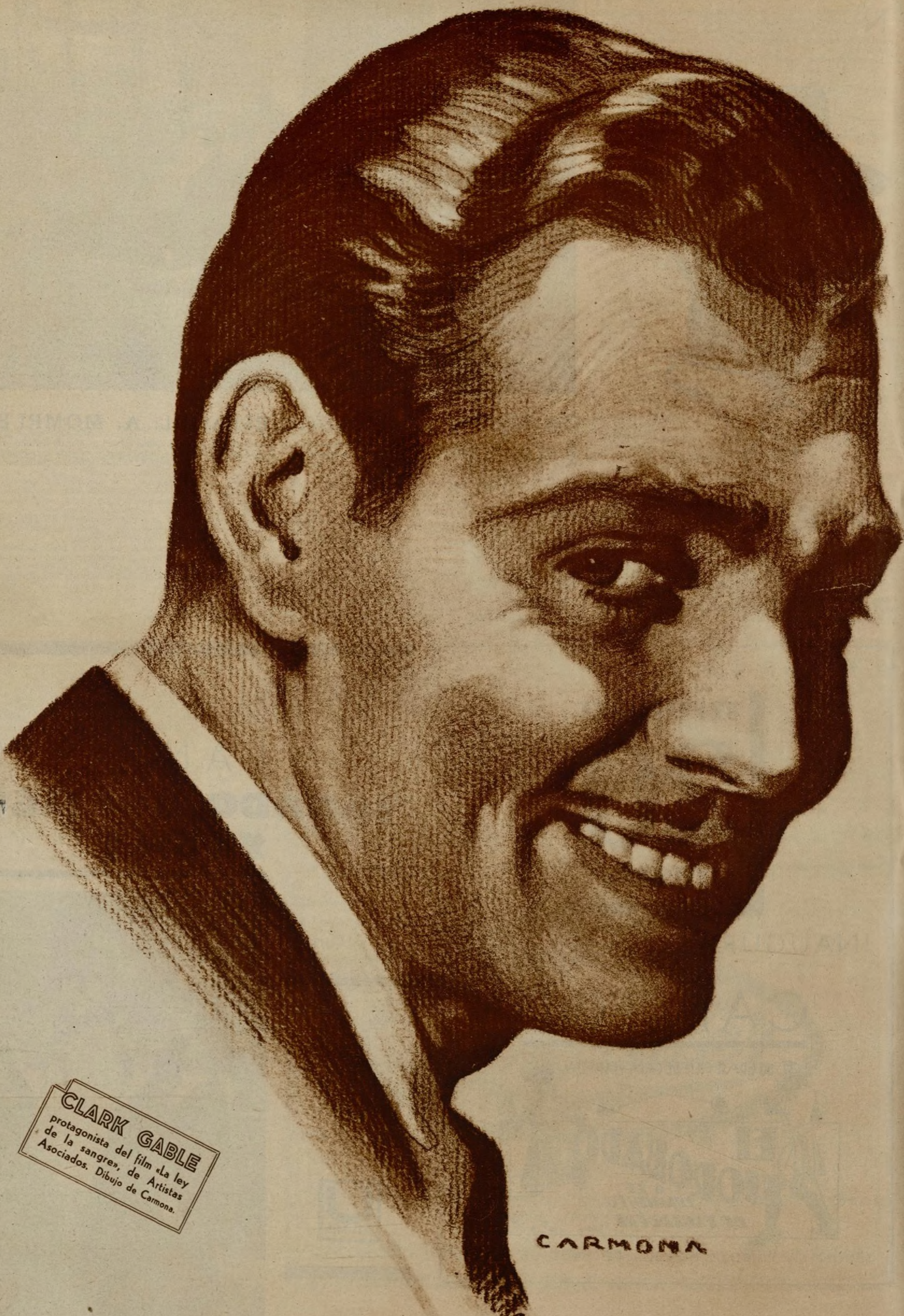
CLARK GABLE protagonista del film «La ley de la sangre», de Artistas Asociados. Dibujo de Carmona.