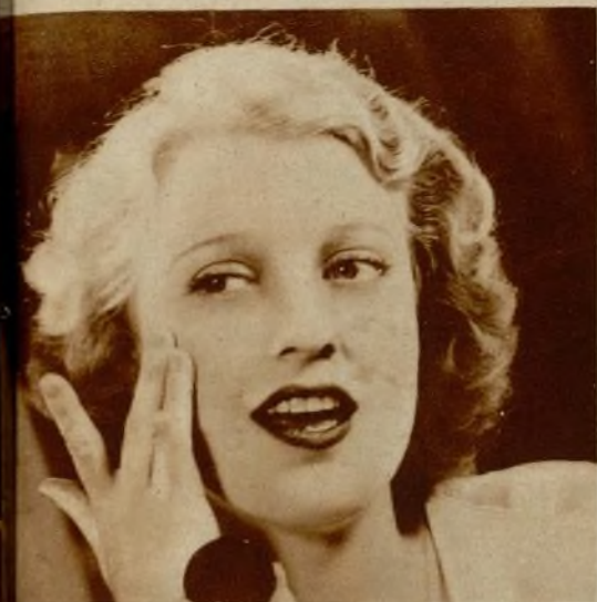
JEANNETTE MC. DONALD

Nació en Nueva York el 6 de mayo de 1910. Era actriz de variedades y conoció en aquel entonces a su esposo, Al Jolson, durante su actuación en un salón de variedades de la gran ciudad. Fue incorporada al cinema por la Warner, como intérprete de «La calle 42», en la que obtuvo un triunfo apoteósico. Su último film, «Casino de París», le interpreta teniendo como «partenaires» a su marido. Tiene cabello negro, ojos verdes y es tímida, modesta y dulcísima.