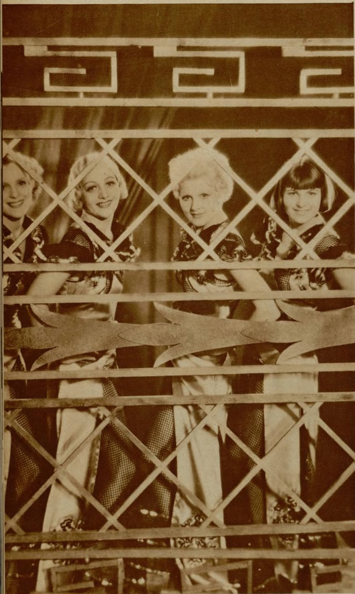
He aquí cuatro lindas muchachas cuya belleza decora las escenas de «El Baile del Savoy», film Universal, al que también pertenecen las dos escenas que cierran este comentario.