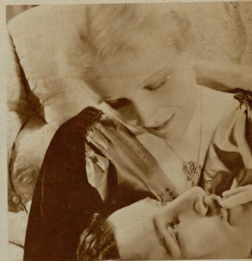
Ann Harding y John Boles en «La hija de nadie», film estrenado por «R. K. O.» la pasada temporada.

Un divorcio... En América, cuando se trata de una vedette de la categoría de Ann Harding, significa grandes titulares a tres columnas en la primera página de los periódicos, interviús, todo un movimiento de curiosidad un poco malsana.