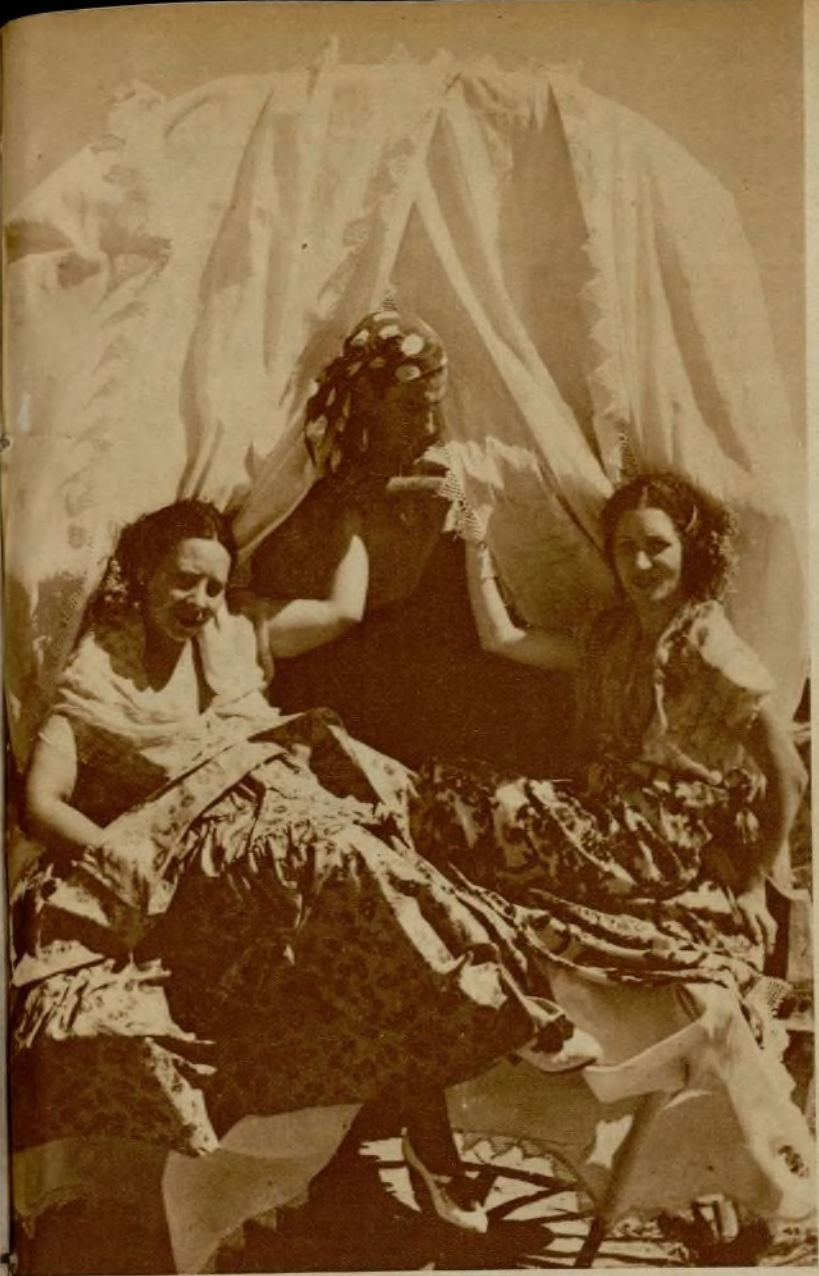
Una escena del film amateur "Andalucía", de Arturo Roig