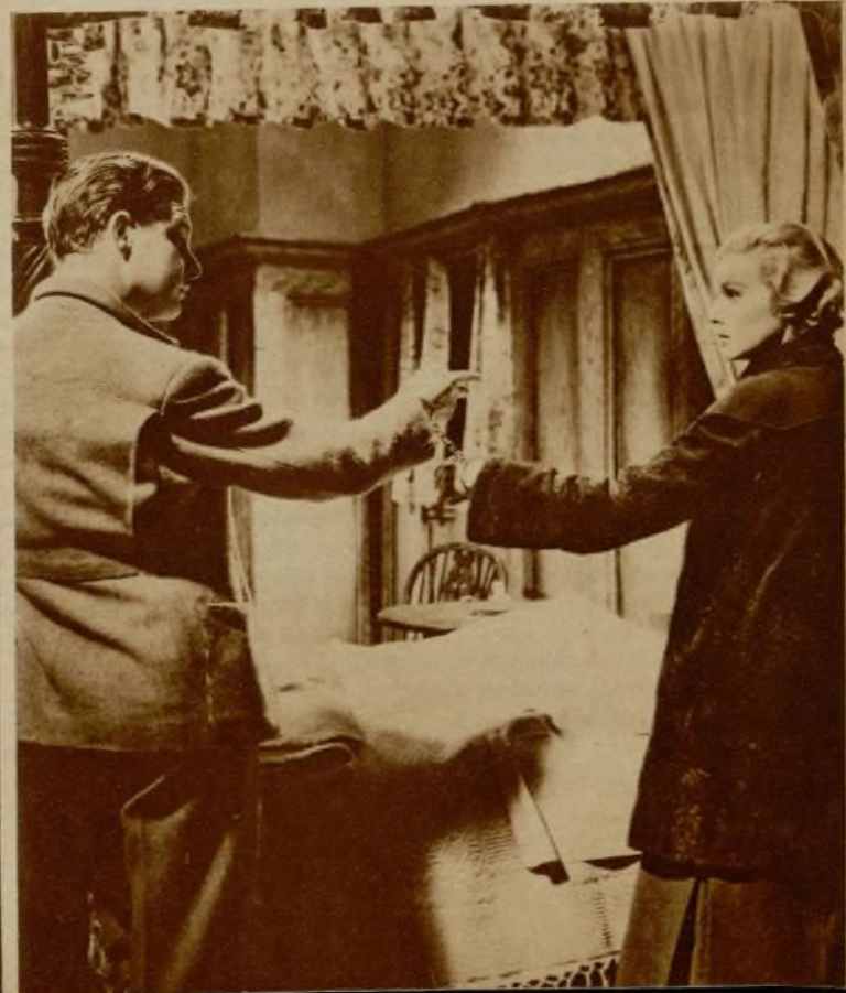
Robert Donat y Madeleine Carroll en una escena de «Los 39 escalones».

«Los 39 escalones» es el título de un drama de espionaje y misterio, en el que el interés comienza donde empieza la película, y no decae un momento hasta el fin. Nos hace seguir las vicisitudes de Robert Donat desde que una joven extranjera, que le ha acompañado a su domicilio en circunstancias poco frecuentes, muere asesinada por dos hombres que la persiguen, y que tienen el mayor interés en hacer desaparecer a Donat. Este se encuentra acosado a un tiempo por la policía, que le cree culpable del asesinato, y por toda una banda de espías. Está a punto de ser apresado cuando descubre a Madeleine Carroll en un compartimiento del tren en el cual trata de huir a Escocia, para descifrar allí el misterio de la joven asesinada, y no tiene mejor ocurrencia que la de sentarse al lado de la bellísima Miss Carroll y abrazarla frenéticamente, como medio de hurtar el rostro de la vigilancia de los detectives. Logra escapar por los páramos escoceses, pero cae en poder del jefe de la banda de espías. La forma en que consigue eludir la vigilancia de éste y el desenlace del misterio, que tiene lugar de un modo tan sorprendente como ingenioso, constituyen las escenas culminantes de este film, que ha sido dirigido por Alfred Hitchcock, con la maestría que tanta fama dió a su labor en «El hombre que sabía demasiado». Para él, y para Robert Donat y Madeleine Carroll y el admirable y numerosísimo conjunto que les secunda, es el éxito de esta nueva producción de la Gaumont-British.