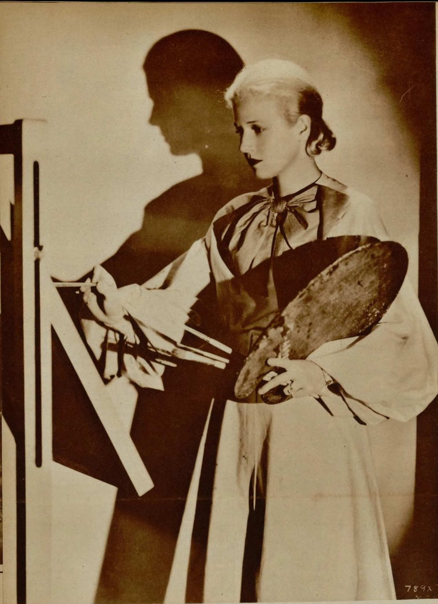
Ann Harding, tal como la vimos no hace mucho en una de las últimas películas que hizo para la Metro. — Esta editora no la «comprendió» y hoy forma en el elenco de «R. K. O.» y ocupa uno de los primeros lugares del cine.

Cuando llegó a Hollywood, hará cerca de seis años, parecía tan fuerte, tan serena, tan segura de sí misma, que nadie habría creído que la desgracia pudiese llegar hasta ella. Era la época en que el advenimiento del parlante había revolucionado el arte y la industria cinematográfica hasta sus cimientos; en que las estrellas se fabricaban para volver a desaparecer en un solo film; en que Hollywood estaba lleno de recién llegados que eran arrastrados por la enorme ola que hacía desfilas hacia el Oeste todas las glorias de los teatros de Broadway.