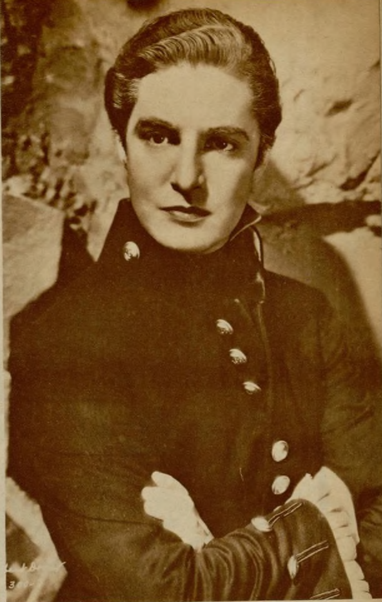
Robert Donat en «El Conde de Montecristo»