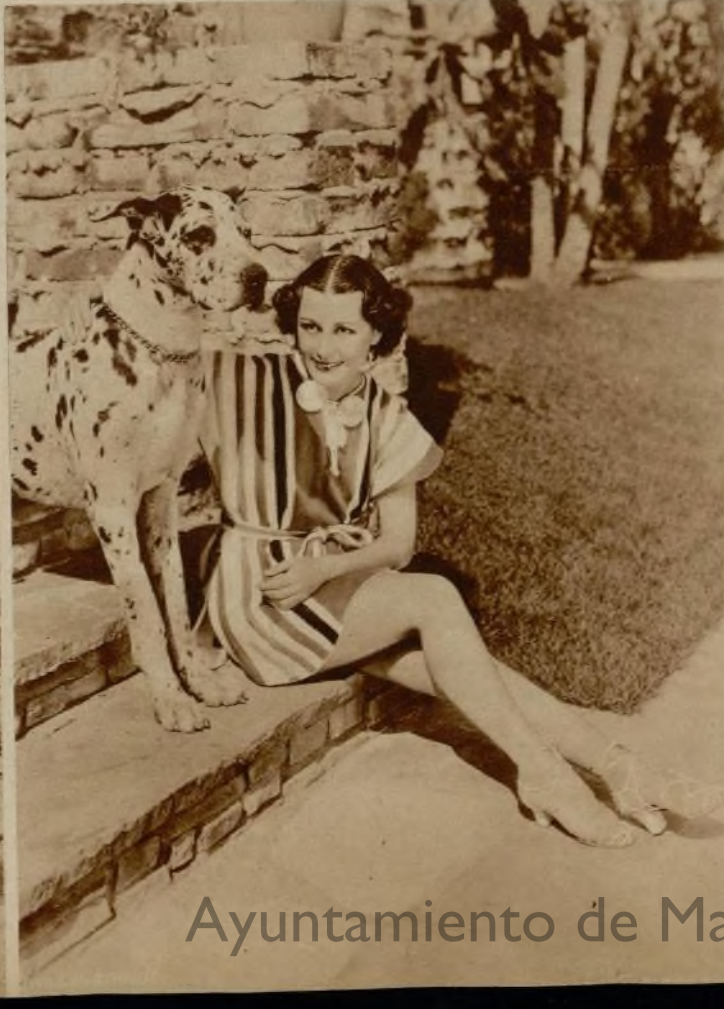
Gladys Swarthout, belleza perfecta, se nos ofrece en traje de baño durante su veraneo en Palm Beach.

Jinete consumado la bella cantante no deja ninguna mañana su paseo a caballo. En la fotografía aparece Gladys llevando de la rienda a su favorito.