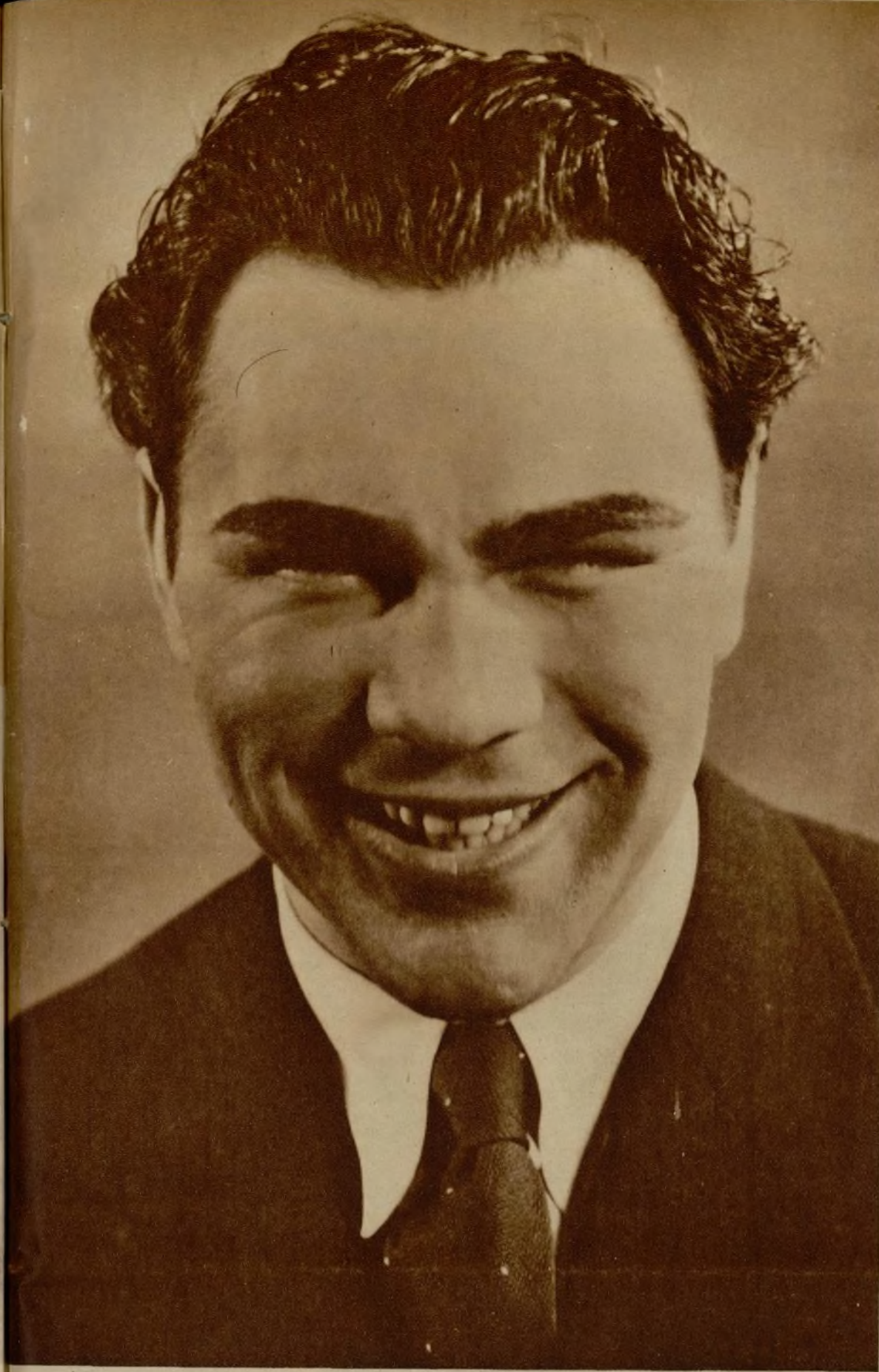
Max Schmeling, campeón internacional de boxeo y actor universal, vuelve al cine en «Knock-out», en el que colabora con su esposa, la famosa actriz Anny Ondra, con la que aparece en la parte inferior en una escena de este film.