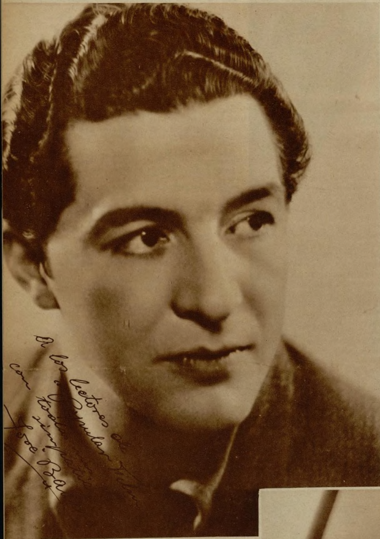
José Baviera, uno de los primeros galanes del film nacional, y tal vez uno de los que más títulos cuenta en su haber cinematográfico, ofrece una fotografía dedicada a nuestros lectores —José Baviera ha tomado parte este año en las siguientes producciones: "20.000 duros", "Madre Alegría" "El octavo mandamiento" y "La farándula", esta última en plan de rodaje en la actualidad.