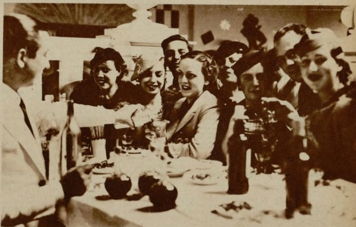
INAUGURACIÓN DE LOS ESTUDIOS BALLESTEROS TONA FILM, EN MADRID. Dos aspectos de la fiesta celebrada en los estudios Ballesteros Tona Film, con motivo de su inauguración. Entre los asistentes, algunas artistas españolas y personalidades varias del mundillo cinematográfico madrileño.