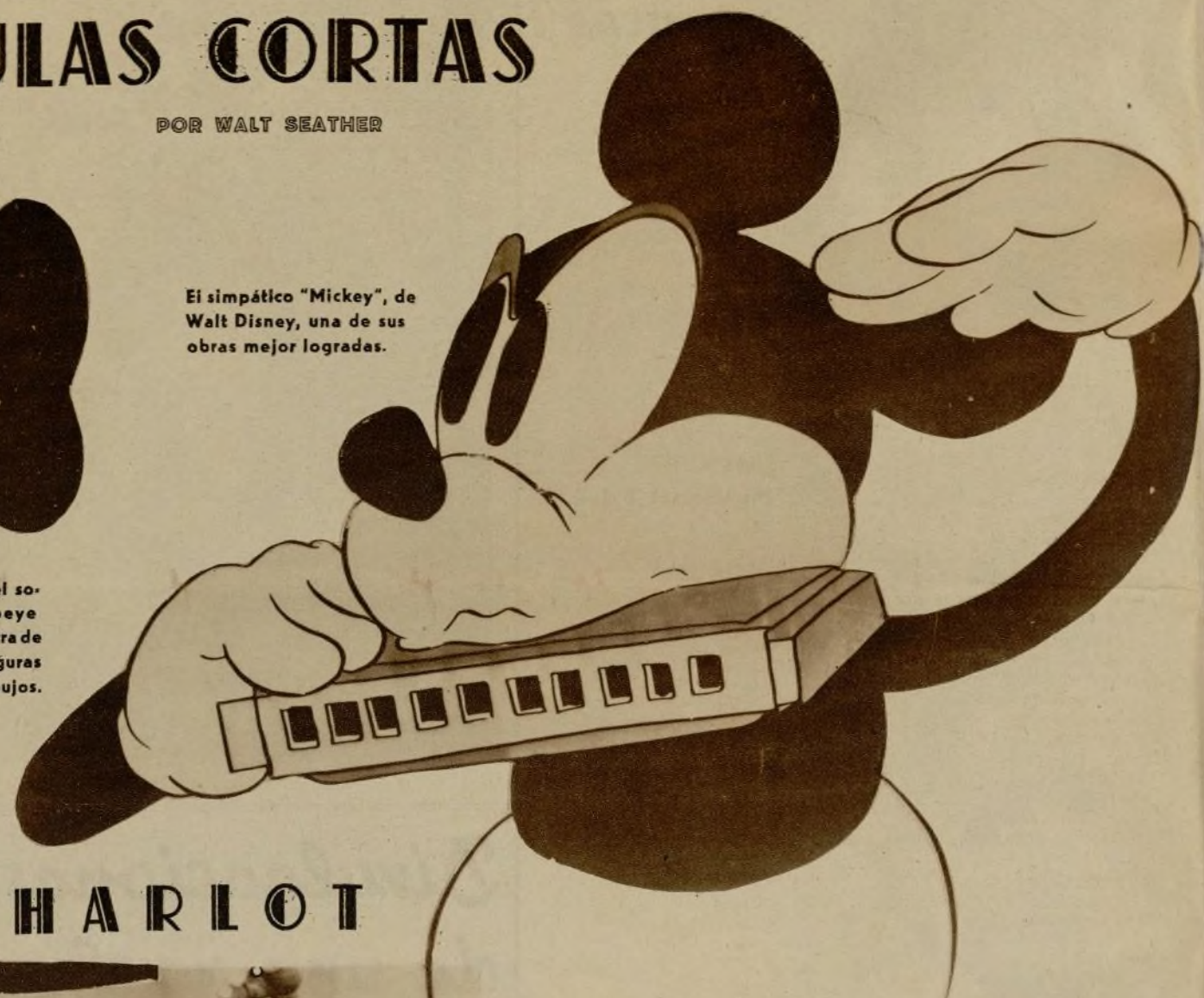
El simpático "Mickey", de Walt Disney, una de sus obras mejor logradas.