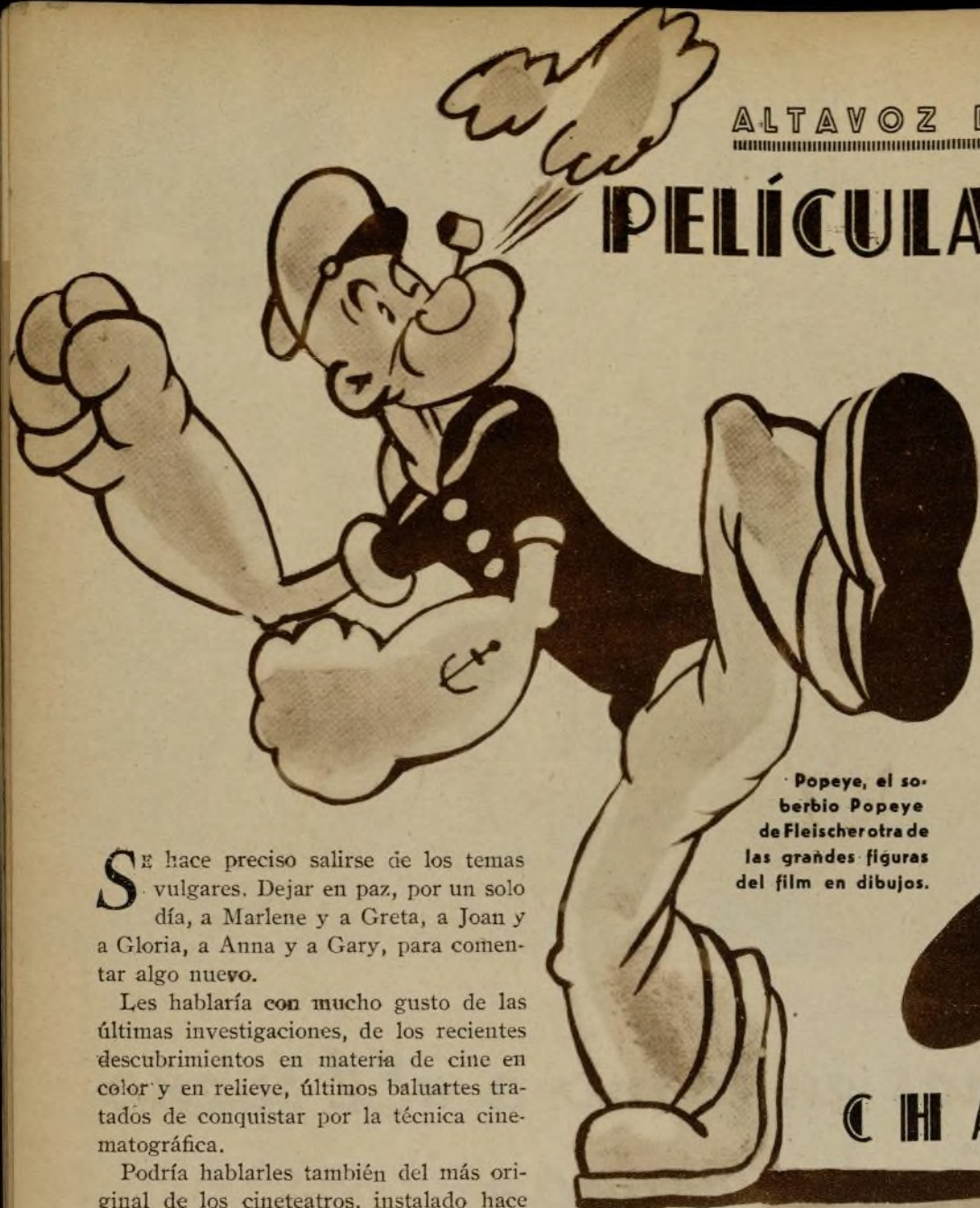
Popeye, el soberbio Popeye de Fleischer, una de las grandes figuras del film en dibujos.