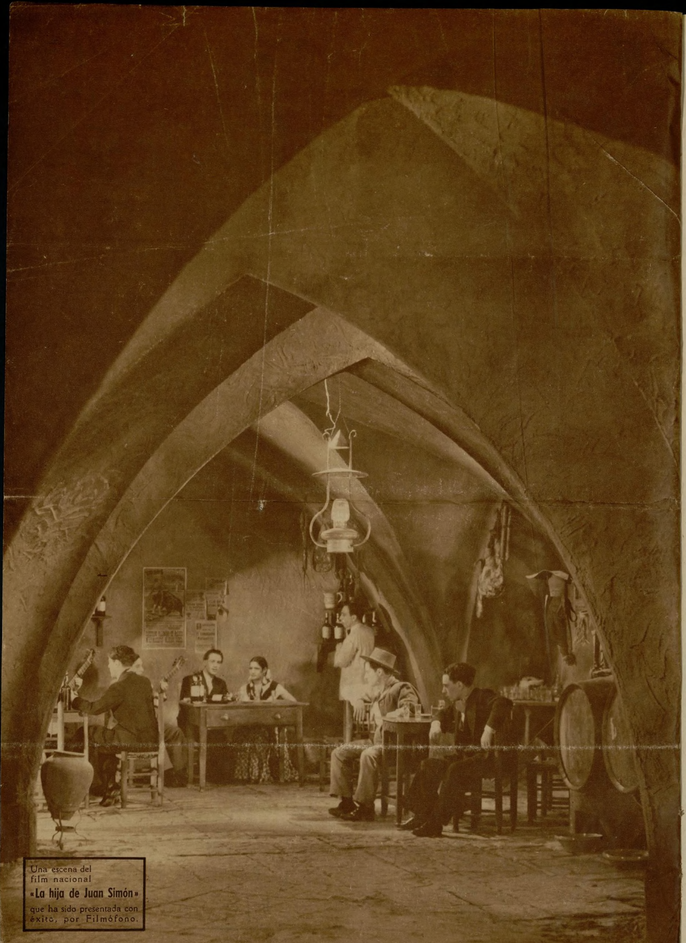
Una escena del film nacional «La hija de Juan Simón» que ha sido presentada con éxito, por Filmófono.