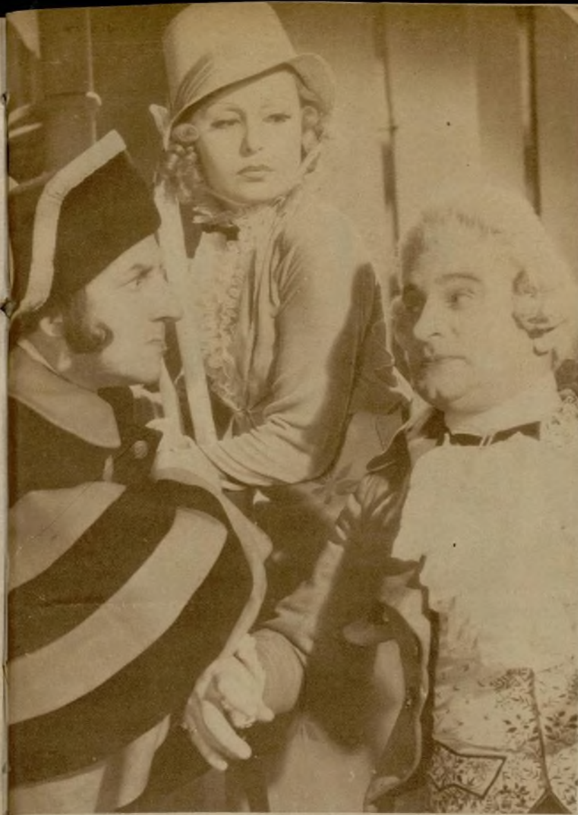
Una escena de «La bailarina de conjunto», primer film realizado por Lilian Harvey en Inglaterra en los estudios de la B. I. P. Este film nos será en breve presentado por la marca valenciana Cifesa.