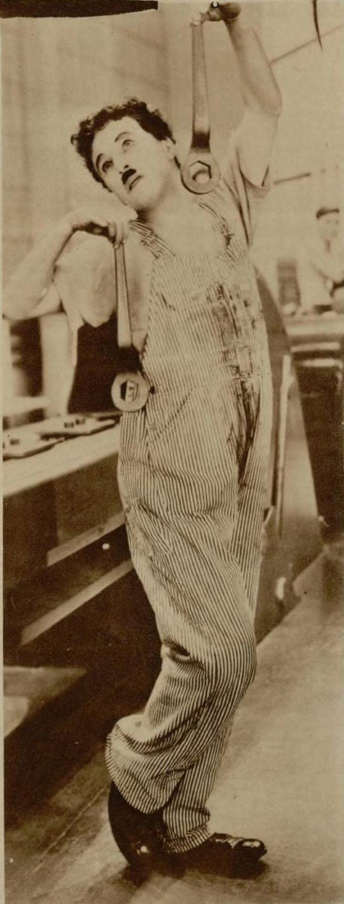
Una graciosa instantánea del genio del cinema mudo, en su último film "Tiempos modernos", que veremos en breve.

SE hace preciso salirse de los temas vulgares. Dejar en paz, por un solo día, a Marlene y a Greta, a Joan y a Gloria, a Anna y a Gary, para comentar algo nuevo.