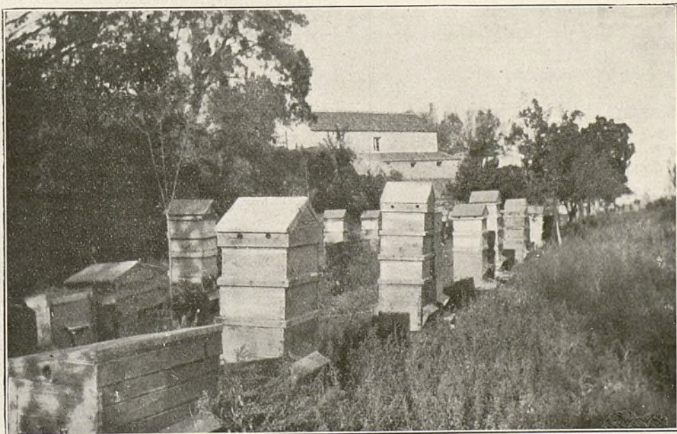
«El Roncal».—Colmenar del Real Monasterio de San Lorenzo de El Escorial.

de los dos modelos que utiliza de colmenas, y tuve la satisfacción de que coincidiese, con mi poco autorizada opinión, determinando su preferencia por el sistema Dadant, o sea la colmena de alzas. Los ensayos que llevo practicados en Miraflores de la Sierra, me han llevado a la misma conclusión. En otras regiones sé que la colmena Layens tiene mayor aceptación. La invernada, a mi juicio, se realiza en mejores condiciones en las Dadant; hay menor consumo de miel, es rarísimo el enmohecimiento de panales y el calor se conserva con más uniformidad. He ensayado invernada de Layens con y sin separador con todos los cuadros o sólo con ocho o 10, y siempre he obtenido peores resultados que con la Dadant. En cuanto a la cosecha, rara vez he conseguido ver completamente llenos los 20 cuadros de una Layens, y en cambio varias veces he retirado tres y has-