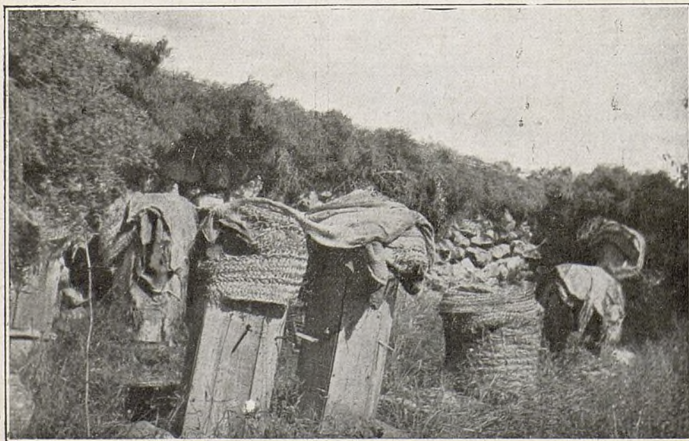
Colmenar primitivo en los Montes de Granada.

Septiembre. Sirvent. La gran semana apícola.— Devauchelle. Enfermedad de la isla de Wight.— Sevalle. Doble reunión.— Henaut. Las abejas y el 14 de Julio.— Baldensperger. Apicultura mediterránea.— A. P. Acerca de las colmenas alemanas.— Hetroy. Colmena con doble entrada.— Brunet. Petición de consejos a los émulos del A. Pincof.— M. P. Pequeño invento: asas portátiles para colmenas.—Noticias de colmenares.—Revista de revistas.