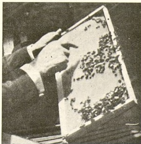
Emoción cortesana. ¡He aquí la Reina!