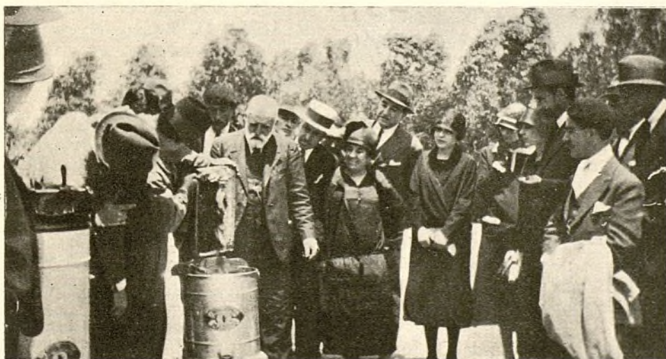
Los alumnos del Sr. Trigo desoperculando algunos panales para ponerlos en el extractor.

toda la vida horas pasadas en esa convivencia con el más maravilloso de los insectos, aleccionados por profesor que también sabe escudriñar sus secretos y deducir tan sabias enseñanzas, aprendiendo qué gran aglutinante, qué gran nivelador y qué gran reconfortante es el trabajo .