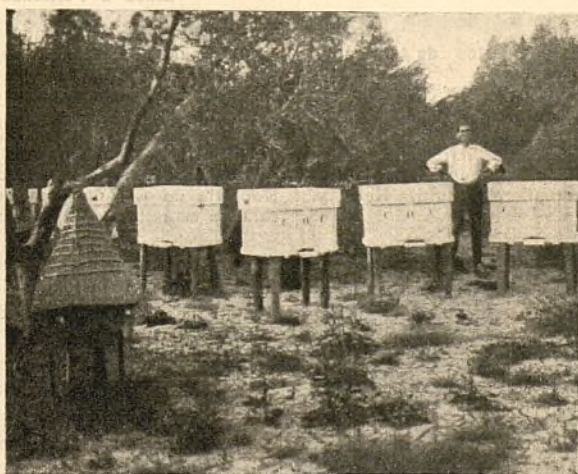
Colmenas en zancos para preservarlas de inundaciones. (Carcagente)