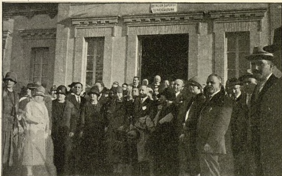
El Comisario Regio de la Seda (1) y el Director de la Estación Sericícola (2), rodeados de los Maestros que asistieron al curso.

presenta varias variedades, de las cuales las más importantes son: la roja en Italia y la blanca en España.