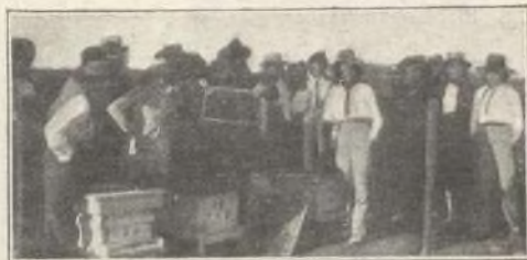
El Director del Coto exhibe un magnífico panal de cría y explica a las alumnas cómo se desarrolla ésta.

saber lo que es ese riquísimo néctar que pródigos brindan nuestros campos y se consuma en España la miel, ese alimento desdeñado por descono-