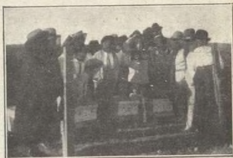
El pequeño ayudante se descubre exhibiendo un panal de cría, para probar a las alumnas que las abejas no son tan fieras como las pintan.

Las múltiples aplicaciones de la miel, casi ignoradas en nuestra patria, en las Escuelas de niñas, deben aprenderse. Algún día llegará en que existan como en el Canadá, Profesoras especializadas, cuya misión es la de explicar en las Escuelas los usos de la