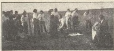
Las alumnas colocándose pantalones para protegerse de los aguijonazos.