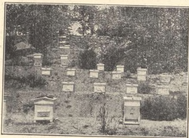
Detalle del colmenar de experimentación

ESCUELA PRÁCTICA DE APICULTURA DE «MENDICOECHEA»