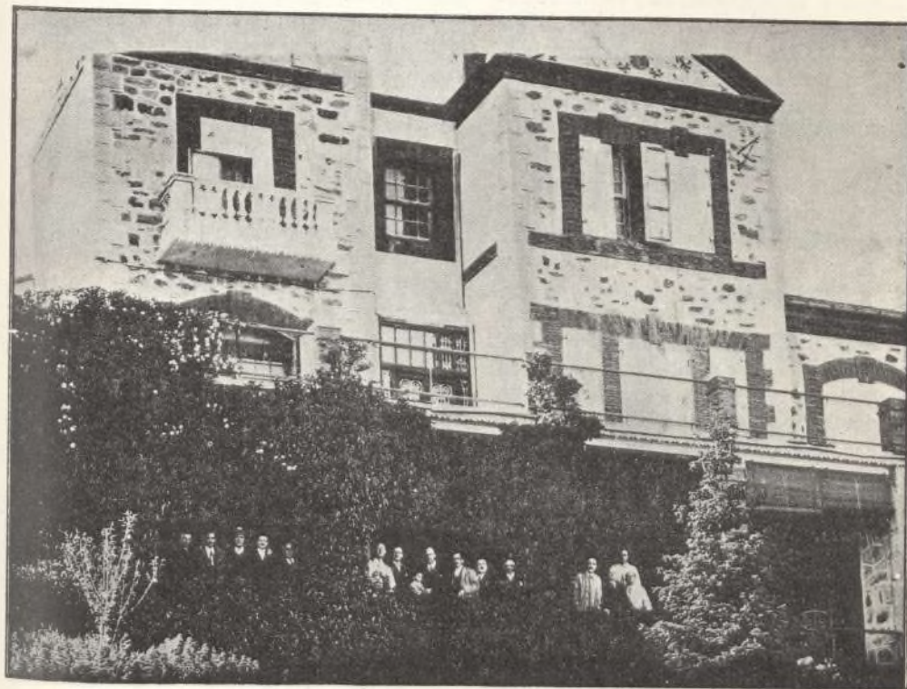
Los alumnos asomados a las ventanas de la clase durante un descanso

principios, es preciso procurar tengan adecuados fines, y hora es de ir pensando, por el Gobierno, y por el Sindicato Nacional de Apicultores, en coordinar, organizar y aprovechar tanta energía, del modo que produzca el máximo rendimiento, unificando la acción de todos y ayudándose mutuamente. No quiero con esto preconizar, librenos Dios, una organización burocrática, centralista, absorbente, perju-