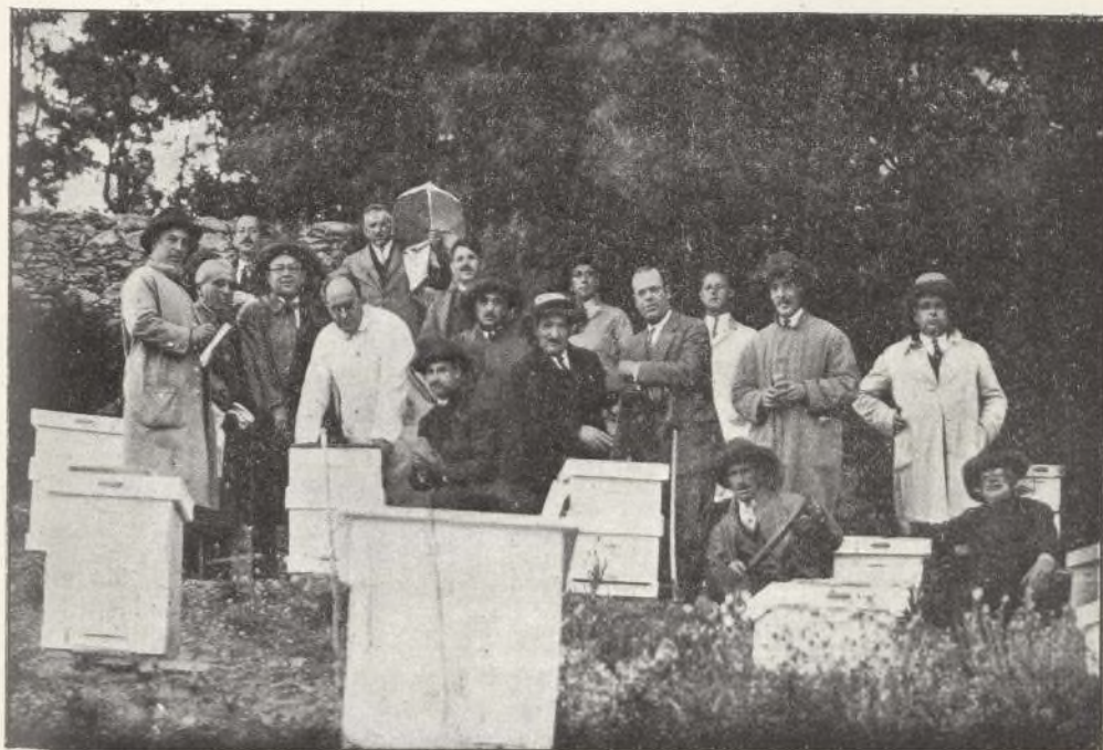
Prácticas en el colmenar. Los alumnos, ya familiarizados con las abejas, arrostran valientemente el disparo fotográfico, despojados de los velos protectores. ¿Valor o... coquetería? ]

Escuela práctica de Apicultura de Mendicoechea (Miraflores de la Sierra, Madrid)