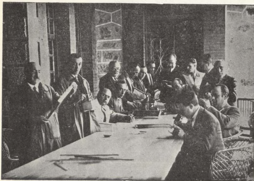
Los alumnos en prácticas de taller y laboratorio.

Escuela práctica de Apicultura de Mendicocoechea (Miraflores de la Sierra, Madrid)