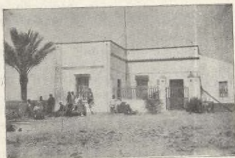
La «Casa de la miel» del Coto de Santa Brígida.

Fué el sitio de la casa, en tiempos semiprehistóricos, templo druida; después, ermita cristiana con culto; ahora, remozado y coquetón, chalecito de traza aristocrática, sin que las transformaciones le hayan borrado el sello cristiano de abolengo, en uno de los pilares del patio de entrada, la mano de D. Isidro ha fijado un mosaico con las palabras AVE MARIA; en otro se destaca un vaso sagrado en relieve, espejo de riqueza artística de La Cartuja, recibiendo en el instante el Pan y el Vino inmortales del drama del Calvario.