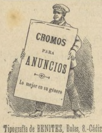
Tipografía de BENITEZ, Bulas, 8.-Cádiz